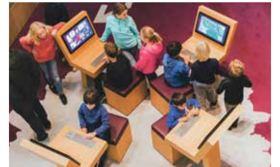
Visite interactive à l'Alimentarium.