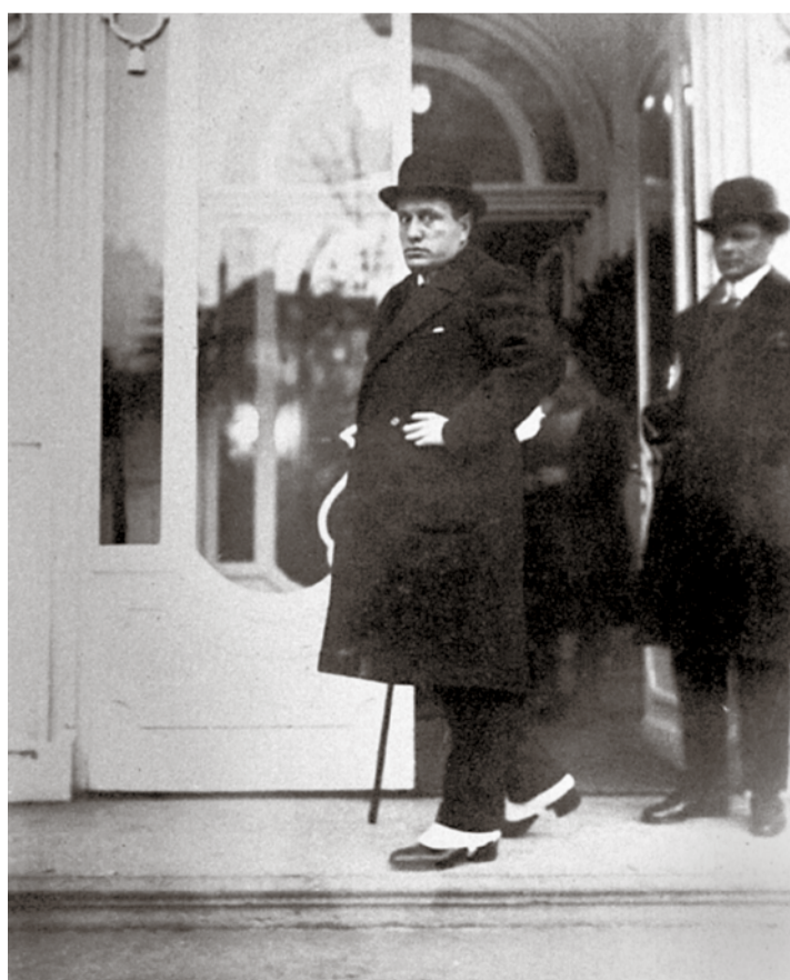
Mussolini à l'entrée du Beau-Rivage Palace à Lausanne.

| Reproduction 24h - livre du Beau-Rivage