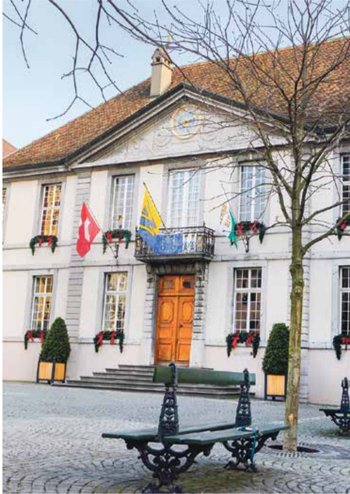
Malgré le déficit, pas de coupe drastique en vue.