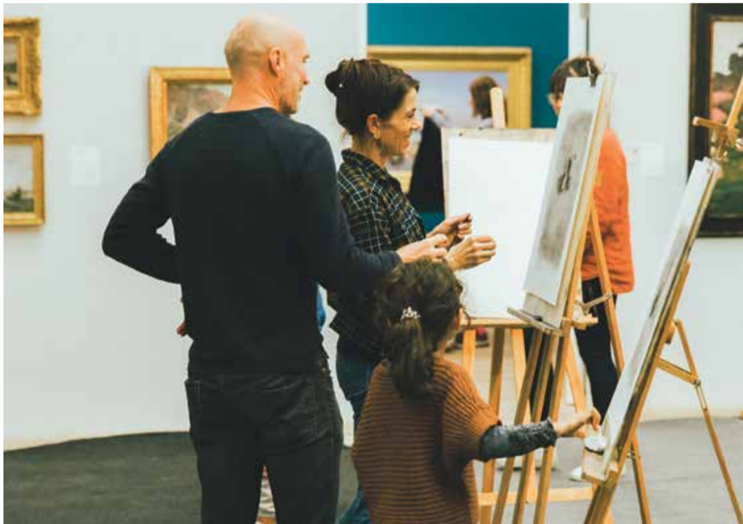
Le musée Jenisch proposait de s'essayer à la technique du fusain.