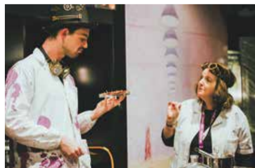
Des recettes pour chimistes pâtisseries.