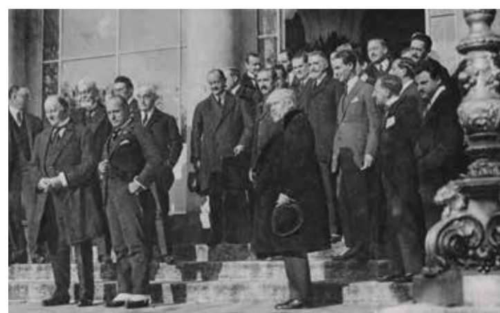
Le futur Duce à Lausanne, ici entre l'Anglais Curton et le Français Poincaré.

Accompagné par le comte Galeazzo Ciano, son gendre et bras-droit qu'il laissera condamner à mort et exécuter plus tard, Mussolini utilisera de nouveau et souvent la chambre 28 du Grand Hôtel, pour des rencontres secrètes. Notamment avec des émissaires du Reich, avant-guerre, parmi lesquels Joachim von Ribbentrop. Le ministre des Affaires étrangères d'Hitler sera reconnu coupable à Nuremberg