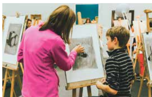
Le fusain permet de dessiner différemment.