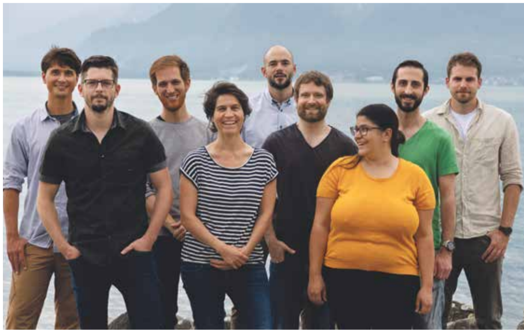
La petite équipe de Digital Kingdom est active depuis huit ans. C'est la deuxième année consécutive qu'ils sont nominés au Swiss game awards.

L'un des jeux en lice, «Lausanne 1830: histoires de registres», a été développé en collaboration avec l'EPFL. Le joueur s'y promène dans la capitale vaudoise au début du XIX e siècle, pour compléter le registre de la population. Une immersion dans l'histoire locale pensée pour les élèves du secondaire, et qui se base sur les vrais documents cadastraux numérisés