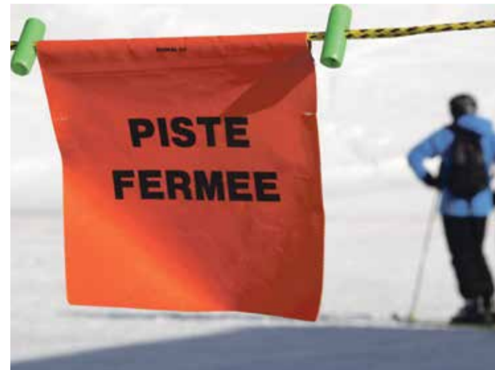
Le ski n'est pas la seule discipline à devoir faire son examen.

poser les bonnes questions avant de concocter leurs programmes de compétition ou de choisir des pays pour l'organisation de joutes mondiales. C'est la seule issue possible en ces temps de crise climatique majeure.