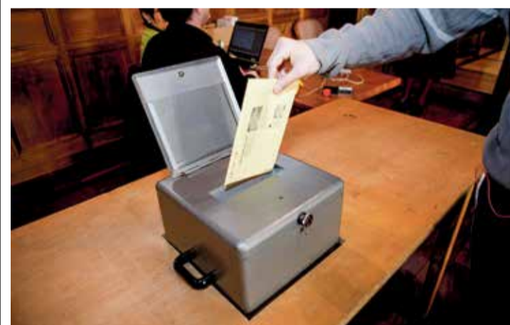
Les jeunes PLR en sont convaincus: dévoiler les coulisses des scrutins pourrait faire baisser l'abstentionnisme