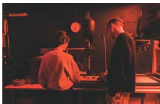
Atelier incrustation au Musée de l'appareil photo.