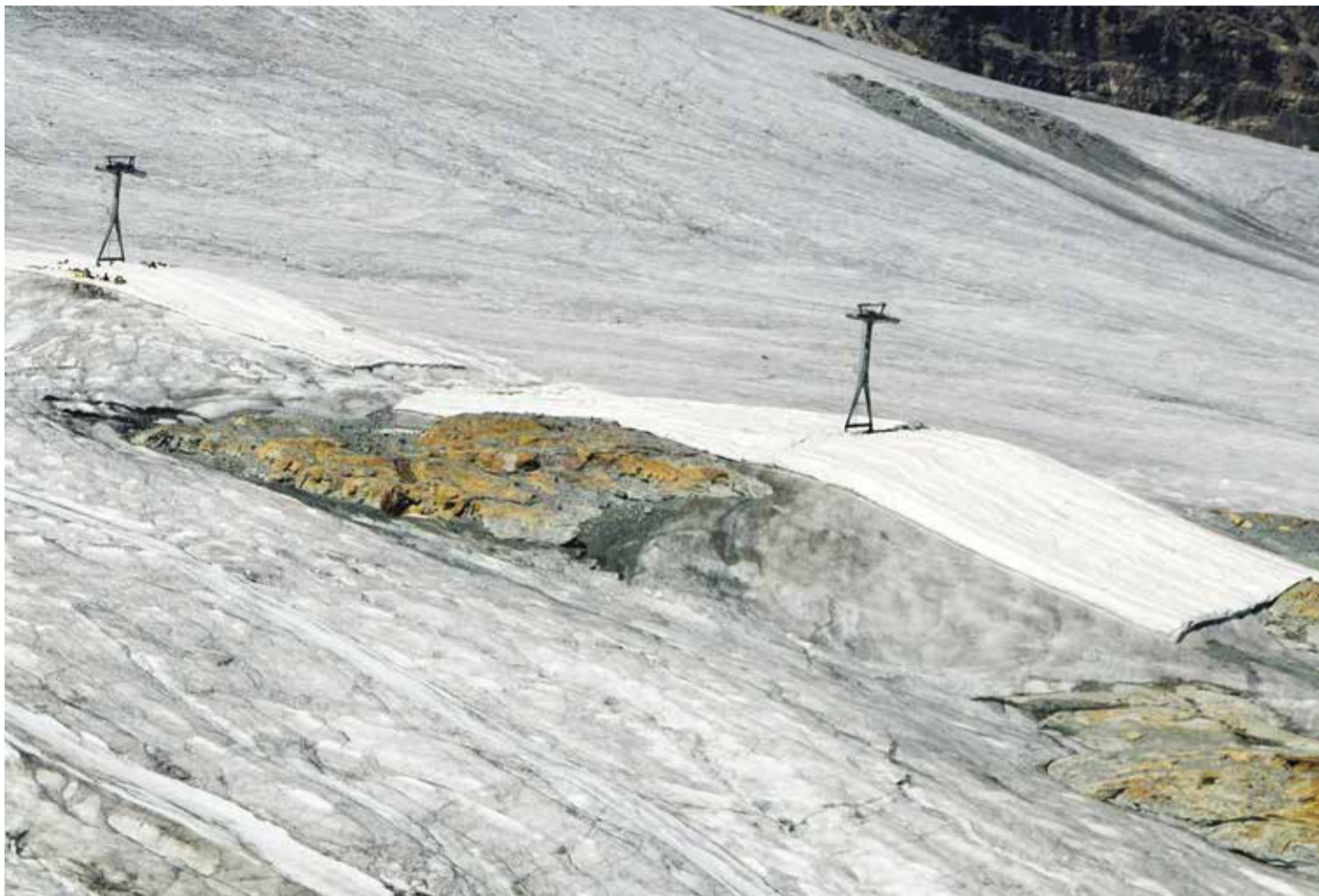
Les préparations d'été ont été perturbées pendant deux ans par la pandémie et désormais par le manque de neige.

Et que dire des deux plus grandes institutions internationales? Comment le CIO a-t-il eu l'idée d'organiser des JO d'hiver à Pékin