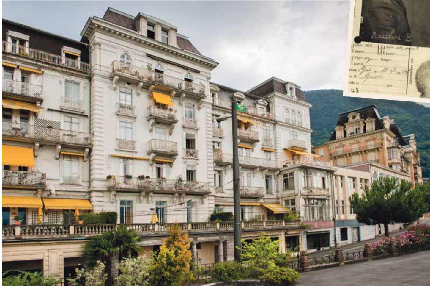
Le complexe Hôtel des Alpes-Grand Hôtel fut un des fleurons de l'hôtellerie de la Riviera. Des tsars, l'impératrice Sissi et Deep Purple y ont séjourné.

Nommé chef du gouvernement par le Roi d'Italie moins de trois semaines plus tôt, Benito Mussolini (1883 - 1945) effectue dès le 19 novembre 1922 son tout premier voyage politique. Et c'est sur Vaud. Chef des faisceaux, le futur Duce, participe à une grande conférence internationale qui débute le surlendemain à Lausanne. Elle a pour but de régler définitivement le conflit entre la Turquie et la Grèce, qui ont cessé le feu. Outre les belligérants, les autres principaux participants sont la France, représentée par son ancien président de la République Raymond Poincaré, et l'Angleterre, par Lord George Curzon.