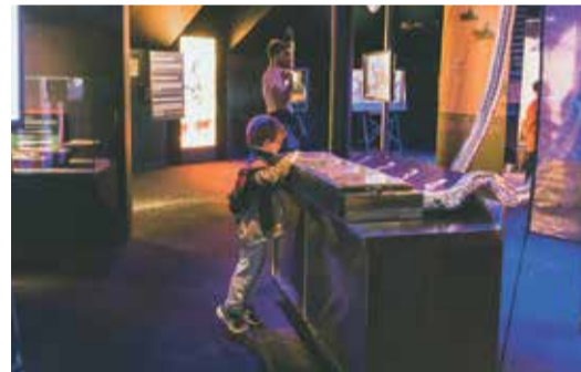
Les familles ont aussi visité les expositions.