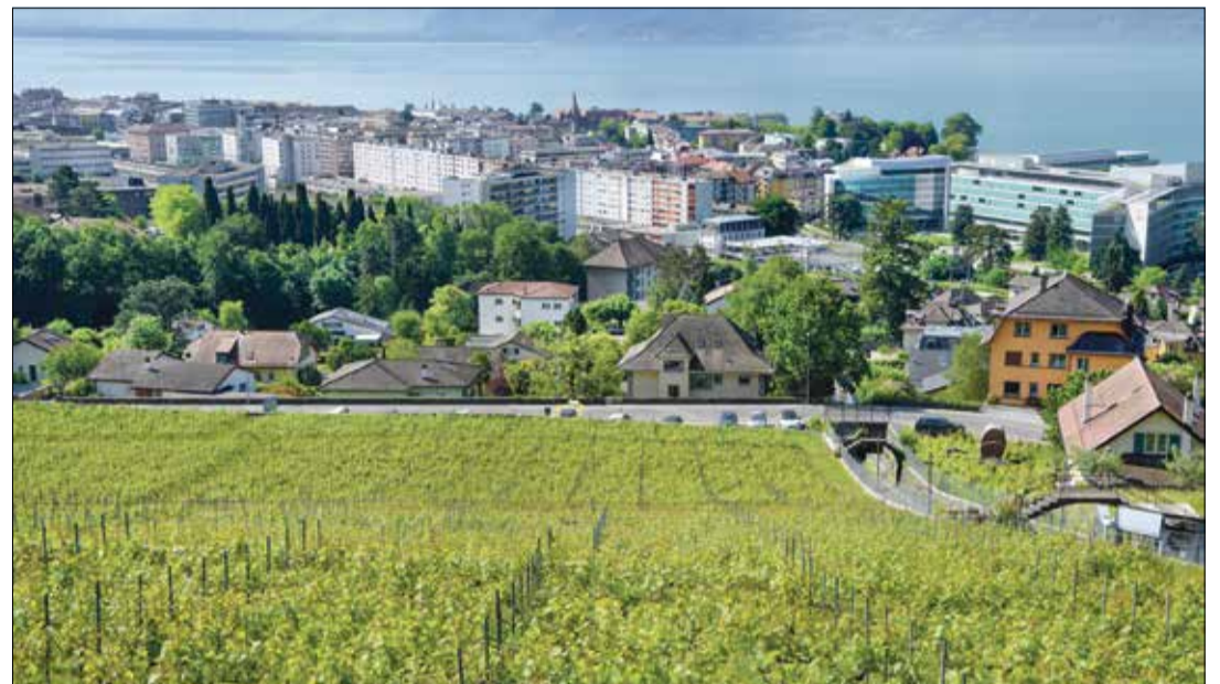
Au mois de juin dernier, les Corsalins ont voté en faveur du projet de crèche et d'EMS sur le domaine de Châtonneyre, un parchet de vignes classé en zone d'utilité publique.

posé la question. «On n'est pas dans un cas où des erreurs formelles ont été commises. Pour ce qui est de l'obsolescence du plan d'affectation communal, par