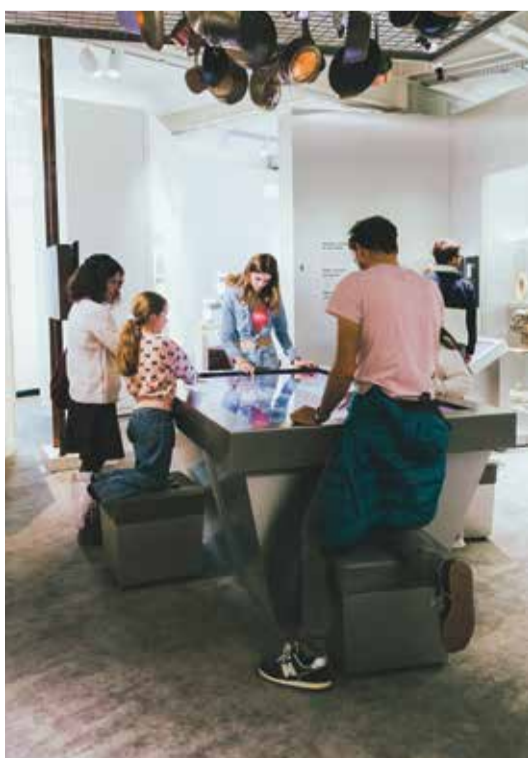
Découvrir ensemble, un des buts de cette journée.