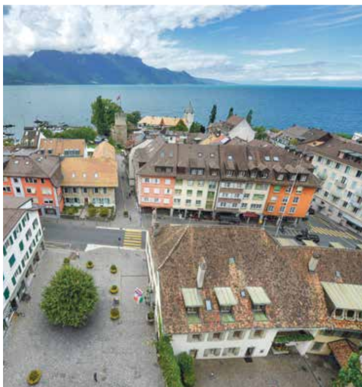
Seize immeubles locatifs appartiennent à la Commune. La Municipalité veut changer leur système de chauffage d'ici à deux ans.

«La Municipalité entend ainsi servir d'exemple et d'appui aux propriétaires pour réduire la consommation d'énergie sur le territoire boéland», déclare le Collège dans un communiqué. À l'heure actuelle, plus de 90% des