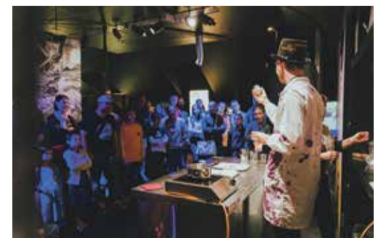
Des gourmands attentifs au travail des animateurs.