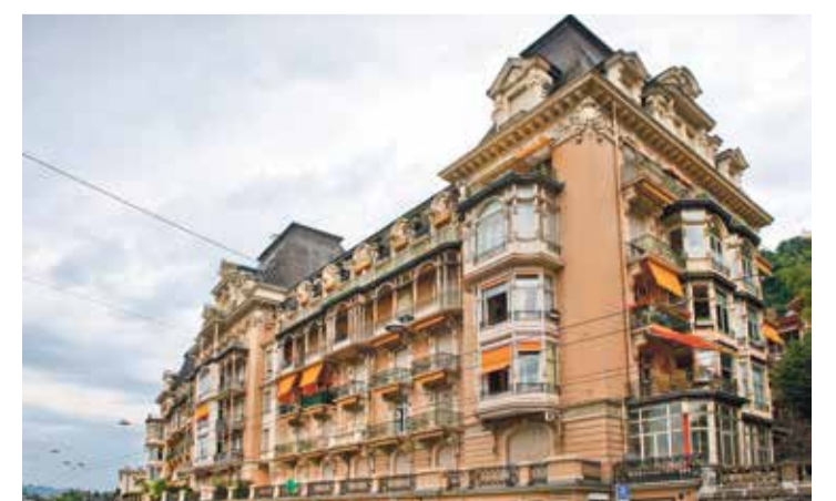
Le Grand-Hôtel a été transformé majoritairement en appartements.

| Reproduction 24h - livre du Beau-Rivage