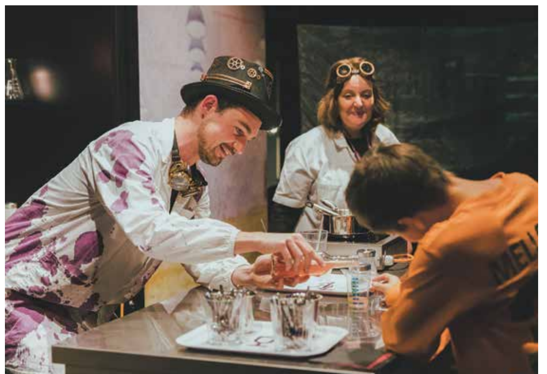
Des expériences? Non, de la cuisine! L'Alimentarium proposait un atelier recettes futuristes.