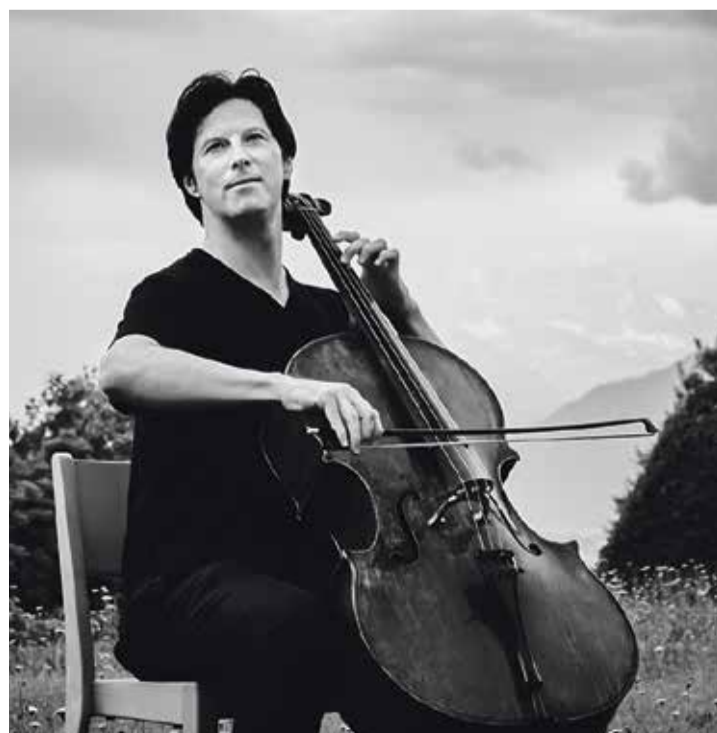
Daniel Müller-Schott coachera les jeunes violoncellistes.

puissance de la fiction, sa force de frappe et sa force dans l'espace public.» De ses études, il y a notamment la publication de son livre, «Vue sur la montagne». «Dans cette histoire, j'ai eu envie de proposer d'autres narrations, d'autres imaginaires. L'écriture me fait du bien, car j'ai l'impression de créer des histoires avec lesquelles je peux m'identifier. J'espère qu'elles participeront à l'émulation d'imaginaires alternatifs.»