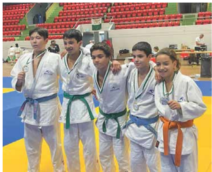
L'équipe gagnante du Mikami Judo Club de Lausanne.