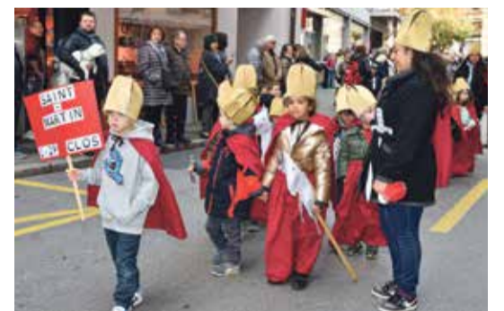
Des écoliers participaient également au cortège.