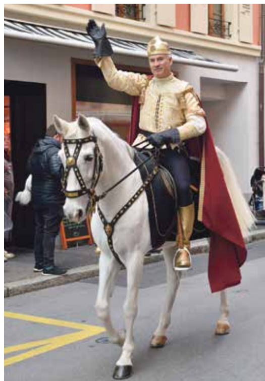
Saint-Martin à la parade.