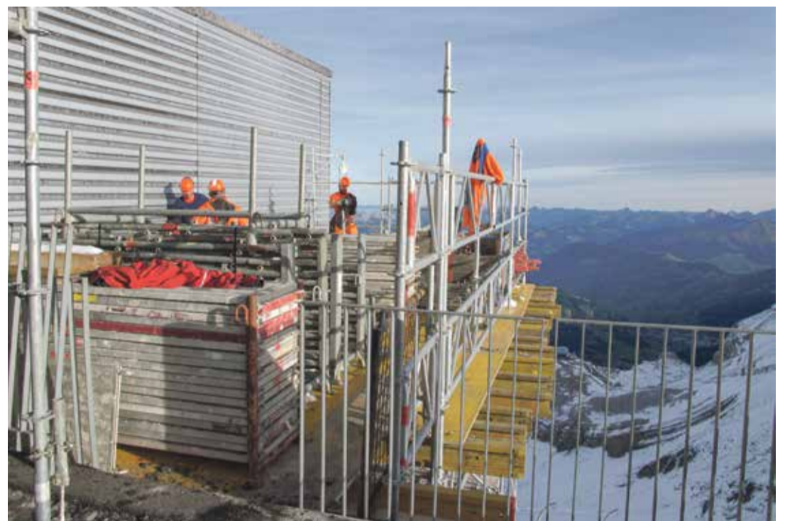
Aux abords du bâtiment sinistré, les travaux de déblaiement se poursuivaient samedi matin, à l'heure où les premiers skieurs débarquaient sur le domaine.