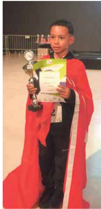
Le sacre en Autriche.

À 8 ans, le jeune danseur affiche déjà un grand professionnalisme. «Je prends le temps de rentrer dans la musique, j'analyse tout le temps pour ne pas partir faux. J'arrive bien à jouer avec la musicalité», explique-t-il. «Il entend