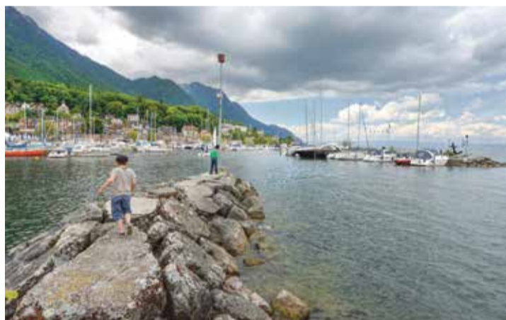
Dans le port du Bouveret, les autorités de Port-Valais incitent les plaisanciers à ne pas chauffer leurs bateaux cet hiver si ce n'est pour les mettre hors-gel.