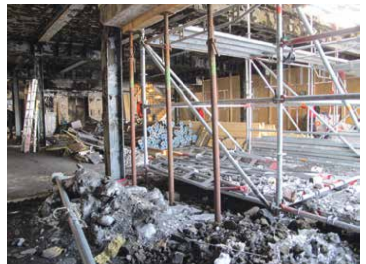
L'ancien self-service, au 3e étage est maculé de suie. Décombres et matériaux nécessaires à la stabilisation de la structure cohabitent.

En parallèle, le démantèlement et la sécurisation du bâti-