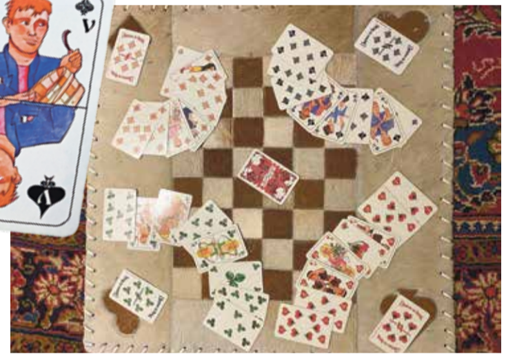
L'Homme de Brouc ou le brouc est un jeu de levées à 32 cartes. Deux équipes de deux s'affrontent.