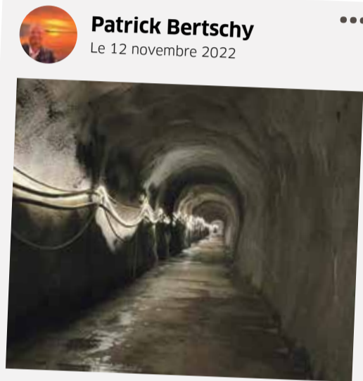
Visite très intéressante et enrichissante de l'aménagement hydroélectrique sur la Veveyse à Gilamont organisée par les Forces Motrices de la Veveyse SA et la Ville de Vevey. Environ 700 mètres de tunnel.

Suivez-nous sur notre page Facebook: Riviera-Chablais