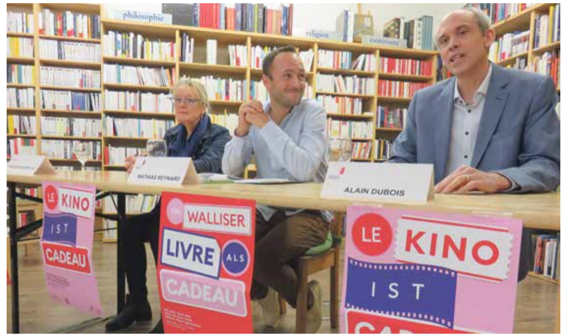
L'opération de soutien a été annoncée officiellement ce lundi à Sion par les responsables cantonaux.

Projections et livres gratuits Depuis hier, les séances sont offertes les mardis, mercredis et