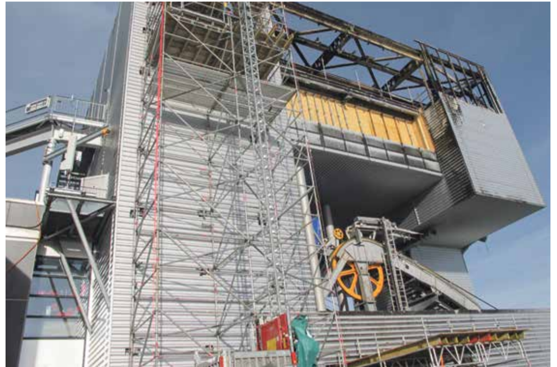
Les restes du 5e étage ont été démantelés. Seule la structure porteuse subsiste du 4e, où le feu s'est déclaré. Des palissades ont été construites au 3e étage pour le protéger de la neige.

Totalement démonté ces dernières semaines, le 5 e étage a disparu. Du 4 e , il ne reste bientôt plus que des poutrelles d'acier noircies. Plus bas, les tôles qui habillent l'emblématique édifice sont encore maculées de suie. «Ça fait drôle... C'est un symbole. On a presque de la peine à croire que ça tient encore debout quand on voit l'ampleur des dégâts», com-