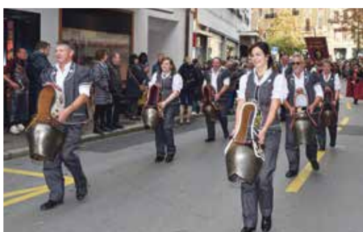
Les sonneurs de cloche emmènent le cortège.