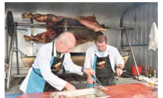
Le bœuf a cuit très longtemps, honoré d'une veillée.