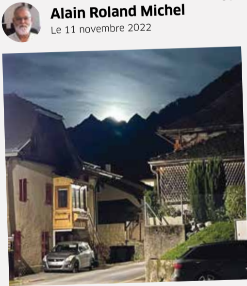
Lever de lune sur les Diablerets, aux confins de la commune de Bex.