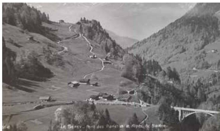
Les travaux ont débuté en août 1919 et ont duré deux ans.