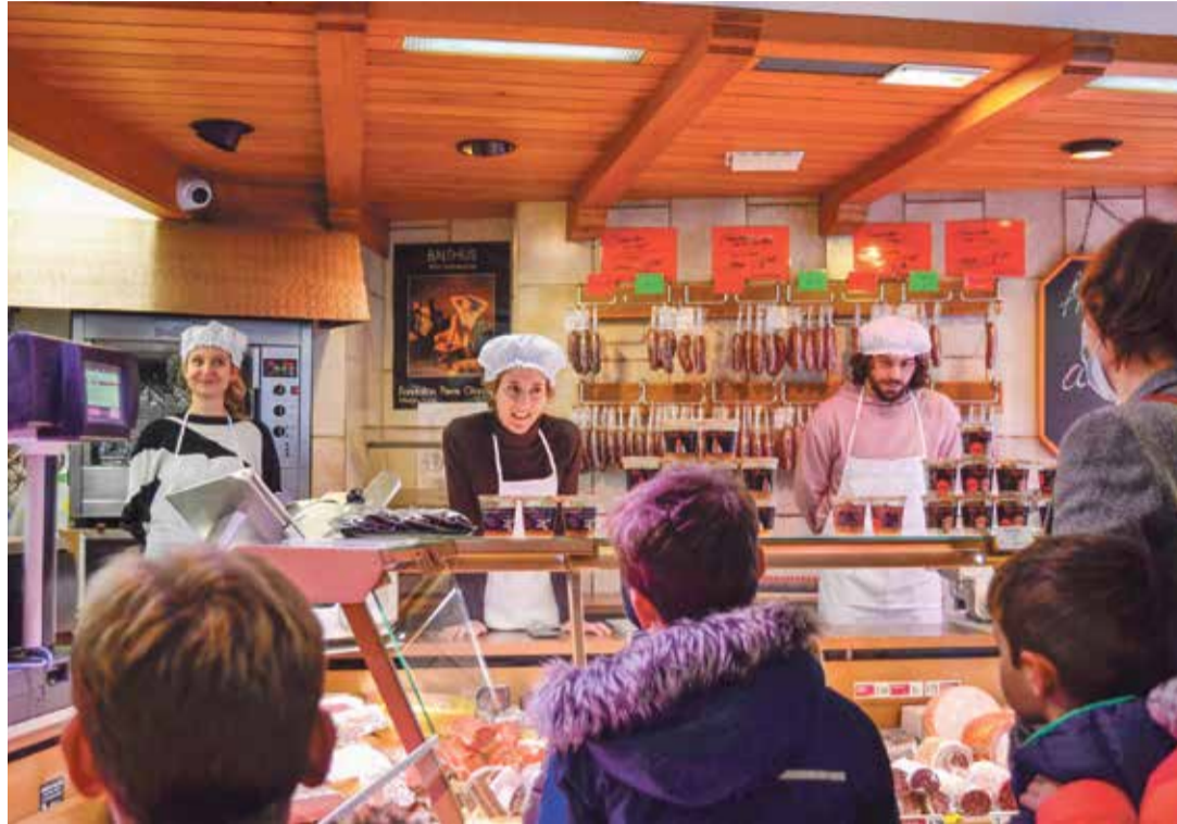
De l'art et du cochon, la compagnie Jusqu'à m'y fondre a créé un spectacle pour les boucheries. | La Bavette

À cela s'ajoutent une déambulation sonore pour la fête des écoles basée sur des interviews de jeunes, une excursion dans un festival avec des spectateurs de la Bavette et des œuvres interactives. «Il s'agissait de lectures à partager. Nous proposons trois textes à des familles, nous travaillons tous ensemble la pièce de leur choix pour qu'ensuite ils la présentent à leurs invités, dans leur salon ou dans leur jardin.»