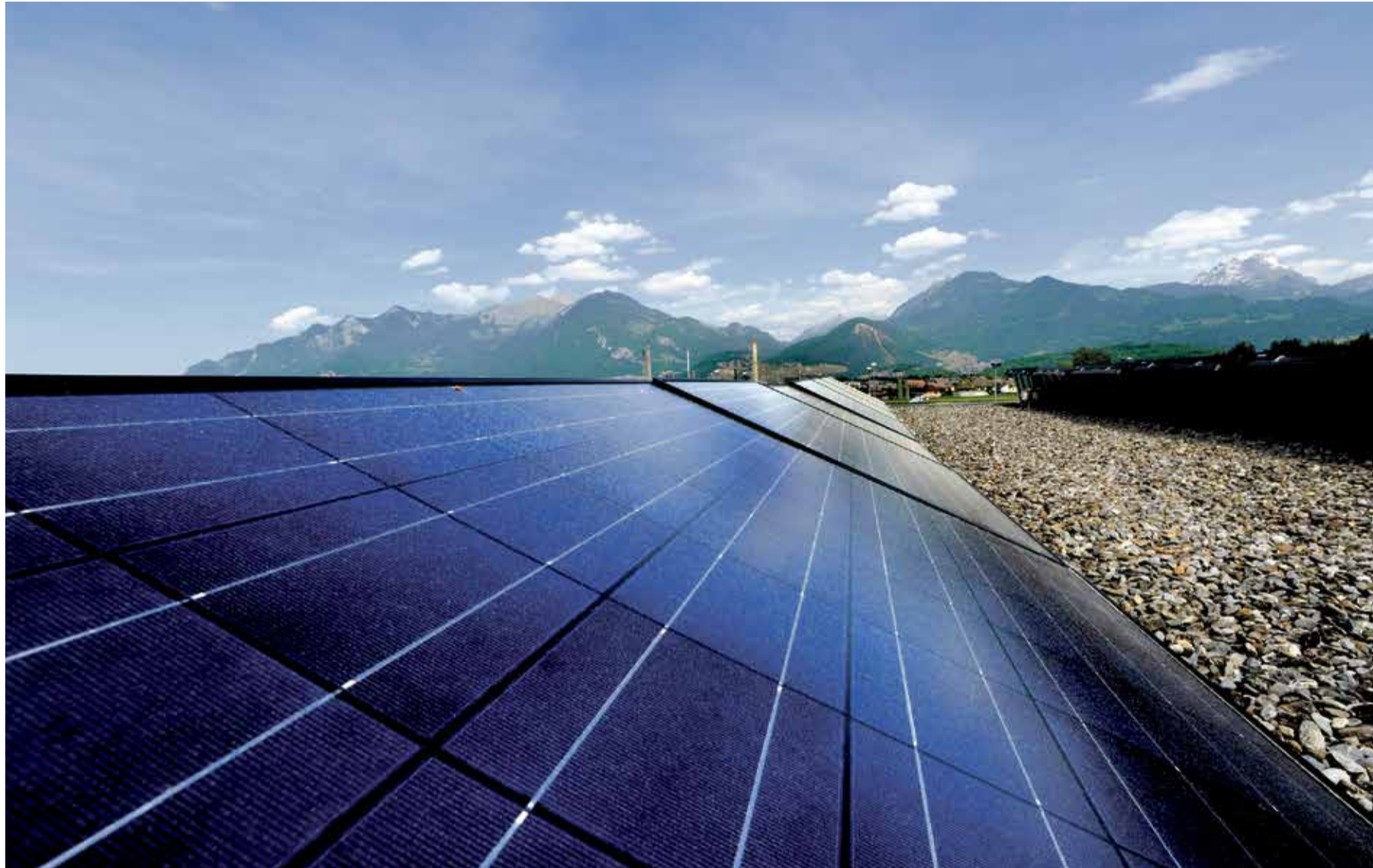
Les panneaux solaires se sont multipliés ces dernières années sur les bâtiments publics, comme ici au collège des Perraires sur la commune de Collombey-Muraz. Mais chez les privés, le potentiel inexploité reste très important, ce qui engendre des espoirs chez les propriétaires et du côté des autorités. | C. Dervy - 24 heures