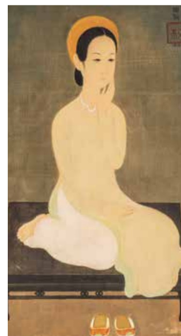
MAI TRUNG THU - Adjudé 160 000 €