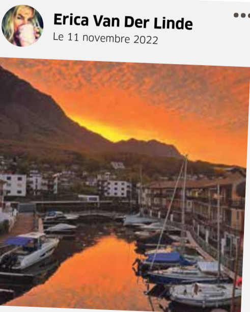
Magnifique coucher de soleil ce soir sur la Marina du Bouveret.