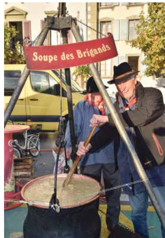
Les Brigands du Jorat brassent la soupe aux pois.