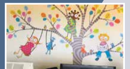
Le club a contribué à la décoration du service de pédiatrie de l'Hôpital Riviera-Chablais.

Le Lions Club Riviera Chablais n'a pas défini de critères d'attribution précis. «Une fois cela peut être un don à une sportive, une autre fois à une association. Parfois nous accompagnons des personnes au théâtre. Nous voulons être présentes. Ce serait trop facile d'allouer de l'argent et basta.»