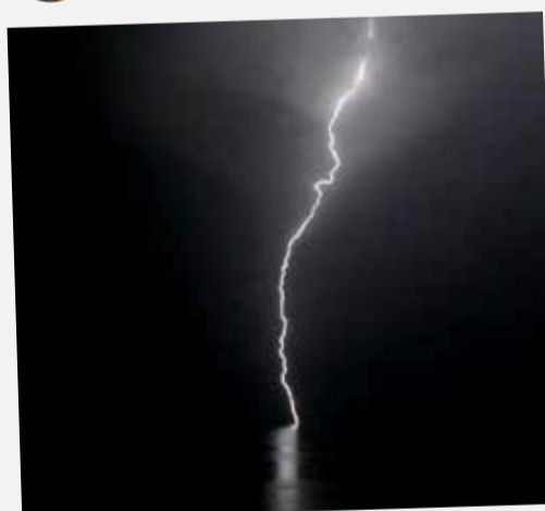
Je pense que vous avez tous vu cet orage ce soir. L'image blanche est la pleine puissance de l'éclair ⚡