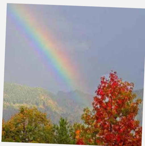
Quand un arc-en-ciel touche un arbre... Un renard en passant 🦊

Bernard Hangartner Le 24 octobre 2022 dans la page « La Boëlée »