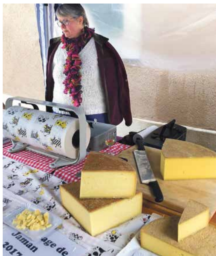
Des produits locaux seront à l'honneur, ici les fromages de Jaman.

naient également pour y acheter de nouveaux outils à la fin de la saison des récoltes. Les marchands ambulants et les colporteurs qui voulaient écouler leurs propres marchandises étaient eux interdits d'entrée.»