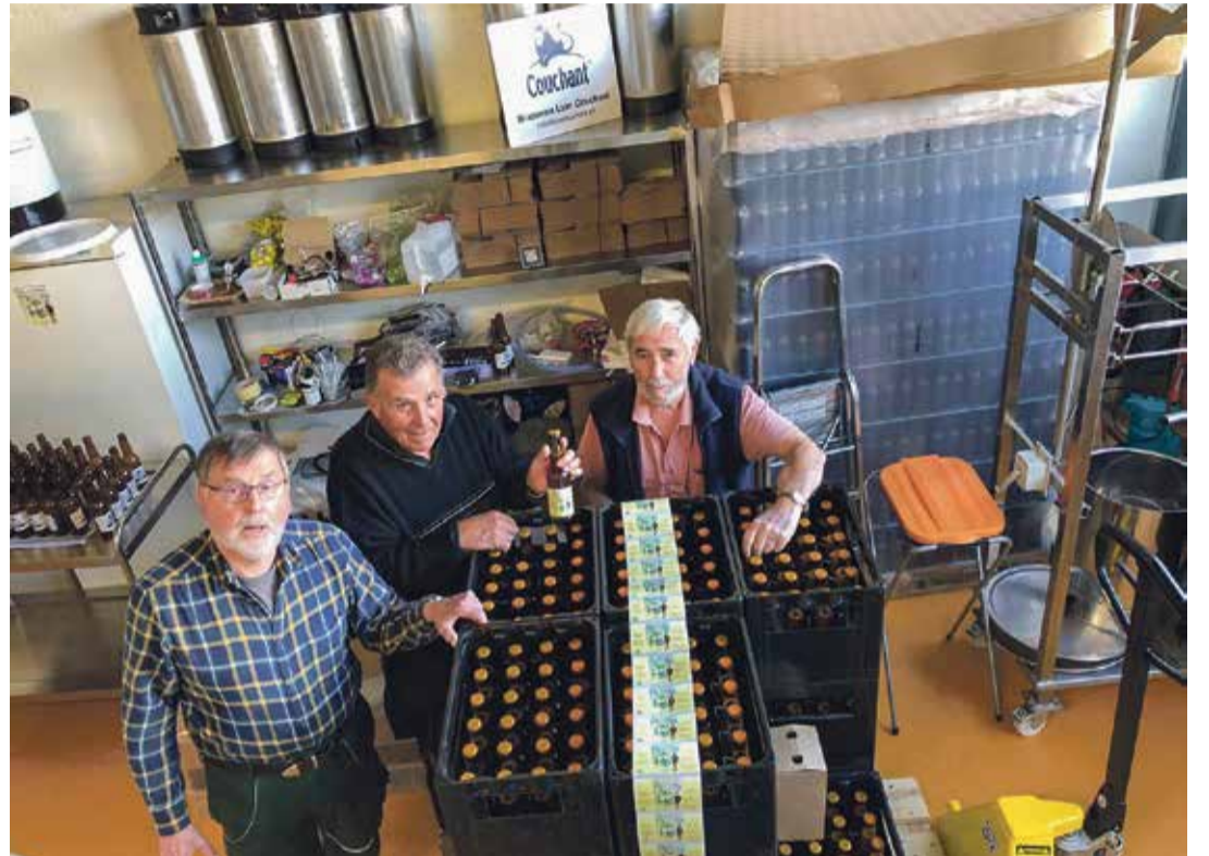
La bière du Maralley est brassée depuis 4 ans spécialement pour la Foire des Planches.