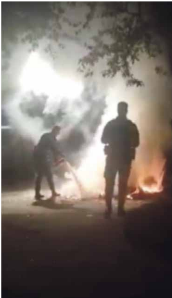
Dans la soirée du 17 octobre, un nouveau feu de poubelle a eu lieu dans la cour du Collège Vinet.

Mais revenons à ce brûlant mois d'octobre. Qu'ils soient à l'origine ou non de ces feux de poubelles, sans gravité selon les pompiers, certains jeunes présentent des comportements problématiques. Les autorités le confirment. «Il s'agit d'un groupe nébuleux, dont les membres sont âgés de 13 à