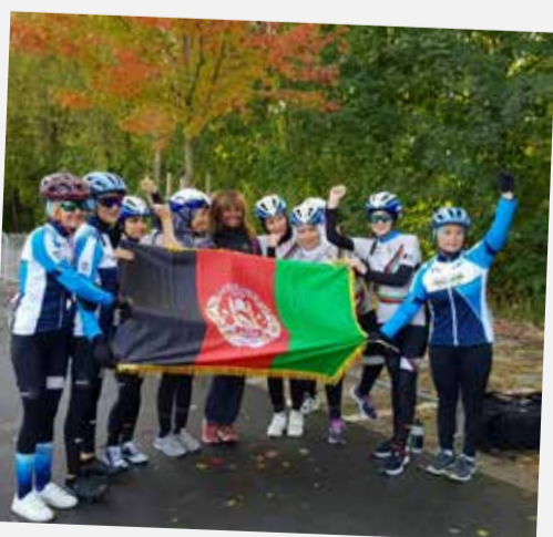
Championnat national d'Afghanistan de cyclisme féminin...quand tu vis un moment gravé dans l'histoire, émouvant.