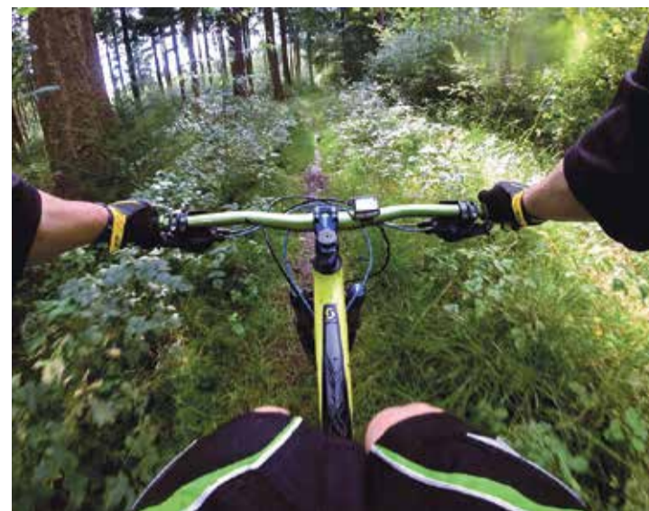
En augmentation ces dernières années, les vététistes ne sont pas toujours les bienvenus dans les forêts de la région.

Selon l'un de ses initiateurs, l'objectif de la démarche est de documenter et de «montrer au grand jour» les déprédations commises à Clarens, grâce à des caméras et des micros. «On nous a signalé neuf endroits problématiques, dont le cimetière.» En revanche, pas question pour eux d'intervenir. «Ce n'est pas notre travail. En cas de besoin, nous appellerons les secours.»