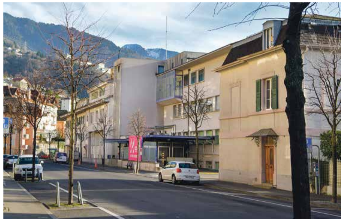
L'hôpital de Montreux a été évoqué comme lieu d'accueil potentiel, mais la présence d'amiante rend tout aménagement difficile et la Commune a d'autres projets pour ce site.

Jacqueline Pellet. Dans les étages, il reste encore des supports de machines ou des robinets qu'il faudrait enlever pour les rendre utilisables.» Une tâche que la présence d'amiante dans la structure vient complexifier.