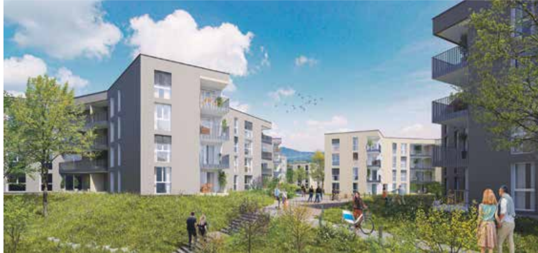
Le projet de 11 immeubles prévoit plus de 200 appartements, dont plus de 50% à loyers abordables ou modérés, pour 500 habitants.

«Cette récolte n'aurait pas dû être accordée par la Municipalité. D'après notre avocat, cette initiative n'est pas légale. Elle aurait été recevable si le plan d'affectation avait été accordé il y a plus