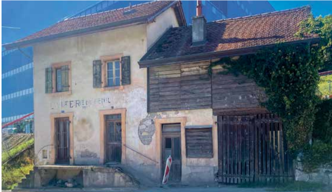
La laiterie de Fenil est jugée inadaptée par l'entreprise Merck, qui en est propriétaire.