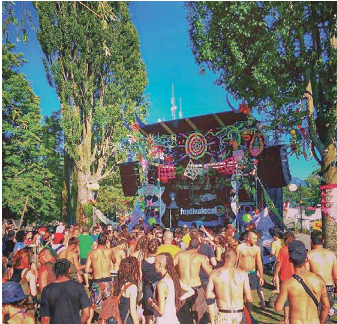
Le Festivalocal a fait ses débuts au jardin Doret. Très prisé des amateurs et amatrices de musiques électroniques, il a toujours misé sur la gratuité pour accueillir un public varié.

Le problème, c'est que ces écarts ont écorné une image déjà fragilisée par différentes polémiques héritées des éditions passées. Au point que même à gauche, des élus d'ordinaire prompts à défendre ce qu'une partie de la droite qualifie de «festival de dro-