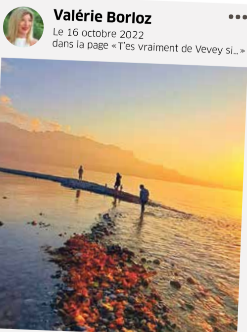
Le 16 octobre 2022 dans la page «T'es vraiment de Vevey si...»