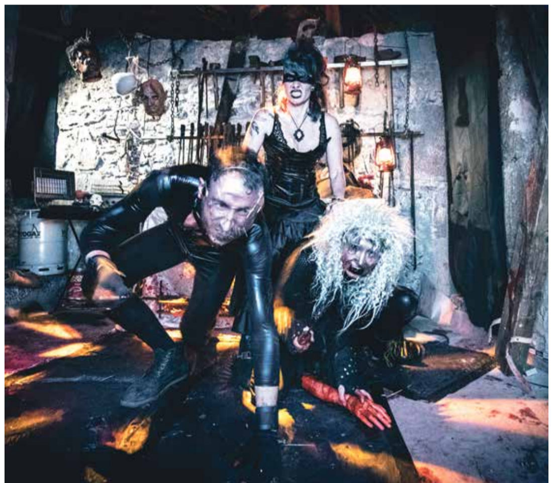
Les créatures sont de retour pour deux week-ends d'angoisse.