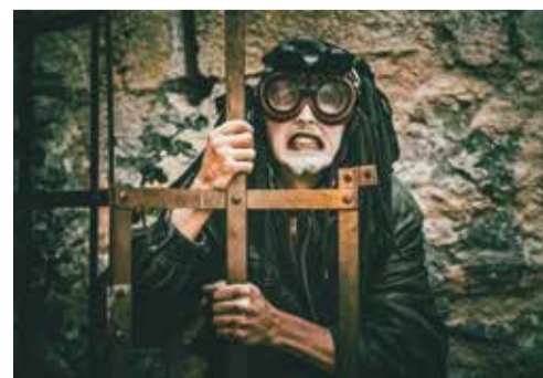
Des animations d'Halloween variées sont prévues un peu partout dans la région.

«C'est carrément pour les plus petits enfants que notre manifestation est dédiée.