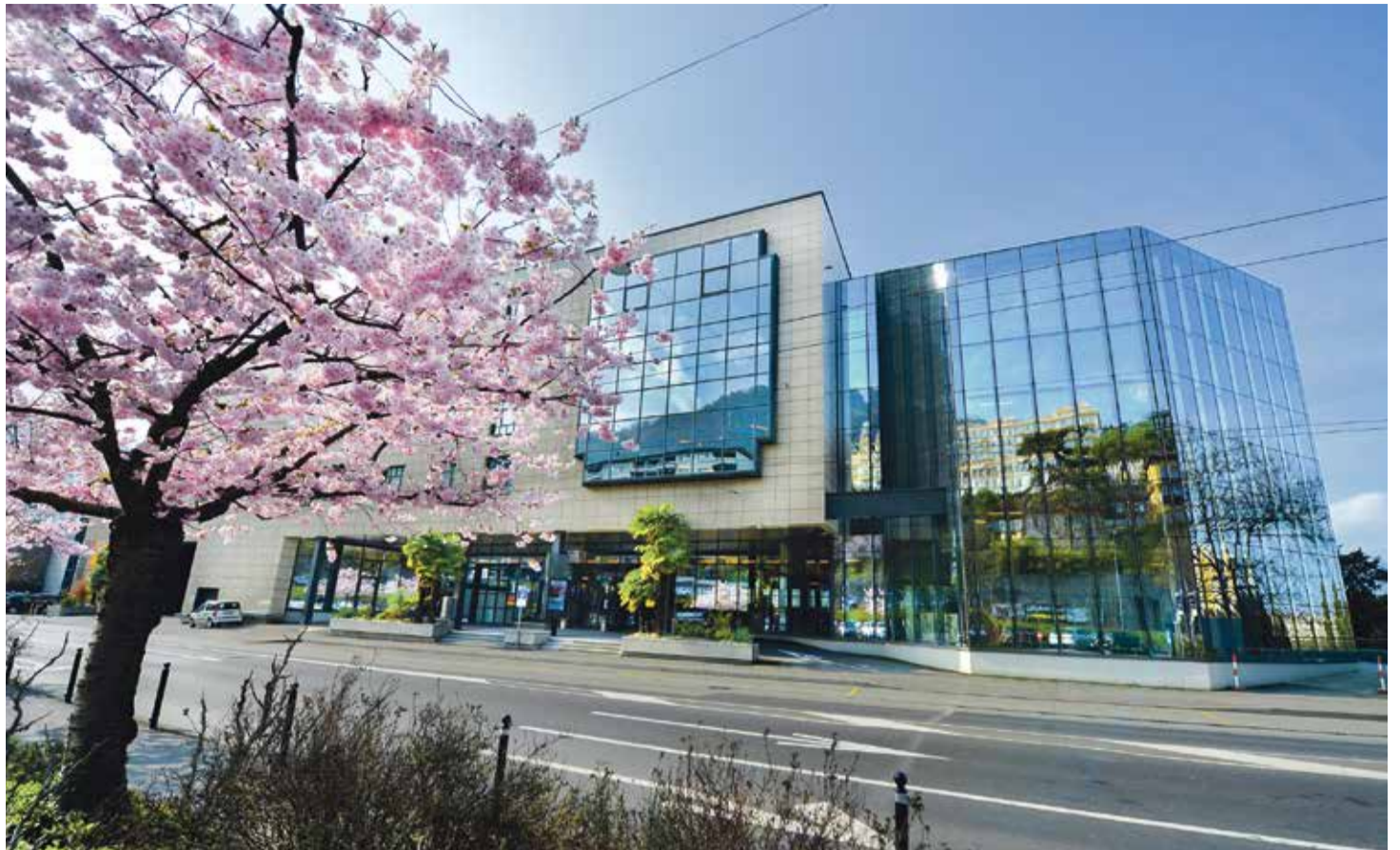
Les travaux doivent commencer l'an prochain. Ils sont estimés à 78 millions, dont 21 à la charge de la Commune.