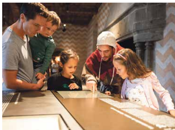
Aventures et découvertes attendent le public, comme ici au Château de Chillon. | S. Vez