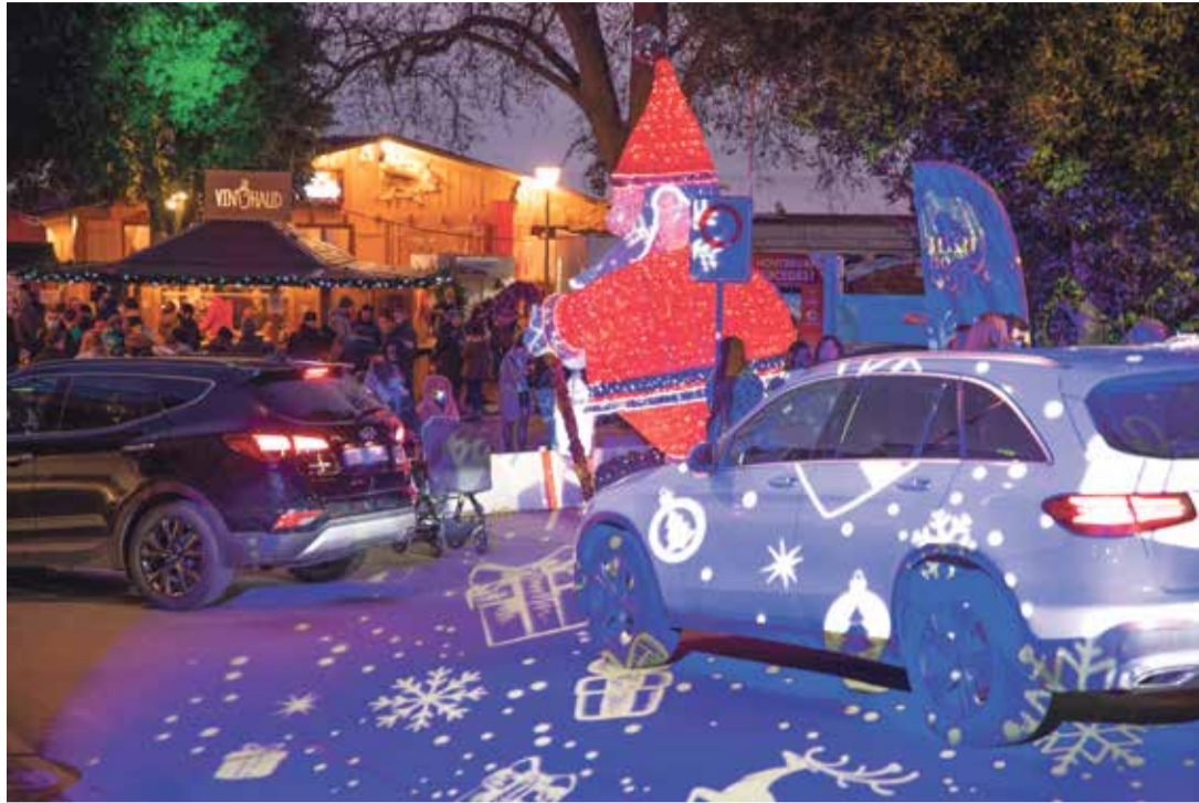
Lors du dernier Marché de Noël, les grands axes étaient par moment complètement congestionnés.