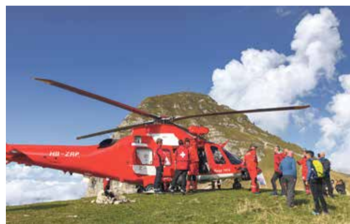
Les participants ont pu découvrir l'hélicoptère de recherche de la Rega, un AgustaWestland Da Vinci (AW109SP).

Renaud Guillermet Pilote de la sécurité civile française