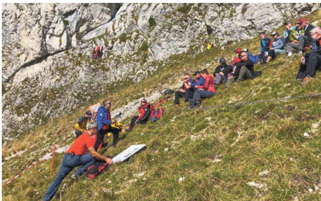
Les spéléologues ont donné un atelier au pied de la face sud de la Dent de Jaman.