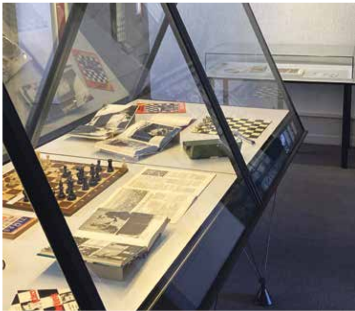
Le «match du siècle» en objets et images. | Musée suisse du jeu