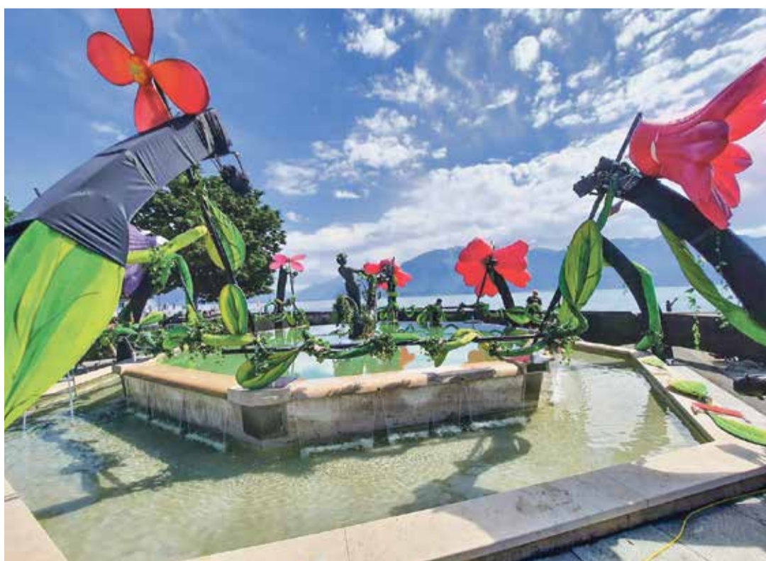
Désormais installé au jardin du Rivage, le rendez-vous s'approprie les lieux notamment par le biais de ses décors hauts en couleur.

À voir si le soutien financier octroyé par la Commune sera renouvelé pour 2023. Les discussions s'annoncent serrées au moment d'examiner cette ligne budgétaire pourtant minime, puisqu'elle s'élève à 5'000 francs par an. Verdict en décembre.