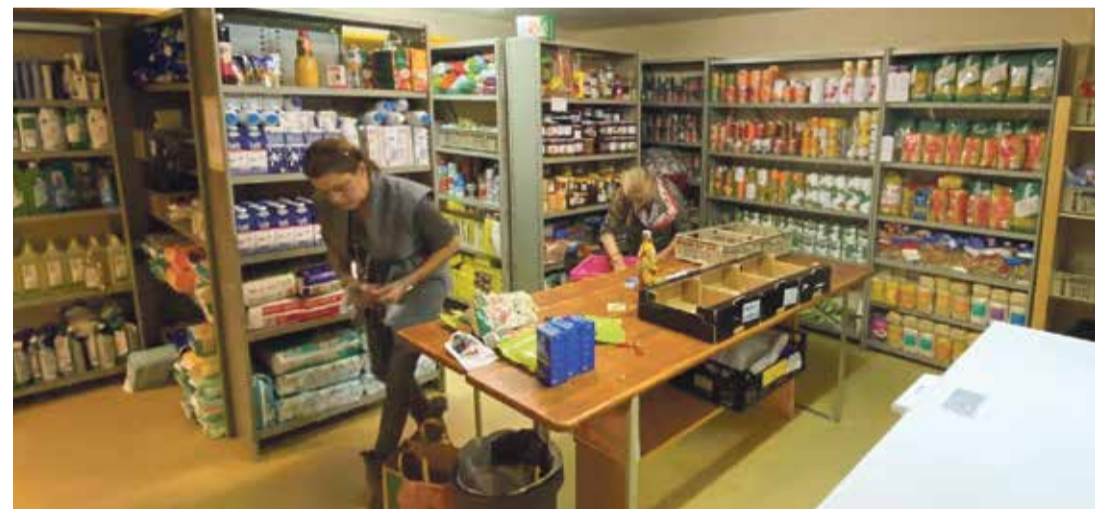
Chaque année, l'association fournit 40 tonnes d'aliments et de produits du quotidien. La distribution se fait désormais depuis son local au sous-sol du Collège Rambert à Clarens.

Mais pour cette spécialiste en communication, la rencontre la plus marquante sera celle de ces êtres qui vivent seuls. Et qui n'arrivent pas à joindre les deux bouts.