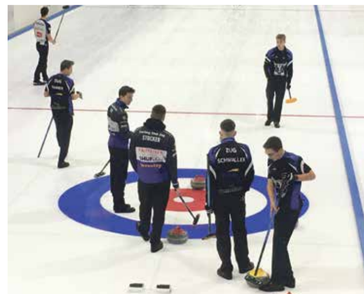
15 équipes ont participé à la compétition de Champéry.