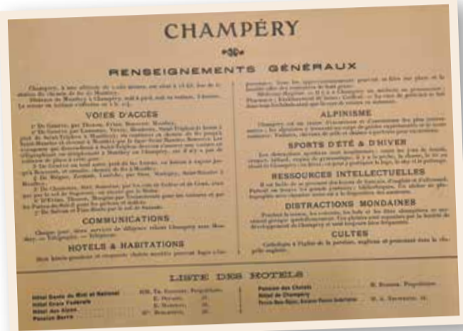
Annonce parue dans l'Album-panorama Suisse, vol. 2, N° 10, 1903. | Musée suisse de l'appareil photographique, Vevey, n° inv. 142688.

En 1903, l'éditeur neuchâtelois Alfred Spuhler publie le dixième numéro du second volume de son Album-panorama Suisse consacré à la région allant de Saint-Maurice à Champéry. Celles et ceux qui choisissent Champéry comme lieu de vacances peuvent compter sur huit hôtels et une cinquantaine de chalets en location, un transfert en diligence depuis Monthey deux fois par jour, un médecin à disposition en permanence dans la localité, des distractions mondaines «presque quotidiennement» pendant la saison, des cours de français, d'allemand et d'anglais, un atelier de photographie avec chambre noire, une cure de raisins en automne, sans oublier la possibilité de pratiquer de nombreux sports comme le tennis, le croquet, le billard, le tir, le patinage ou encore le «sky». Mais «Champéry est [surtout] un centre d'excursions et d'ascensions des plus intéressantes; les alpinistes y trouvent un corps de guides expérimentés et de toute confiance», ainsi que des «voitures, chevaux de selle et chaises à porteurs». Ainsi Le Confédéré, La Contrée et la Gazette du Valais du 3 juin 1903 relatent la première ascension de l'année depuis Champéry, le lundi 25 mai, à la «haute cime de la Dent-du-Midi». William