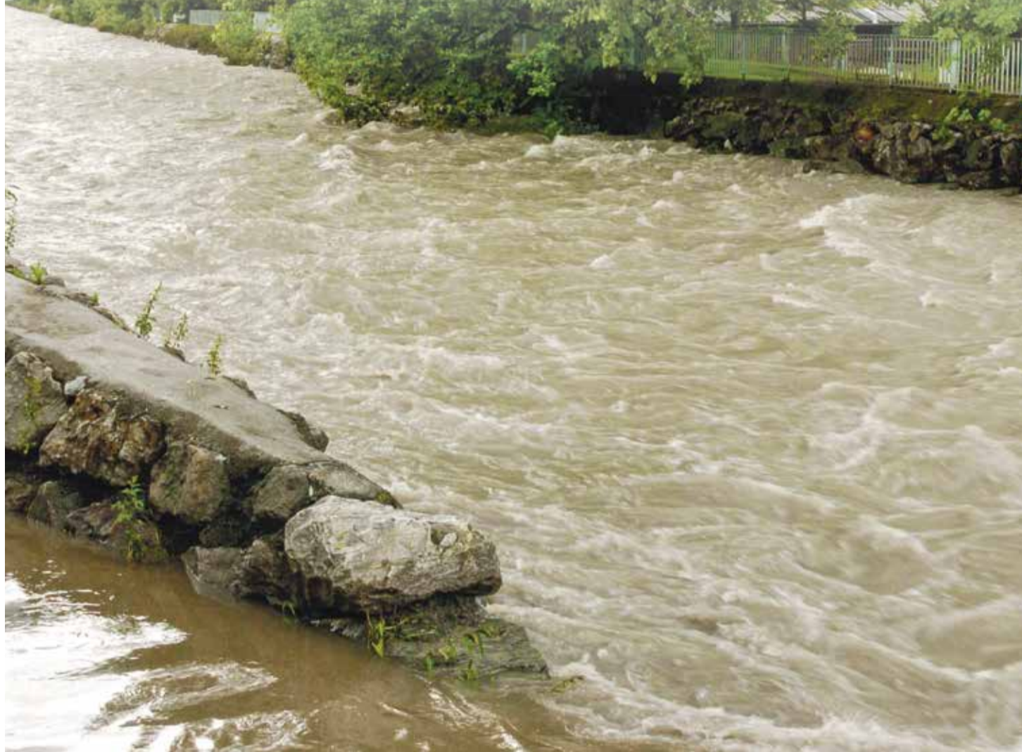
Le niveau de la Vièze a souvent causé des inquiétudes aux riverains, comme ici en juillet 2007.