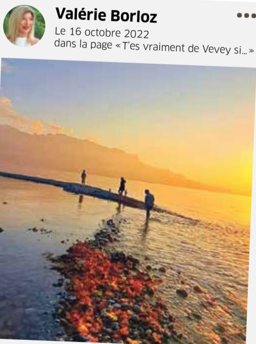
Le 16 octobre 2022 dans la page «T'es vraiment de Vevey si...»