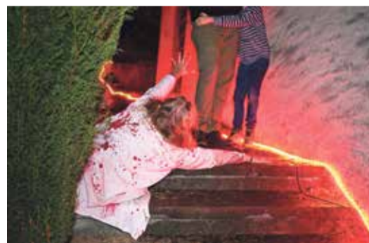
Attention aux zombies!