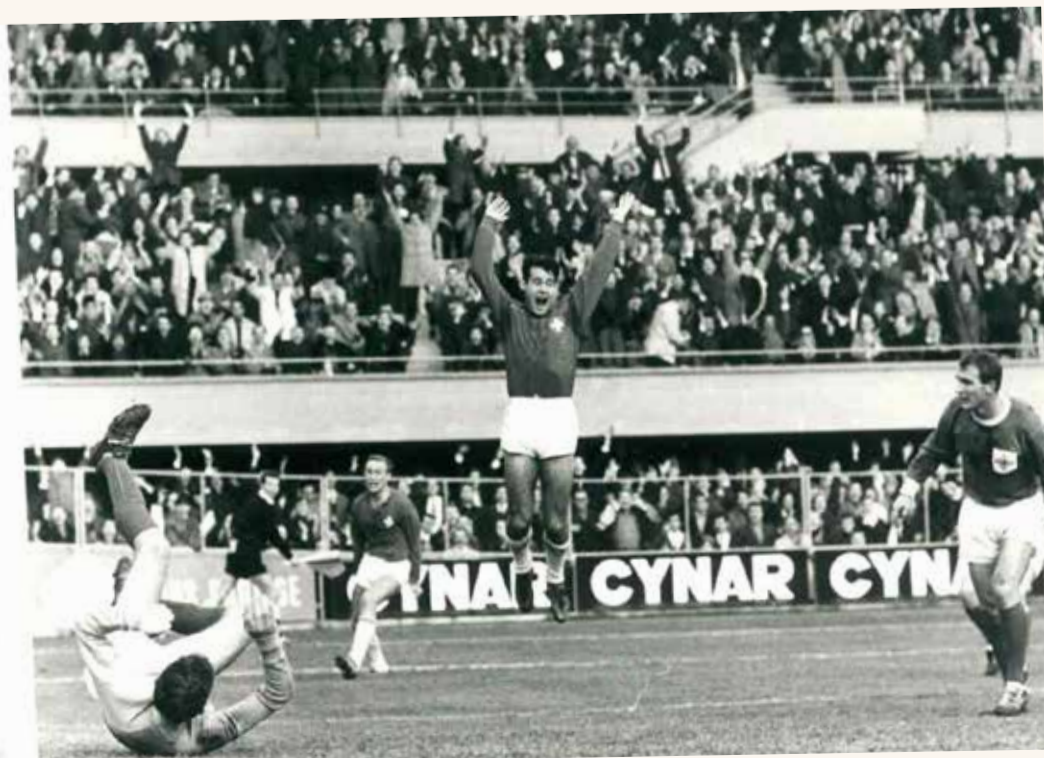
Première cape et premier but face à l'Irlande du Nord de l'immortel George Best.

Lors de la Coupe du monde 1966, le jeune Collombeyroud marque le seul but de l'équipe de Suisse en trois matches. C'était face à l'Espagne à Sheffield.