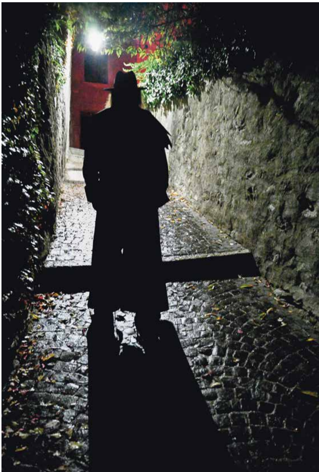
On fait de drôles de rencontres dans le couloir de la mort qui tue.