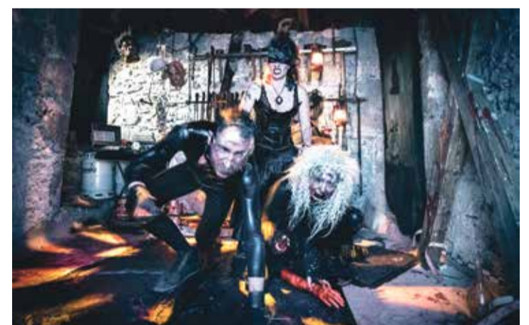
Les créatures sont de retour pour deux week-ends d'angoisse.

Patrie romande de Carnaval, Monthey ne sera pas en reste les 28 et 29 octobre. Avec «Bouh», le château et ses abords, aussi la ville inquiétante la nuit à la lumière des lanternes, met sur pied un programme horripilant.