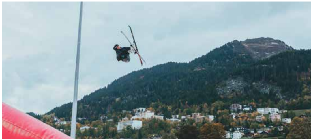
Le Big Air permet de s'entraîner en atterrissant en douceur sur un coussin d'air géant.

olympique de slopestyle et médaillée de bronze en Big Air aux derniers JO de Pékin, est ravie elle aussi. «C'est trop beau, c'est génial, cela permet de prendre ses repères pour la saison. Et en plus, on atterrit sans se faire mal comme dans une piscine.»