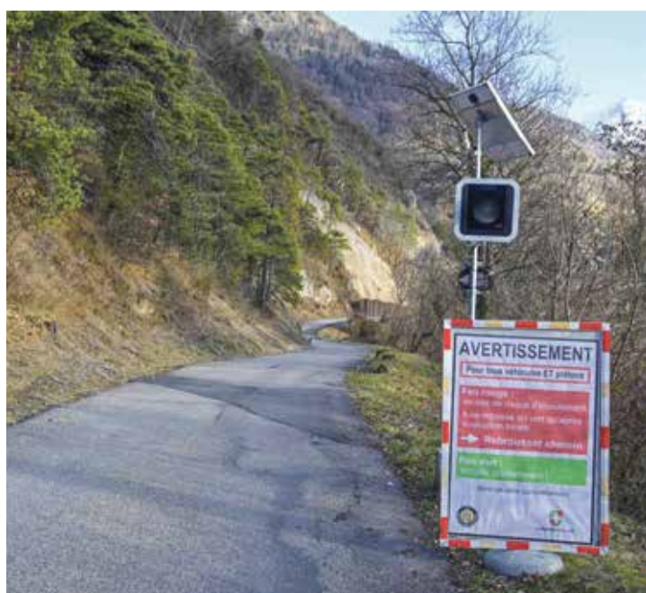
Désormais sous surveillance, la route de Verschiez a été victime à deux reprises des caprices de la météo en 2021.

En pleine élaboration du budget 2023, l'édile annonce: «Nous avons dû réaliser des économies dans de très nombreux domaines, mais nous ne toucherons pas aux montants dévolus à la surveillance des dangers naturels, ni à ceux qui doivent servir à la sécurisation de nos cours d'eau.»