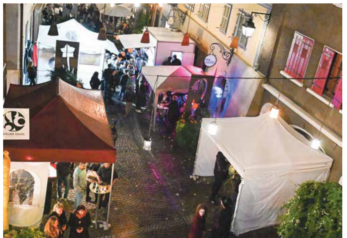
Ambiance monstres et citrouilles dans la rue du Bourg monthesienne vendredi soir.