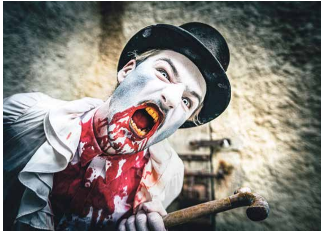
L'an passé, Castellum Tenebris avait déjà semé l'effroi au Château d'Aigle.

Ce scénario catastrophe est le point de départ de «Bastion 2222». Ce spectacle d'épouvante en lien avec la période d'Halloween sera présenté les week-ends des 28-29 octobre et 4-5 novembre