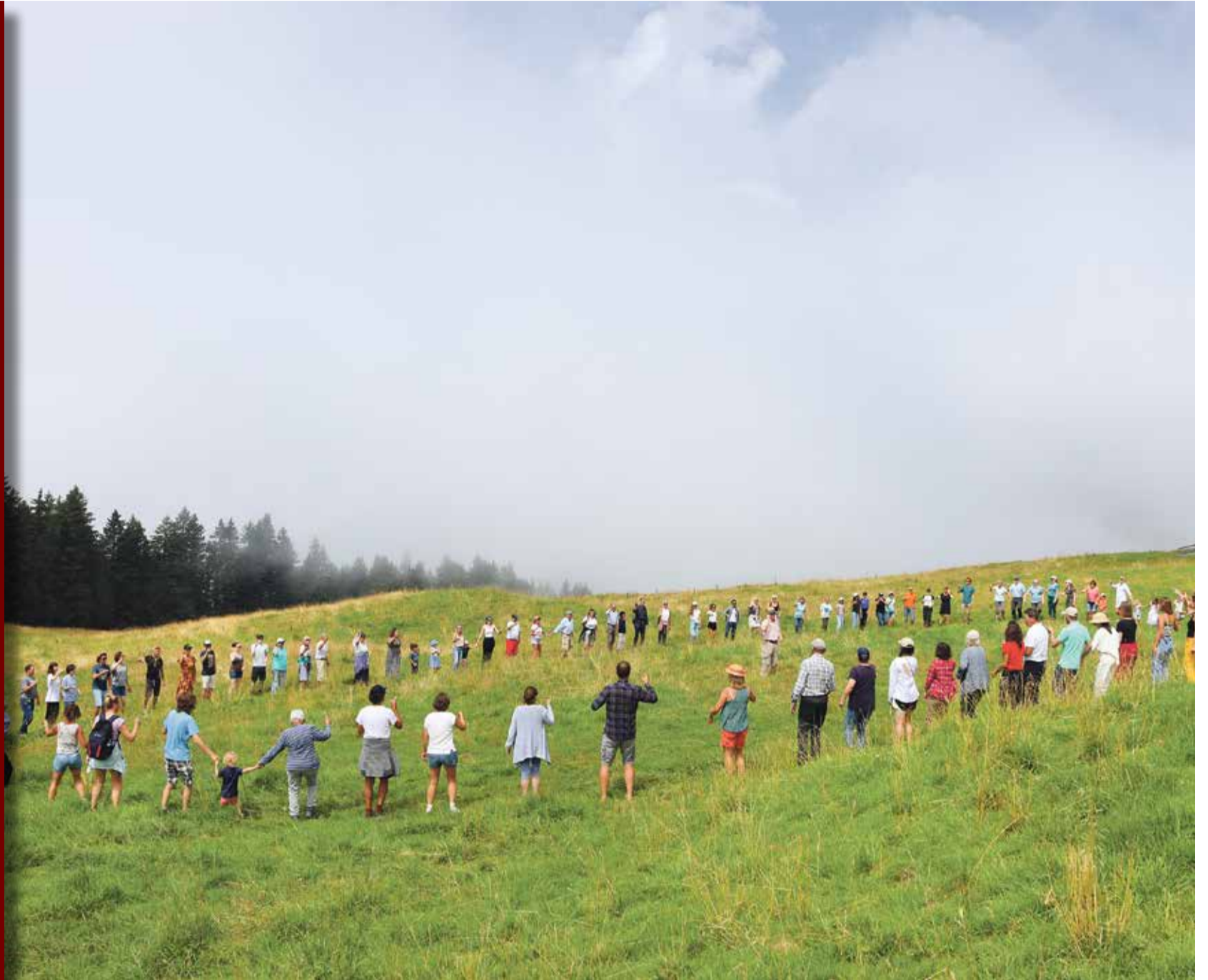
I Jeunesse de Gryon