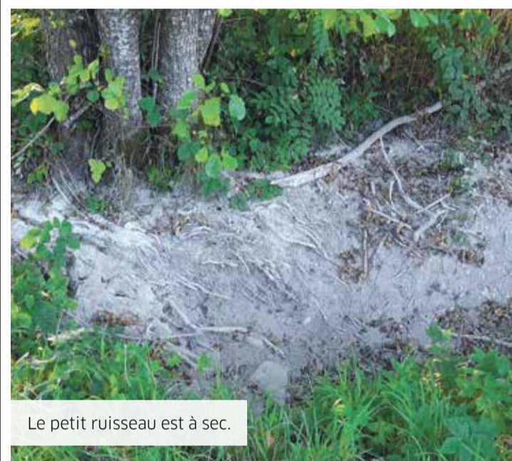
Le petit ruisseau est à sec.

Un ruisseau asséché, c'est comme une chanson qui disparaîtrait