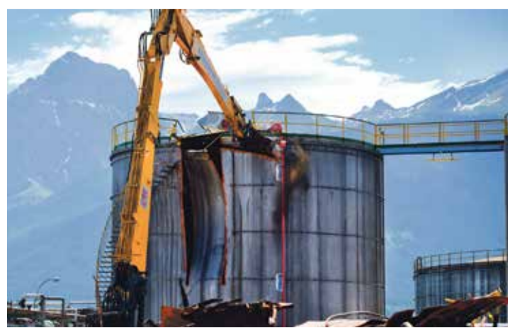
Les 54 citernes qui jalonnent le site sont patiemment grignotées par les machines d'une entreprise argovienne.

Elle a mandaté Pol-Inowex, basée en Pologne, pour mener ce démontage dans les règles de l'art. L'opération a débuté par la modélisation du site, à l'aide de drones. Et au fil de la déconstruction, chaque pièce, des plus grands conduits de cheminée aux plus petites vannes, se voit munie d'un QR code. Quelque 100'000 objets sont documentés de cette manière afin de leur permettre de retrouver leur place exacte.