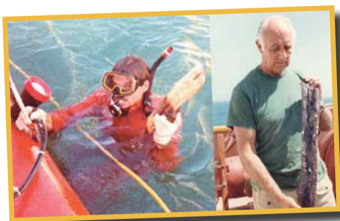
Des morceaux de bois avaient pu être remontés, puis analysés au carbone 14.