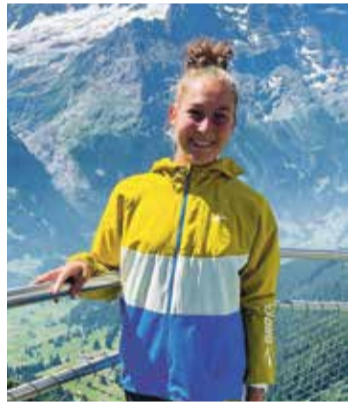
La coureuse de Chardonne se réjouit de courir à nouveau à Sierre-Zinal.

Compte tenu des circonstances, la citoyenne de Chardonne ne se montre pas trop ambitieuse