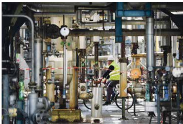
Les travaux se poursuivront encore trois à quatre ans.