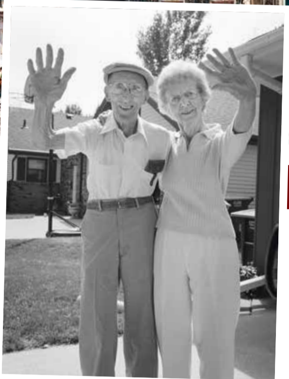
Deanna Dikeman a photographié ses parents pendant 27 ans. | D. Dikeman