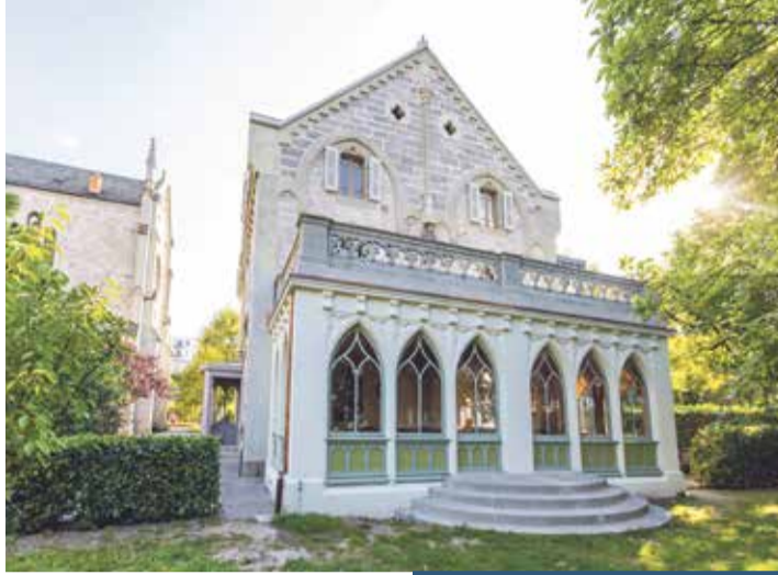
Les pièces dédiées à la vie de paroisse sont au rez-de-chaussée. Le prêtre profitera de la terrasse du premier.

Il a fallu ruser pour créer des ouvertures et faire passer des câbles sans abîmer les sols.