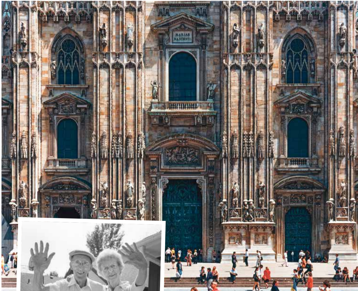
Le Dôme de Milan, tel qu'immortalisé par Thomas Struth, sera projeté en format XXL, face à la gare.