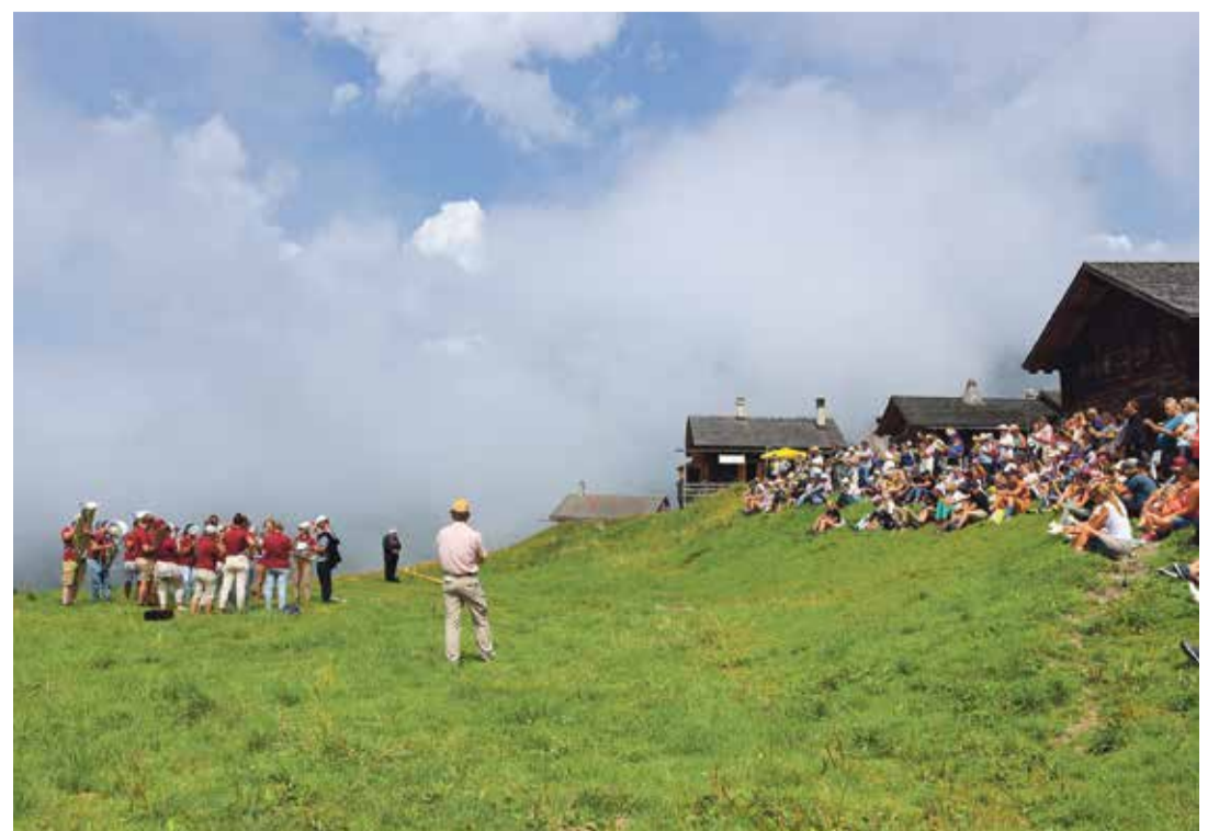
Pas de Mi-été sans la danse du Picoulet (en haut) ou la chanson de Juste Olivier.