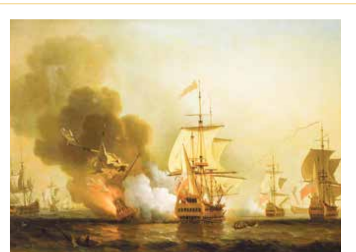
En décembre 1981, entre deux explorations, le submersible croise au large des Iles du Rosaire.

À bord, la vie s'organise. L'équipage est composé de huit