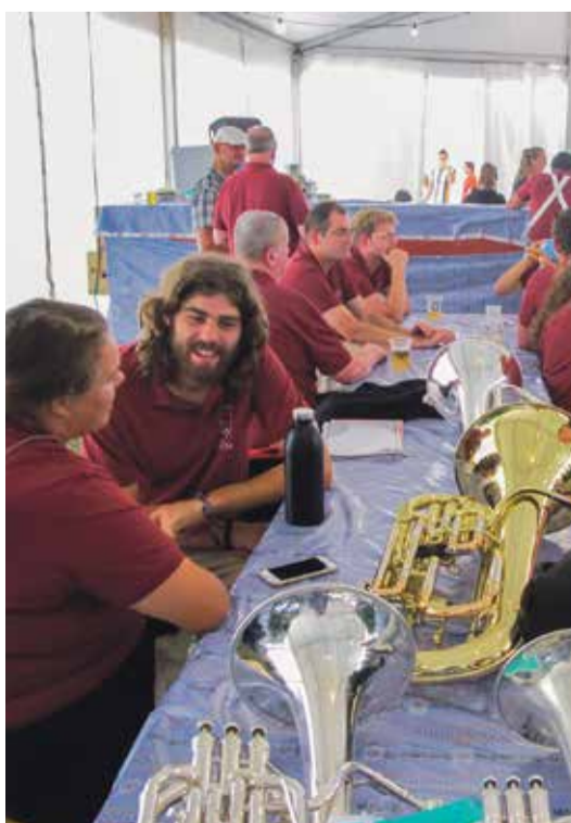
Ses musiciens en pleins préparatifs.