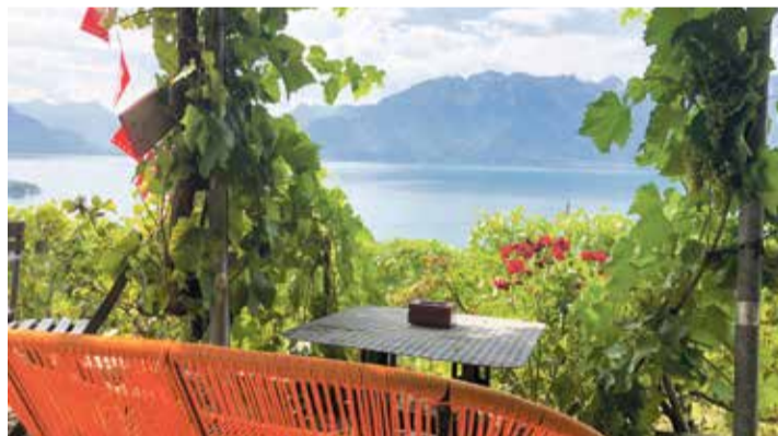
La Combe offre un moment de fraîcheur et d'ombre aux promeneurs qui s'aventurent sous les trois soleils de Lavaux.