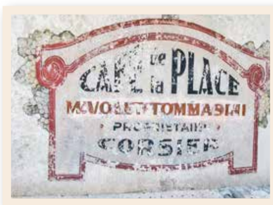
L'enseigne du Café de la Place avant restauration.