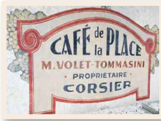
L'enseigne du Café de la Place après restauration.