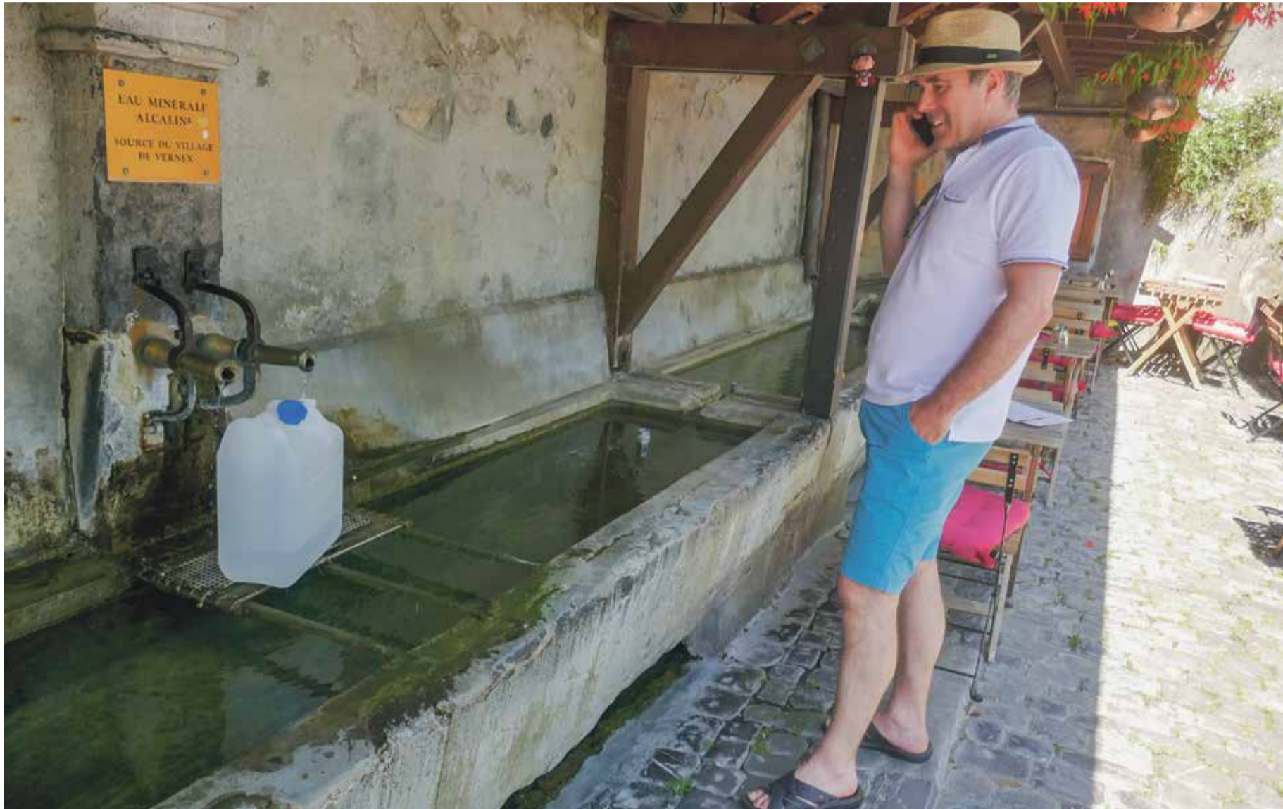
De nombreux voisins viennent quotidiennement s'approvisionner en eau alcaline.