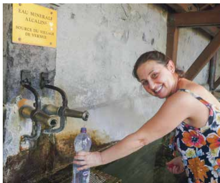
La fontaine fait l'objet de visites tout au long de la journée.

Une seconde fontaine offre de l'eau alcaline à Montreux, à la rue du Bon-Port, quasiment en