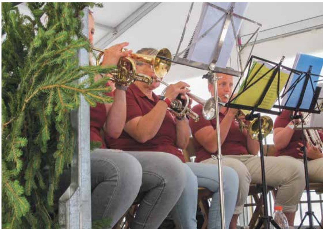
La fanfare de Gryon a animé une partie de l'après-midi.