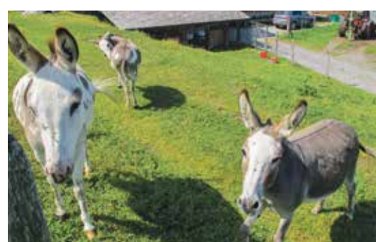
Les ânes ont apprécié les caresses des visiteurs.