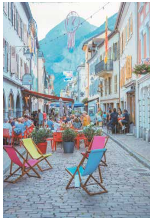
Les concerts ont eu lieu dans la Grand-Rue.