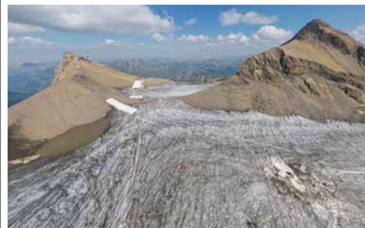
Le col sera totalement dégagé d'ici à quelques semaines.