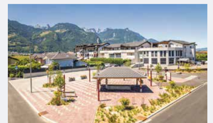
Le projet réalisé est celui du bureau alalberti.