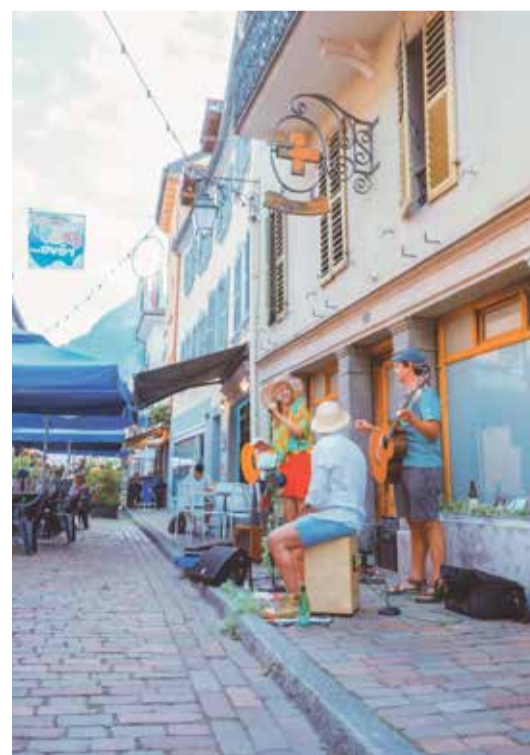
Page 13 est un groupe de pop-rock valaisan.