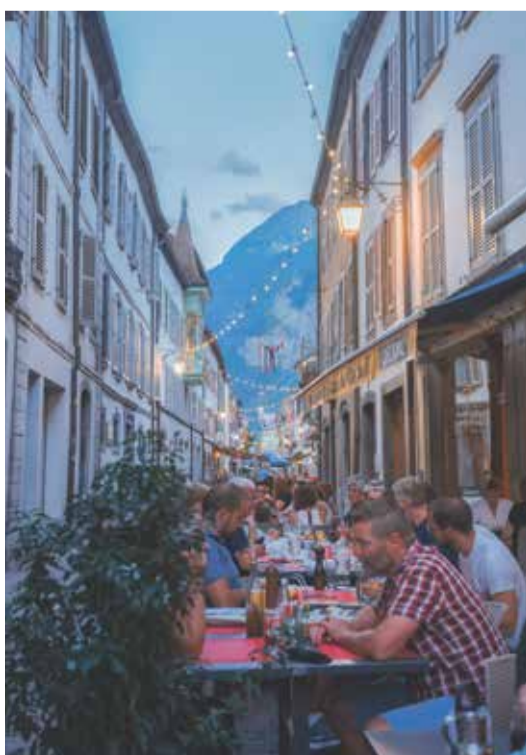
Cette édition était placée sous le signe du rêve.