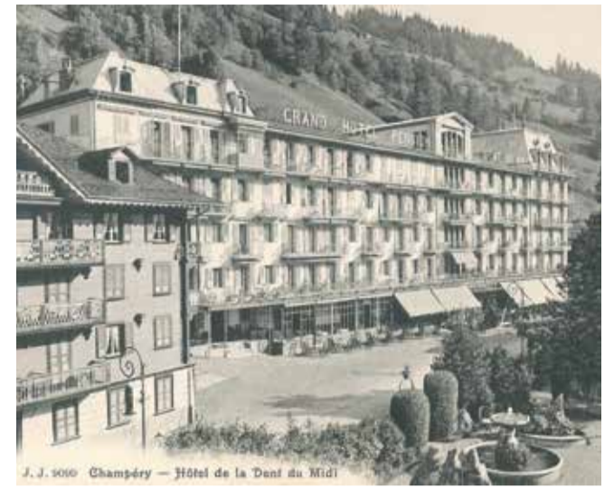
Le Grand Hôtel de la Dent du Midi, du temps de sa splendeur.

Le 27 août, le livre «Vérossaz» sera verni et présenté officiellement lors d'une grande fête villageoise, aussi ouverte à celles et ceux qui n'habitent pas sur la commune. Entre partie officielle, apéro et repas, le sentier didactique sera inauguré dans l'après-midi. Parmi les activités proposées, les élèves autochtones guideront un parcours entre les richesses patrimoniales. La soirée se terminera en musique avec un bal organisé par la Jeunesse.