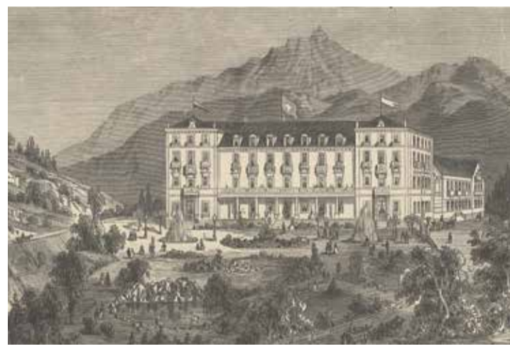
Une gravure qui donne une idée des fastueux aménagements extérieurs entourant le bâtiment. | Collection Fabrice Ducrest