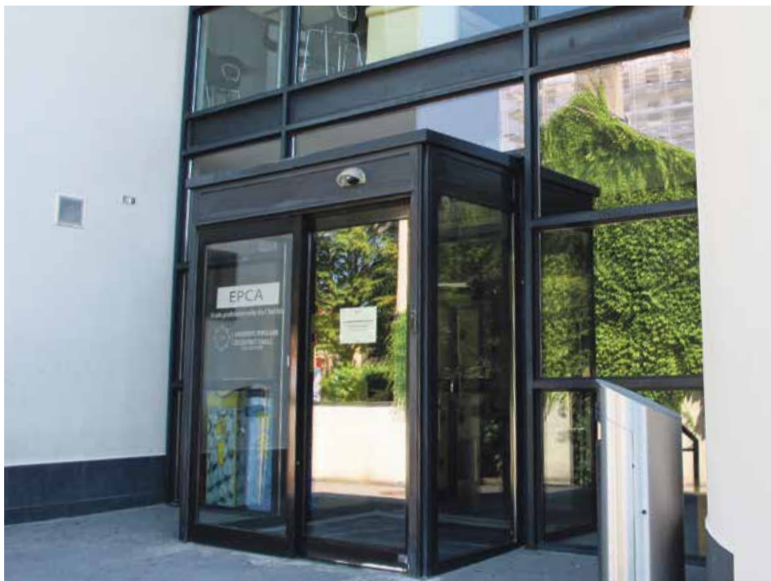
Le bâtiment de l'École professionnelle du Chablais à Aigle accueille en tout, mais pas en même temps, quelque 700 élèves.

L'EPCA accueille 750 élèves (autant de filles que de garçons) dès 16 ans, issus de l'Est vaudois. Les formations dispensées couvrent le certificat fédéral de capacité (CFC) et l'attestation fédérale de formation professionnelle, le deux en vente et commerce, le préapprentissage, la maturité professionnelle.