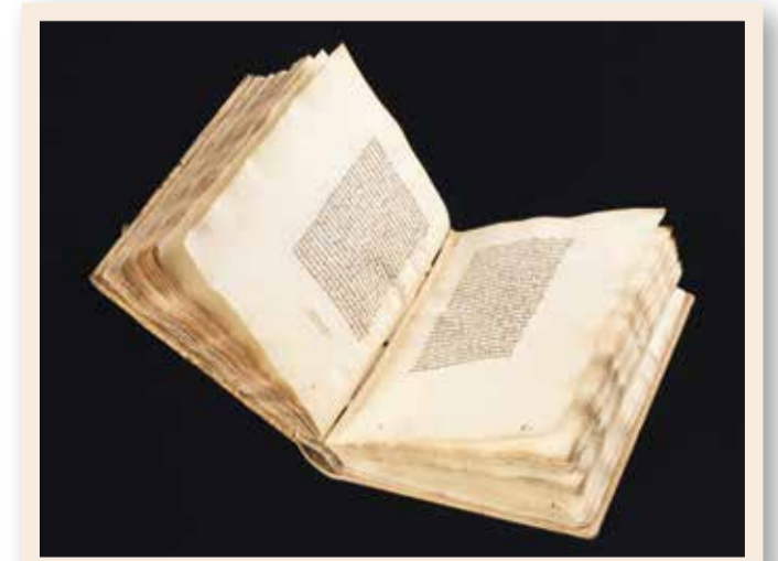
Manuscrit De vita solitaria de Pétrarque, XV e siècle.

1892: le manuscrit, vendu par l'antiquaire, quitte le Chablais et rejoint la Bibliothèque de Lausanne où il est toujours conservé à ce jour.