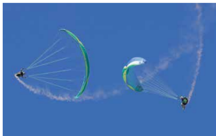
Les dix meilleurs parapentistes du monde vont s'affronter lors de duels où l'esthétique prime sur la technique. | Acro Show

Pour voir ces sportifs en plein exercice, le public est attendu à la place de l'Ouchettaz à Villeneuve en cette fin de semaine: vendredi (11h-2h), samedi (10h30-2h), dimanche (10h30-18h00). L'événement est gratuit, bar et restauration sur place. Les horaires des démonstrations peuvent être retardés en fonction des conditions météorologiques. Les organisateurs donneront des informations régulièrement sur leurs réseaux sociaux.