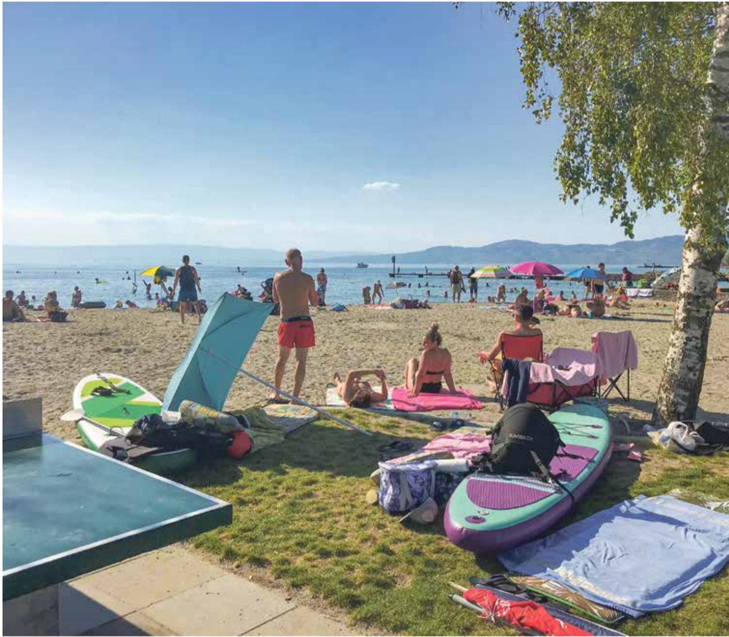
Gratuite depuis cet été, la nouvelle plage Rive Bleue fait l'unanimité des visiteurs.