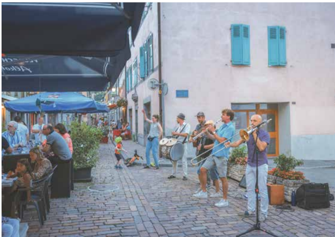
Les musiciens du Pichette Klezmer Band ont fait swinguer la rue.