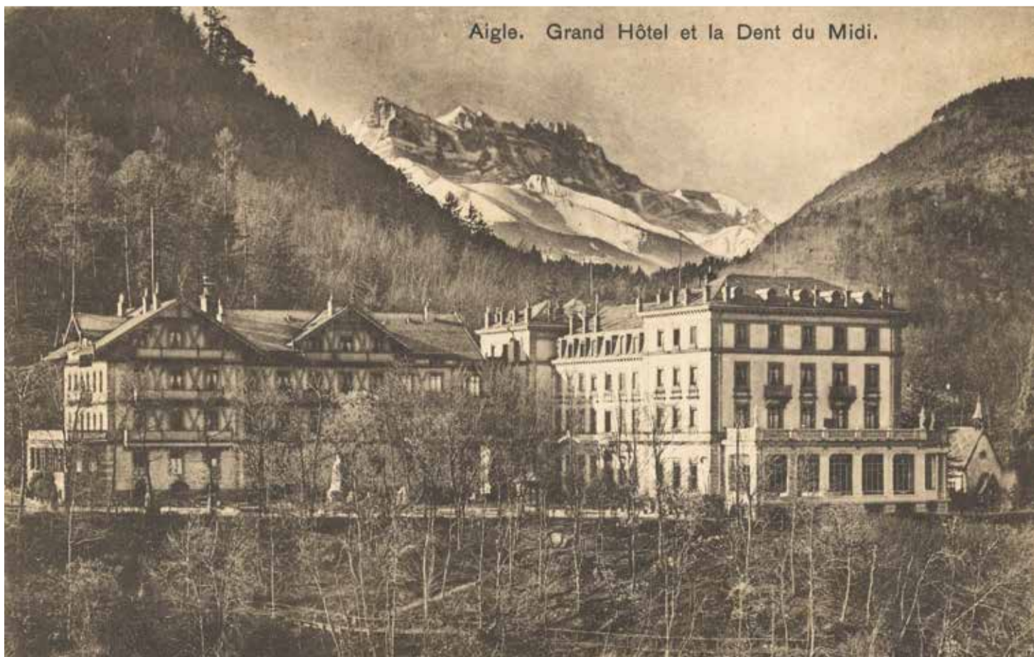
De nombreuses cartes postales subsistent, témoignant du style néo-classique du bâtiment.

portage consacré à Aigle, en 1897. On trouve aussi «à côté de l'hôtel, une ferme et des vaches pour les amateurs de cures de lait».