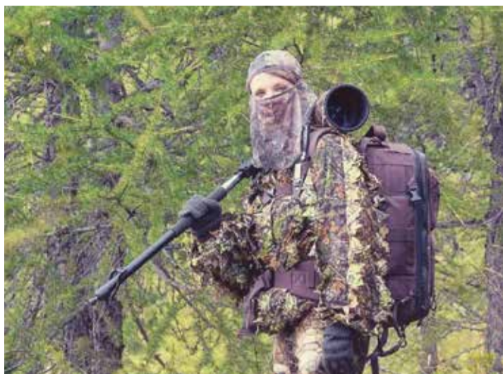
Porte-parole romande du GLS est aussi photographe animalière amateur. Elle étudie le loup sous toutes ses coutures depuis des années.

Combien de loups compte-t-on entre Chablais, Riviera et Pays-d'Enhaut ?