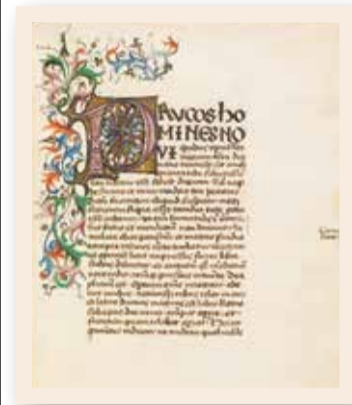
Préface du manuscrit De vita solitaria de Pétrarque, XV e siècle. | BCU Lausanne, V 1762.

1346 à Vaucluse (aujourd'hui Fontaine-de-Vaucluse): l'auteur florentin Pétrarque (1304-1374) écrit les derniers mots de son œuvre De vita solitaria qu'il dédie à son ami Philippe de Cabassolle (1305-1372), l'évêque de Cavailon: «Bene suades, recte consulis, verum dicis.» (Tu es de bon conseil, tu réfléchis avec droiture, tu dis la vérité).