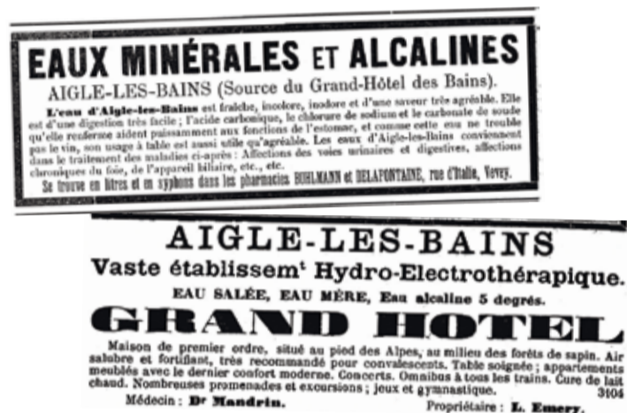
Dans la Feuille d'avis du district d'Aigle et L'Estafette, des réclames vantent les vertus de la source aiglonnaise.

L'établissement se positionne rapidement à la pointe des soins balnéaires et le bâtiment qui les abrite, attendant à l'hébergement, est inauguré en 1873. Bains d'eau salée et d'eau mère (un résidu riche en minéraux produit lors de l'extraction de l'évaporation du sel) y sont proposés et «des douches de tous genres, à toutes les pressions», décrit le «Journal et liste des étrangers de Montreux, de Vevey, de la vallée du Rhône et des Stations climatiques romandes» dans un re-