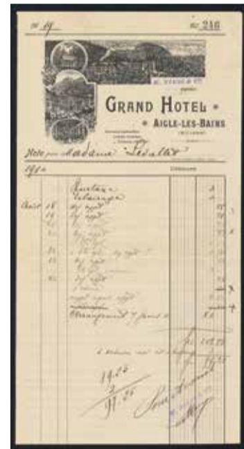
Facture adressée par le Grand Hôtel d'Aigle-les-Bains à Madame Levallet.