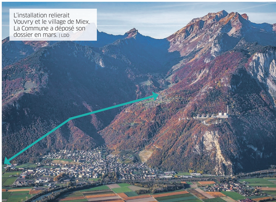
L'installation relierait Vouvry et le village de Miex. La Commune a déposé son dossier en mars.