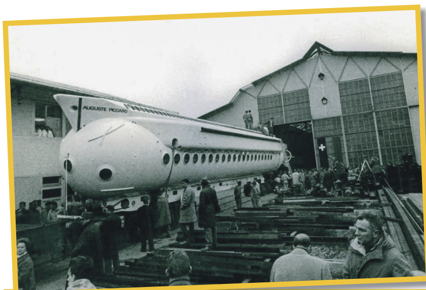
De nombreux ouvriers ont assisté à la sortie du mésoscaphes le 21 février 1964.

jusque dans le Léman. Anecdote cocasse: par souci écologique, la machine a été nettoyée avant sa baignade. Mais faute de solution pour traiter l'eau souillée, elle a été déversée... dans le lac. Cette mésaventure n'a toutefois pas entaché le grand jour: c'est le 27 février à 10h56 que le mésoscaphes PX-8 a été baptisé, devant la foule venue assister à l'événement.