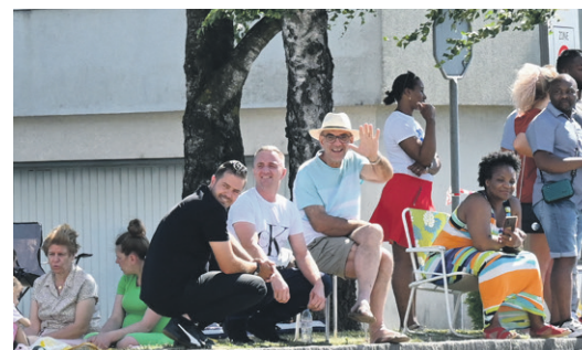
Certains ont pris de quoi patienter confortablement.