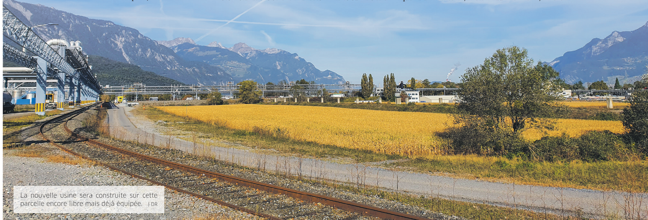
La nouvelle usine sera construite sur cette parcelle encore libre mais déjà équipée.

Cimo va aussi se charger des démarches liées au permis de construire. Dans le calendrier idéal, la demande devrait être déposée le 25 juillet, les autorisations délivrées d'ici à la fin de l'année et la première pierre posée début 2023. «Nous comptons 18 mois avant la mise en service, c'est peu, mais nous avons beaucoup travaillé en amont pour accélérer le processus le moment venu», assure le président du Conseil d'administration d'Helvoil.