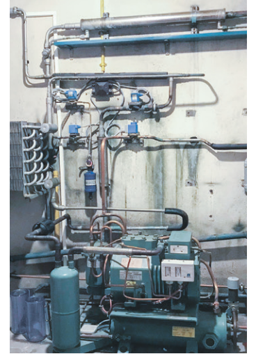
Veillant, le système de réfrigération connaît parfois des ratés.