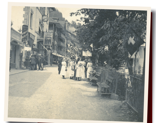
La Grand Rue de Champéry, 1912-1916.