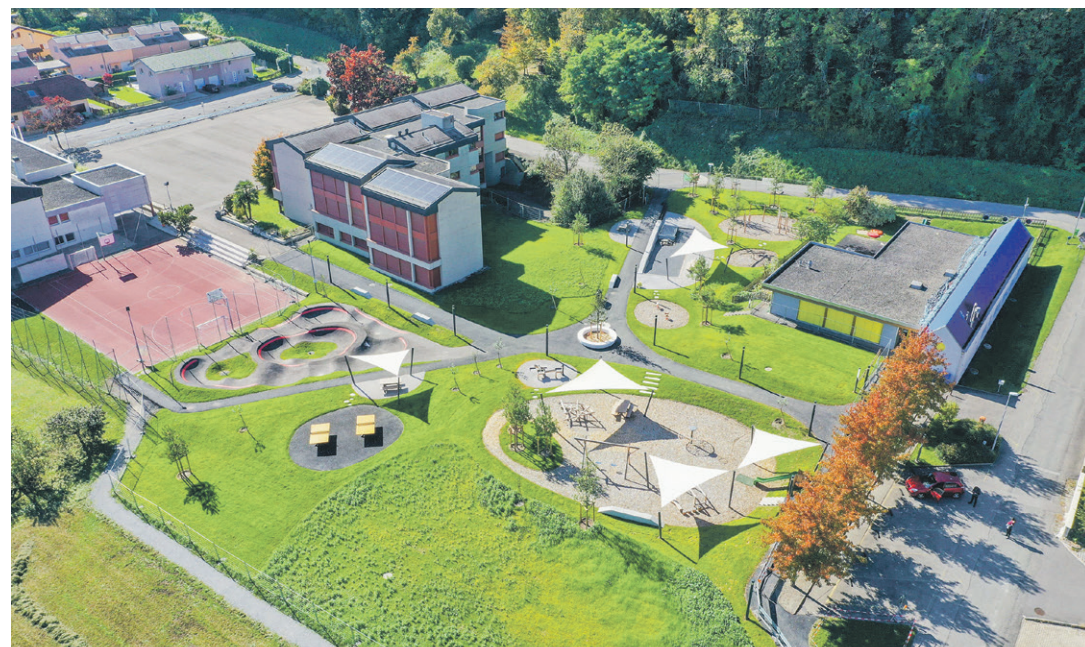
L'objectif d'Interface est de limiter la circulation sur les routes d'accès à l'école et la crèche.

Les travaux définiront de nouveaux flux de circulation. Pour résumer, il ne sera plus possible de faire le tour de l'école en sens unique par la route actuelle. La circulation s'arrêtera à la hauteur du parking des Fontanies d'un côté, vers la crèche de l'autre, avec, sur chaque secteur, un petit rond-point pour faire demi-tour. Seuls les bus pour la piscine et autres courses spéciales pourront passer outre. Le chantier est prévu en cinq phases «et il est important que la première, dans le secteur des Fontanies, soit terminée d'ici à la rentrée pour amener les élèves», précise Yoann Schmid. Le tronçon de route rendu aux piétons sera en outre végétalisé.