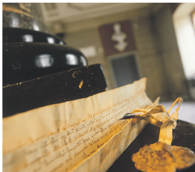
La plume qui a vraisemblablement servi à sa rédaction a été attachée à l'acte de 1268.

Visites, sport, terroir, aventures sont au programme des animations concoctées par Aigle Tourisme. Pour exemple, tous les mardis, petits et grands pourront découvrir les arcanes du Centre mondial du cyclisme. Cap le mercredi sur les aventures d'Hugo, «guide» de la maison Reizel. Aventure les mercredis entre chasse au trésor et recherche des prisonniers au Château. Vendredi permettra de découvrir Aillys et ses oeuvres d'art. Et pour boucler la boucle, un tour de ville guidée le samedi. CBO