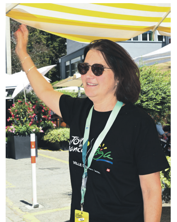
La Commune et les commerçants ont mis les petits plats dans les grands pour accueillir les spectateurs.