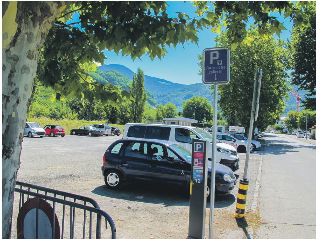
Fini les voitures ventouses sur l'esplanade des Glariers.

«Pour les Glariers, il sera possible de contracter un abonnement mensuel à 60 francs, prioritairement pour les habitants et