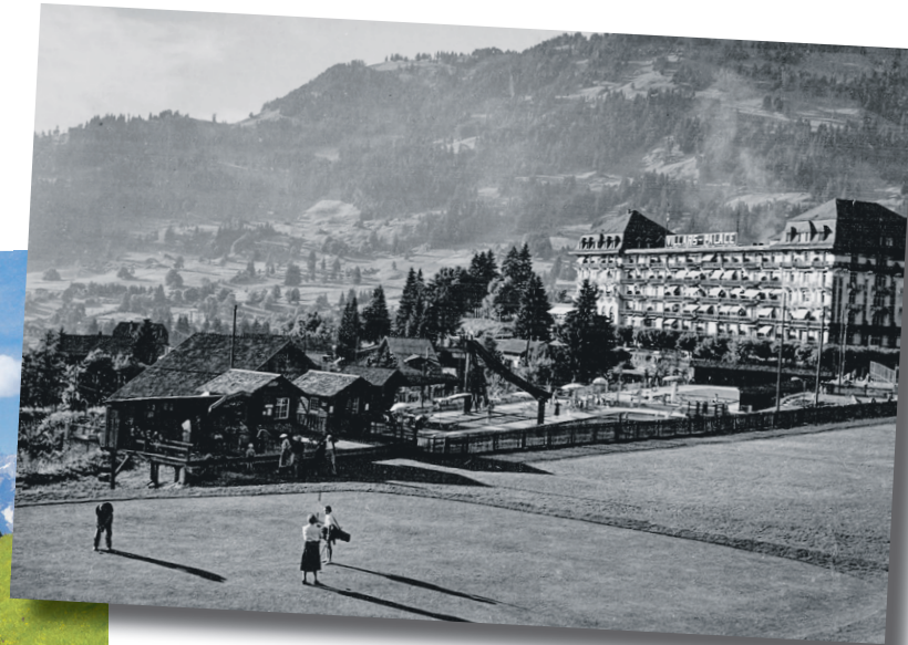
Fondé en 1922, le golf de Villars était autrefois réservé à la clientèle du Palace.