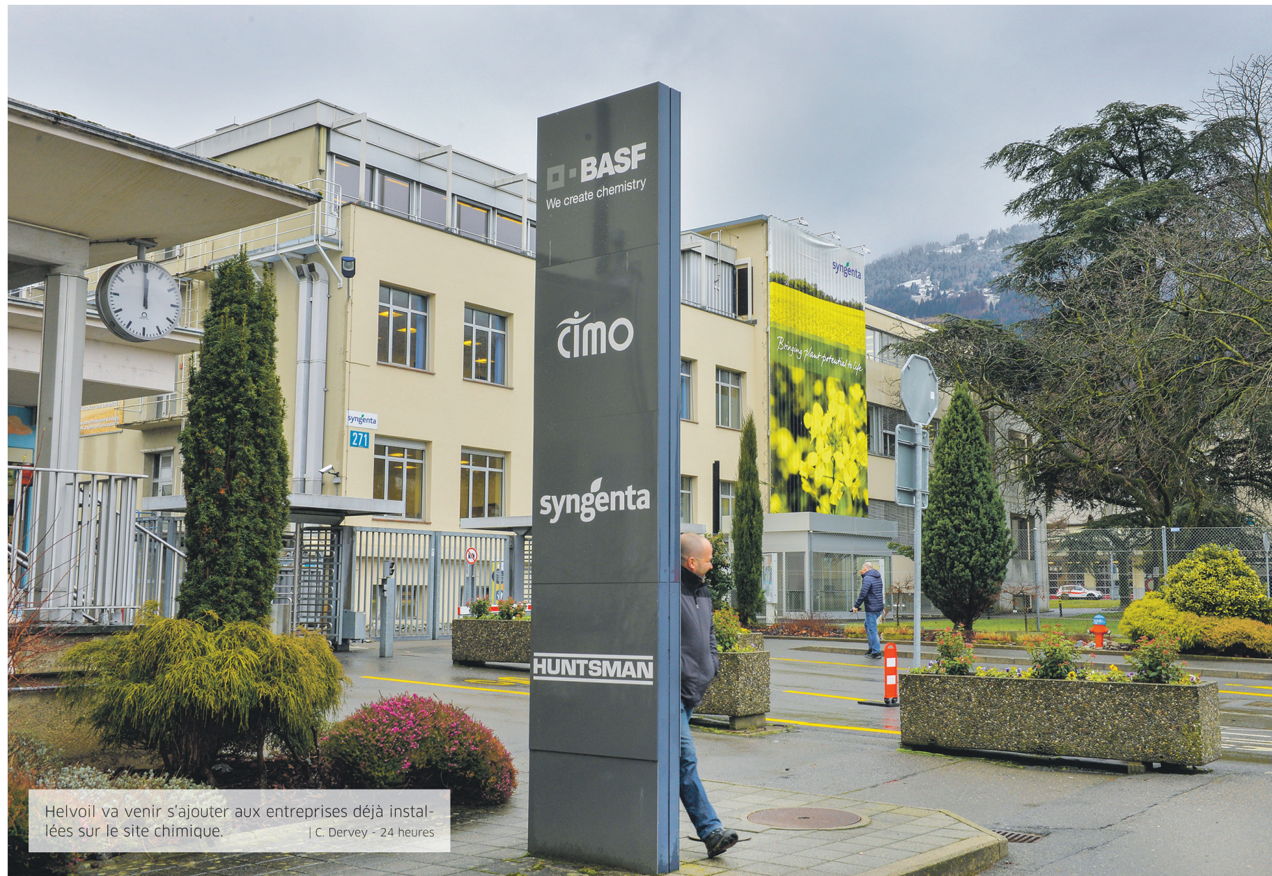
Helvoil va venir s'ajouter aux entreprises déjà installées sur le site chimique.