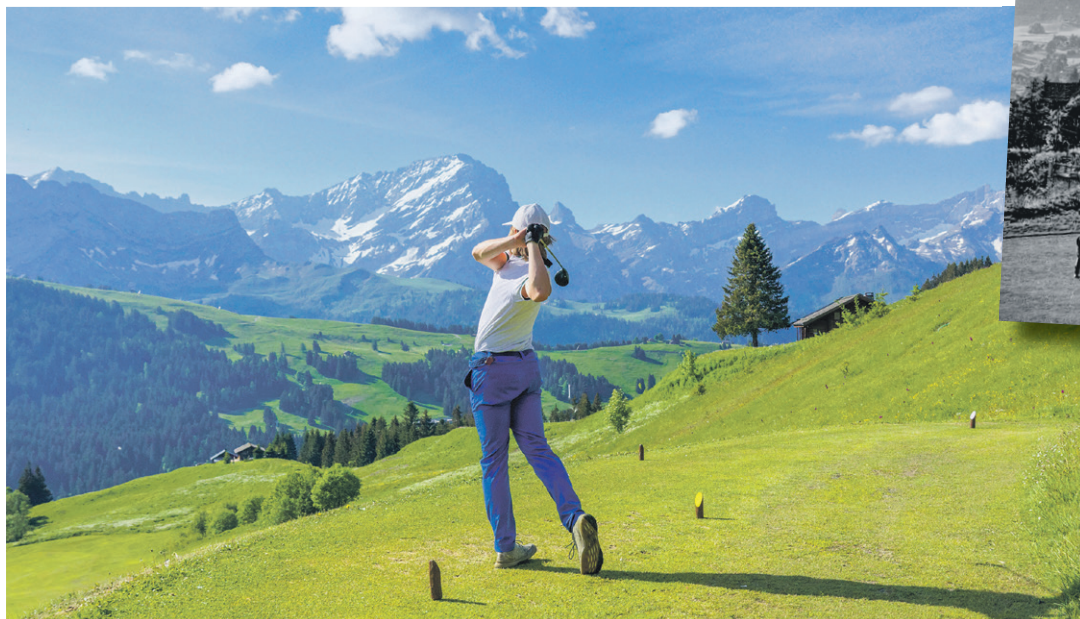
Au Golf Club Villars, les joueurs peuvent lâcher leurs meilleurs coups de mai à novembre.

Il faut monter à plus de 1'600 mètres d'altitude pour rejoindre les gazons fraîchement taillés du golf de Villars. Perché à quelques