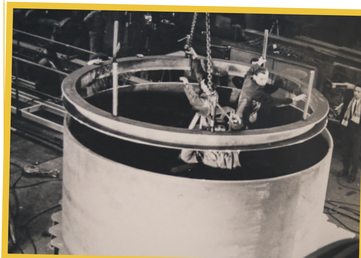
Pour résister à la pression, la structure est renforcée par des anneaux.

Selon l'ancien employé, face à des problèmes de gestion, l'entreprise a décliné en 2-3 ans. Elle a définitivement mis la clé sous la porte en 2003, laissant sur le carreau environ 150 personnes.