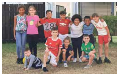
Le petit groupe d'enfants a volontiers pris la pose comme une équipe de pros pour la photo.

stars, personne au-dessus de personne. J'ai demandé à des parents qui étaient sur un balcon s'ils m'autorisaient à prendre une photo de cette équipe hors norme. Les parents m'ont dit oui. Je les en remercie encore. J'ai dit aux gosses, d'accord pour une photo, pour le journal Riviera Chablais! Ils se sont tournés dans ma direction, et m'ont demandé, d'une seule voix, les yeux tout allumés d'incrédulité et d'espoir: «C'est vrai, m'sieur, on va être dans le journal?, trop bien!» Ils se sont regroupés pour la photo comme une grande équipe avant un grand match. Mais dans le fond, c'était une grande équipe et c'était un grand match. Puis trois ou quatre ont couru vers moi pour taper dans ma main très fort, en signe de fraternité et de gratitude. Ce n'est pas vous, chers enfants, qui me devez quelque chose. C'est moi qui vous suis reconnaissant, car vous m'avez ramené au plus profond de mon amour du football, ce jeu qui ne doit jamais oublier de rester un jeu. D'ailleurs, il devrait y avoir dans les villes beaucoup plus de petits terrains publics ouverts au bonheur spontané et enfantin de tous les garçons et les filles qui ont envie de jouer ensemble. On apprend beaucoup de choses à l'école, mais dans le quartier, avec un ballon, c'est la vie avec l'autre qu'on apprend.