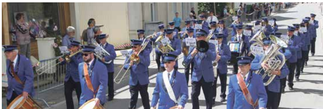
Histoire de fêter ses 20 ans, il revient au Corps de Musique Montreux Clarens d'organiser le Giron des Musiques d'Aigle ce week-end.