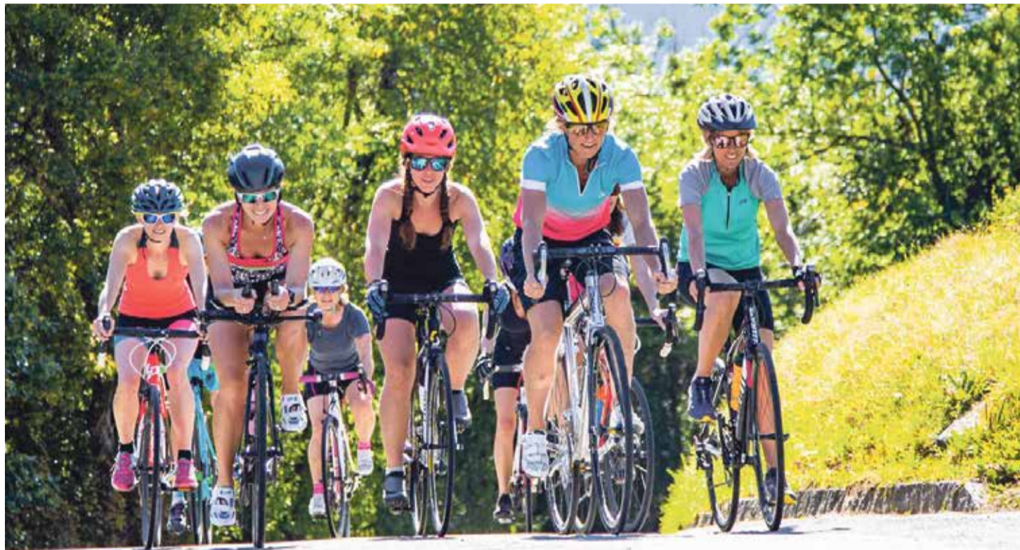
Lors des TRIdays, les participantes recevront des conseils dans les trois disciplines: natation, course à pied et vélo.