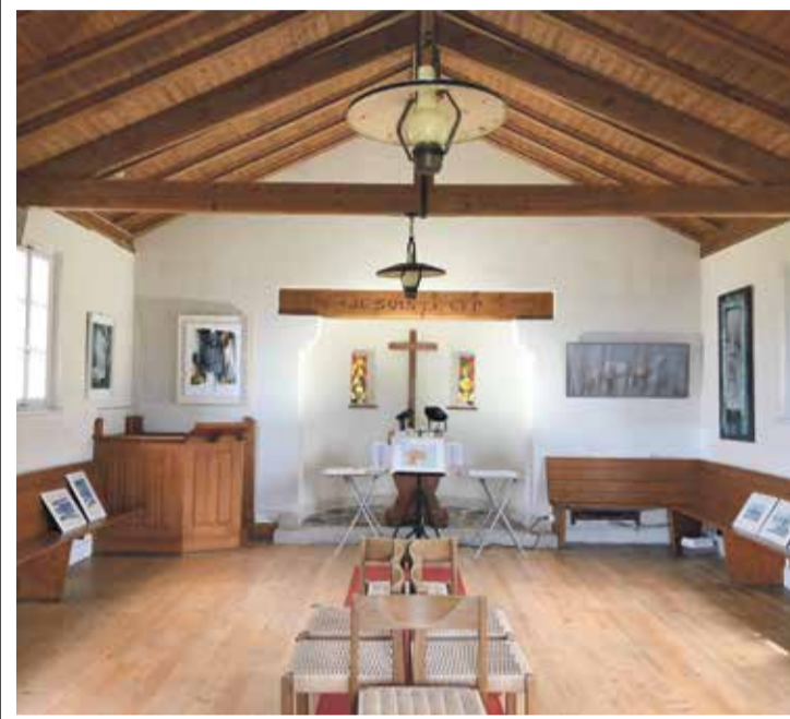
Le lieu de culte s'offre une reconversion de trois semaines. En attendant plus ?