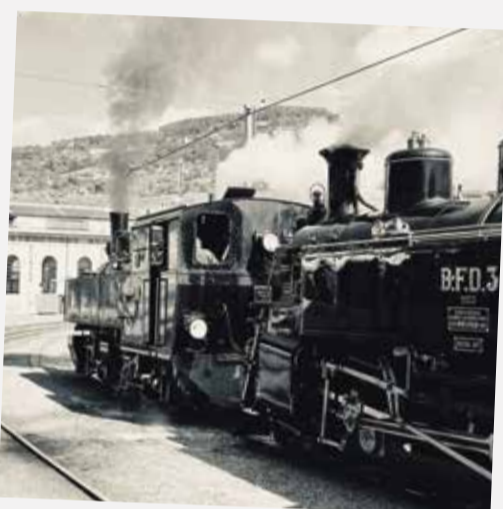
Ce lundi de Pentecôte, la gare de Vevey fait un bon d'un siècle en arrière. Attention au départ!