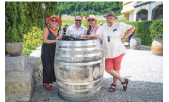
Une famille venue de Berne.