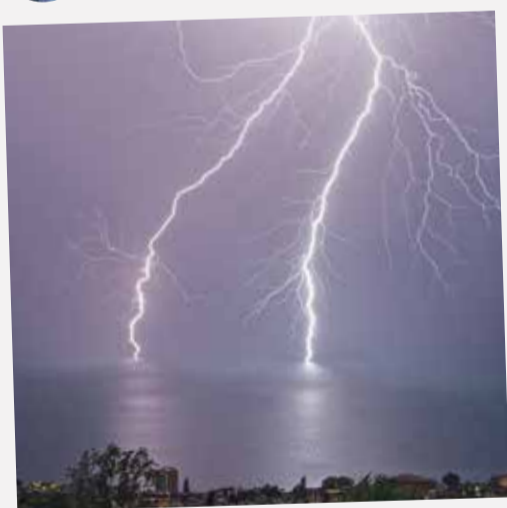
Le feu au lac depuis Chernex.