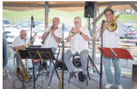
Old Distillery Jazz Band.