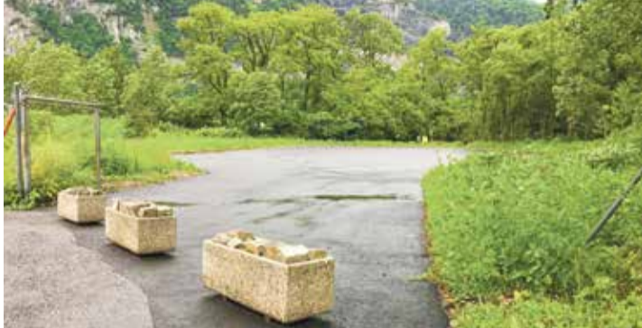
Selon le président de la commune, des tests ont été effectués sur la terre avant le goudronnage et d'autres sont encore prévus. | K. Di Matteo