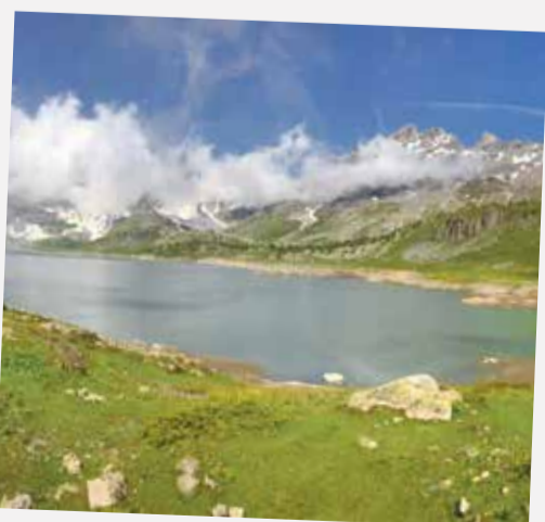
Balade à Salanfe. Trop de possibilités pour un seul jour. Le tour du lac vaut la montée à lui tout seul. À bientôt pour le reste