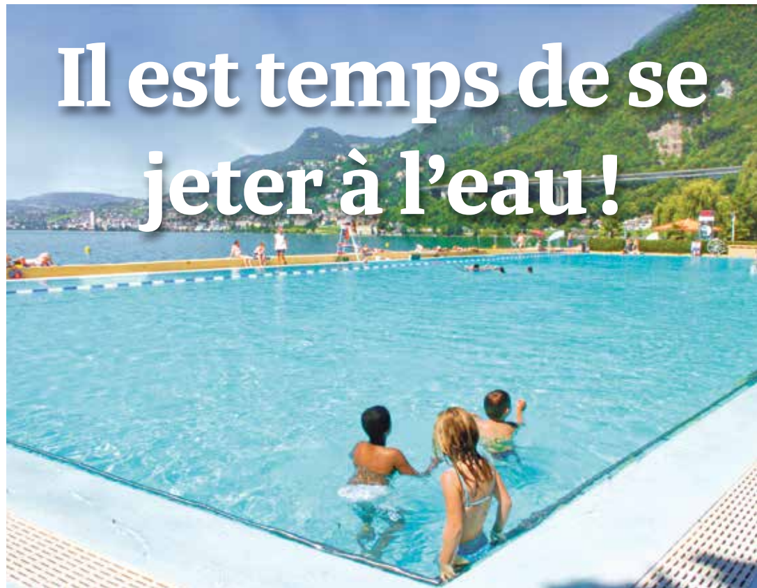
La piscine de Villeneuve ouvre ce samedi.