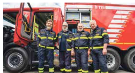
Les pompiers du Pont-Saint-Martin de la ville italienne d'Aoste.