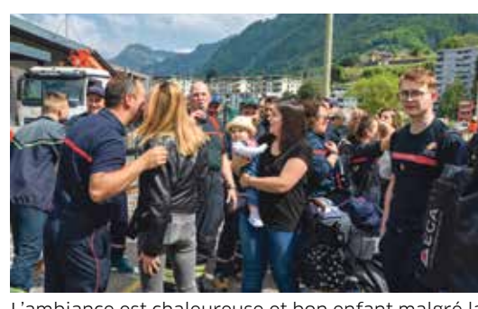
L'ambiance est chaleureuse et bon enfant malgré la compétition entre les pompiers.