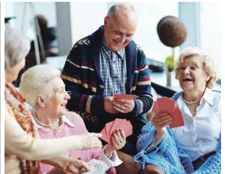
De activités de toutes sortes sont proposées à l'Escale.

Au-delà des bienfaits de l'apprentissage de la musique, cette initiative vise également d'autres avantages comme une meilleure intégration des seniors dans la société. «On entend souvent que l'objectif est de rester le plus longtemps possible chez soi avant d'aller à l'EMS, mais si on pouvait le faire en se sentant super bien, ce serait encore mieux!», conclut la violoniste.