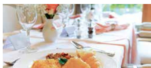
Une table et un service hôtelier de premier ordre.

Un espace Snoezelen, un salon de coiffure, une salle de gymnastique et de rééducation sont à disposition de nos hôtes. Ces espaces permettent d'offrir un lieu de divertissement et relaxant tout en respectant leurs envies.