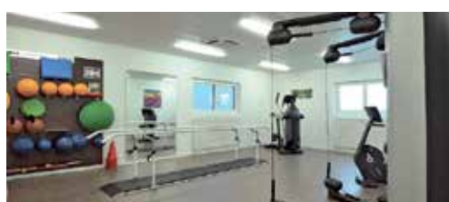
Salle de gymnastique et physiothérapie.

Le domaine du Château de la Rive jouit d'une situation idéale au bord du lac Léman, bénéficiant d'un climat doux et d'un ensoleillement optimal tout au long de l'année. Nous menons sans cesse de nouvelles réflexions visant à répondre toujours mieux aux attentes et aux besoins spécifiques de nos 103 résidents. Nos collaborateurs parfaitement qualifiés et dévoués assurent un service personnalisé, répondant ainsi aux habitudes et au rythme de chaque résident.