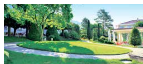
Les 3 bâtiments de l'établissement sont idéalement implantés au cœur d'un parc arborisé de 10'000 m².

En choisissant de vivre dans un cadre harmonieux et accueillant, le Château de la Rive, un établissement moderne à taille humaine, est particulièrement soucieux d'offrir à ses résidents un cadre de vie, un confort et un sentiment de bien-être élevés.