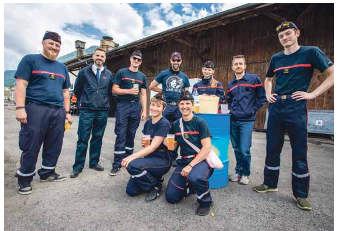
Les pompiers des Salines, regroupant Ollon, Bex et Gryon.