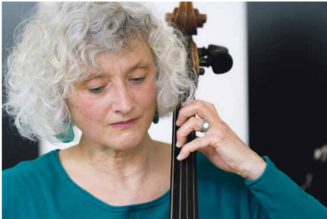
Le violoncelle figure parmi les instruments enseignés, comme la guitare, l'orgue ou le piano.

Il n'y a pas d'âge pour apprendre. Les membres de l'association Musique et Seniors souscrivent totalement à cette maxime. Depuis quelques mois, la structure basée à Aigle propose de mettre en lien des musiciens professionnels et des personnes âgées pour des cours privés ou des ateliers collectifs. Piano, guitare, accordéon, violon, violoncelle, orgue, hackbrett (instrument à cordes frappées), harpe celtique et chant: que l'on ait déjà des connaissances ou que l'on soit un total néophyte, tout le monde peut choisir son instrument.