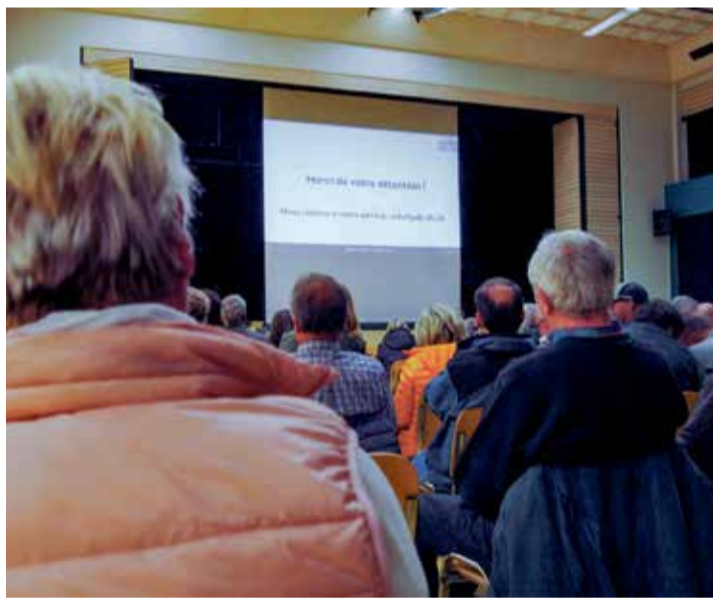
Les clients des Portes du Soleil se sont déplacés en nombre.

ont retenti après chaque étape de la présentation. Quant aux papillons mis à disposition à l'issue de la présentation pour les personnes intéressées par l'acquisition de parts de la société, les 150 à 200 exemplaires préparés n'ont pas suffi à contenter la demande.