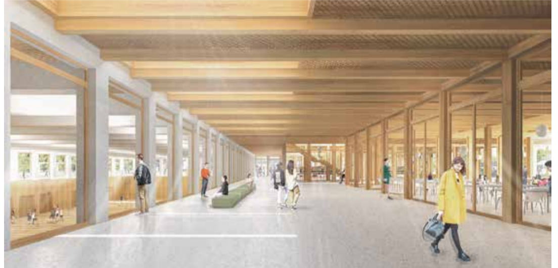
Baptisé «Rose des vents», le projet de futur gymnase d'Aigle incarne la volonté du Canton de mettre le bois au centre de ses constructions. | DR - G. Rodriguez Architectes/État de Vaud