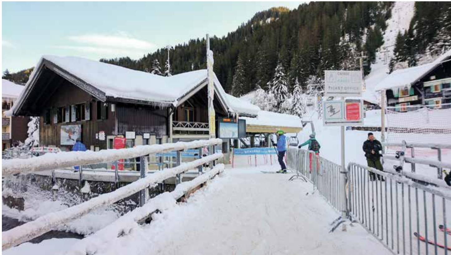
La prochaine échéance concerne le télésiège de la Foilleuse qui sera remplacé par une télécabine de toute nouvelle génération.

Cette nouveauté technologique, dont un premier spécimen a vu le jour à Zermatt, permet un gain de productivité et d'attractivité.