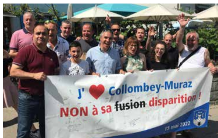
Dimanche, les partisans du non s'étaient retrouvés au restaurant La Treille à Muraz pour fêter la victoire.