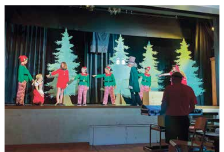
La pièce a été adaptée d'un texte de Dickens.

samedi 28 mai à 20h et dimanche 29 mai à 17h, salle de la Couronne, Yvorne. Entrée libre, chapeau.