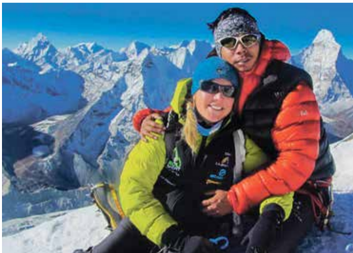
L'alpiniste a rencontré son mari lors d'une expédition au Cho Oyu, premier 8'000 dont elle a tenté l'ascension.