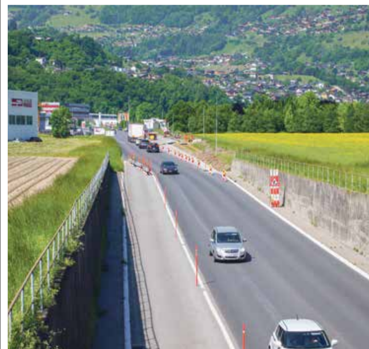
D'ici à juillet, une voie réservée aux transports publics sera aménagée en direction de Monthey. | S. Es-Borrat