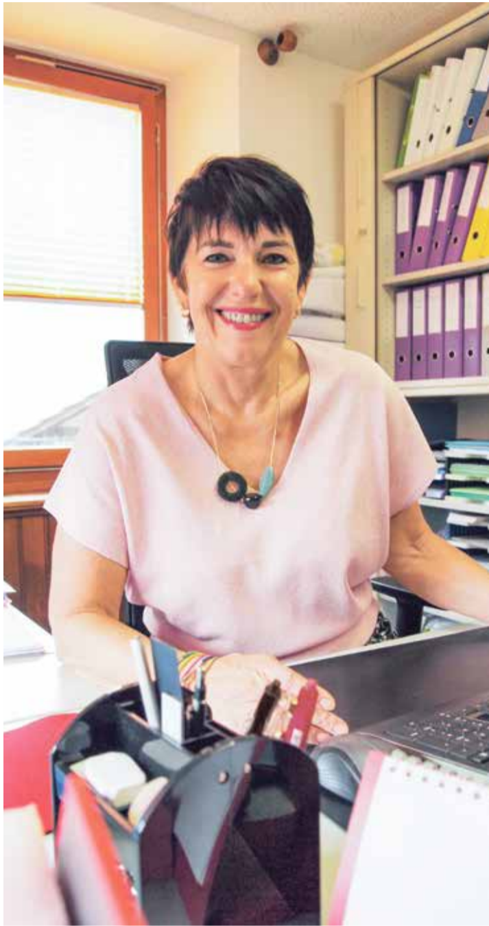
Le présidente de Vérossaz terminera sa carrière politique au Canton et à la Commune en 2025.