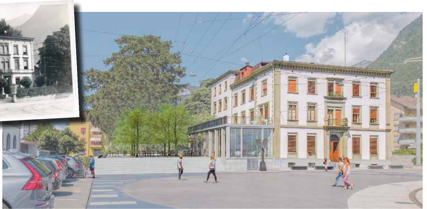
Un restaurant devrait être aménagé au rez-de-chaussée de la bâtisse.

La société de transports a envisagé un temps la possibilité de vendre son siège historique. «Mais la volonté de le garder s'est imposée assez vite, compte tenu notamment de la grande valeur du bien», indique la cadre des TPC. Ensuite,