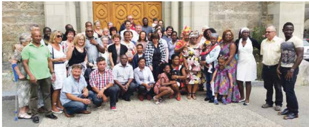
La Chorale africaine d'Aigle se produira ce dimanche à l'église catholique du chef-lieu.

Ils sont aujourd'hui une petite quinzaine à se retrouver et répéter en vue de la dizaine de messes annuelles animées dans toute la plaine chablaisienne ou en station, comme à Leysin en janvier