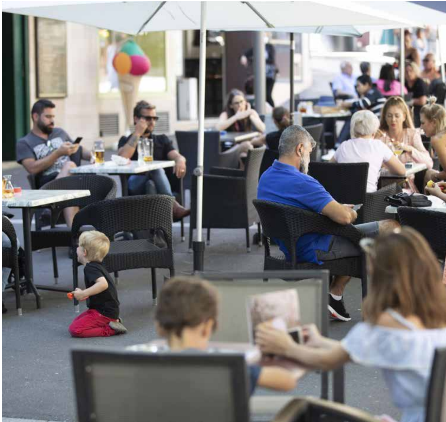
A la faveur des beaux jours, jeunes et moins jeunes prennent d'assaut les espaces extérieurs.