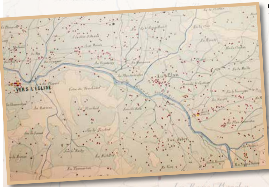
Un coup d'œil aux cartes de jadis (dont celle-ci de 1864) permet de voir que les lieux-dits sont une matière vivante qui subit une lente érosion.