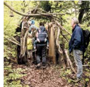
Une porte - magique, forcément - permet d'accéder au Sentier des Songes.

Avant même les nombreuses surprises qui le jalonnent, la vraie magie du tout nouveau «Sentier des Songes» de Corbeyrier est à trouver dans le décor naturel. Une invitation à la contemplation et à la respiration. Baptisé ainsi en référence au texte de William Shakespeare «Songe d'une nuit d'été», le chemin emmène les promeneurs à la découverte d'arbres majestueux, de bois aux couleurs sylvestres et de points de vue somptueux sur le Léman et la vallée du Rhône. Sans parler du silence! - à moins que vous n'attendiez fin juin et le Festival celtique de Corbeyrier.