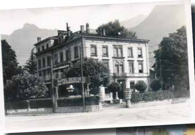
Le bâtiment a été édifié en 1858, peu après l'inauguration de la gare.

«Notre entreprise va en effet demeurer propriétaire du bien. Nous allons louer toutes les surfaces après les travaux. Nous espérons