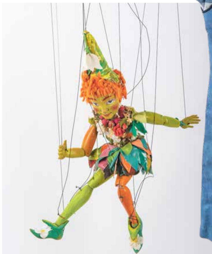
Cette marionnette baptisée Puck date de 1946.

«Au fil de la joie», Exposition au Centre culturel Maison Visinand, jusqu'au 1 er mai 2022 www.cc-mv.ch