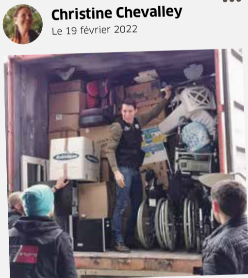
Ce matin, les derniers cartons ont été remplis, le container chargé, il partira lundi pour son voyage jusqu'au Liban.