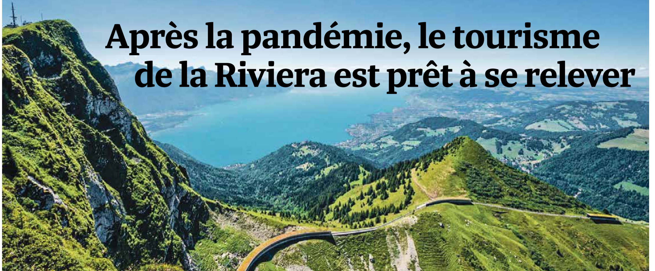
Culminant à 2'042 m et inclus dans le Parc naturel régional Gruyère Pays-d'Enhaut, les Rochers-de-Naye sont l'un des fleurons paysagers de la Riviera.