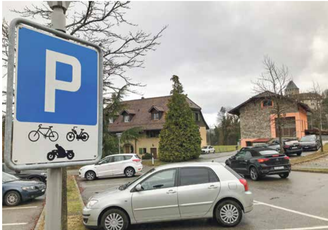
C'est sur ce parking situé à l'entrée de Blonay que le plan d'affectation prévoit la construction d'une vingtaine de logements. Au fond en jaune, la maison de la Paroisse pourrait quant à elle disparaître.

Selon lui, il ne sera pas encore possible de présenter des réponses claires lors de la prochaine