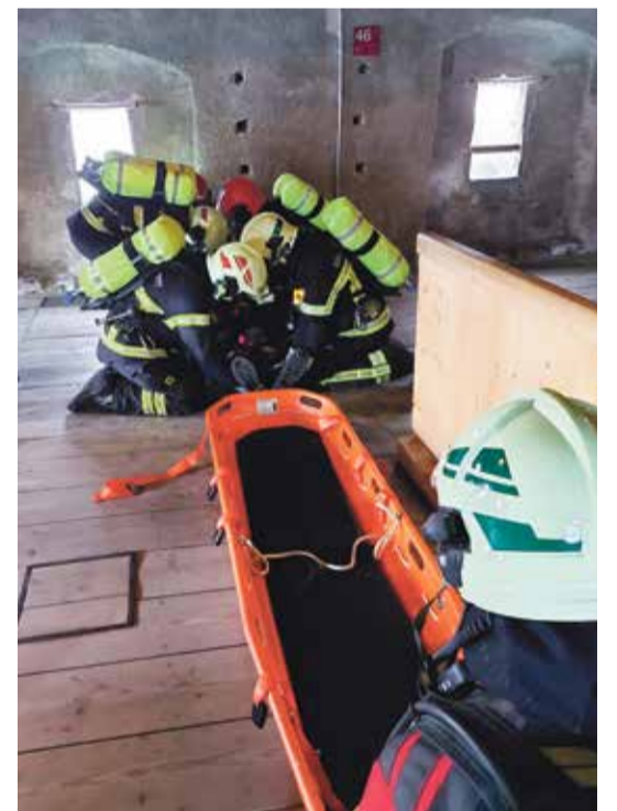
Un ouvrier tombe fictivement dans le donjon pendant les travaux de fumigation.