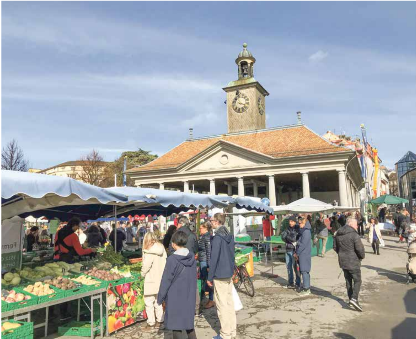
Au pied de la Grenette, le marché de Vevey n'a pas perdu de sa vitalité.