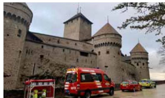
Les soldats du feu ont pu s'exercer entre les vieilles pierres du Château de Chillon.