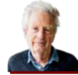
Histoires simples par Philippe Dubath journaliste et écrivain

Appelée à se prononcer sur un projet de crèche et d'EMS, la population de Corseaux est invitée à une séance d'information publique le 8 mars prochain à 19h, à la salle de Châtonneyre. Les autorités présenteront les grandes lignes de cette structure, qui pourrait accueillir jusqu'à 88 places de garderie ainsi qu'une soixantaine de lits pour les personnes âgées. La votation est prévue pour cette année. Lors de sa mise à l'enquête, plus de 230 personnes se sont opposées à ce projet. RBR