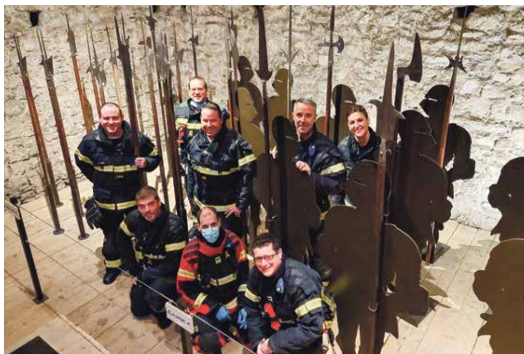
Le SDIS Riviera a ponctué la matinée par une visite des différentes pièces du Château de Chillon.