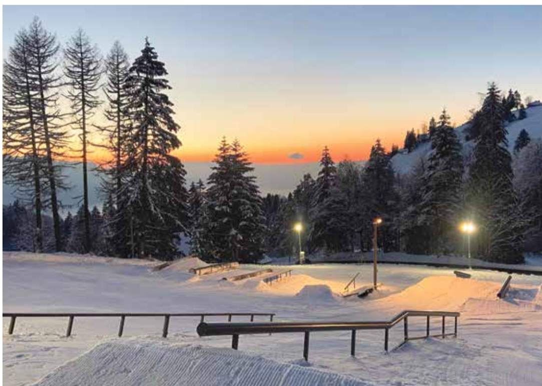
Le snowpark de l'association Orgiride est ouvert au public tous les mercredis et vendredis soir, quand la météo le permet.