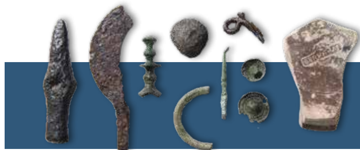
Ces artefacts, exhumés lors des fouilles, témoignent de la vie quotidienne avant la catastrophe.

Retrouvera-t-on encore des traces archéologiques du Tauredunum? Peut-être un peu plus à l'Est, autour de Villeneuve, avance le jeune archéologue. Mais la vague de 563 a réduit à néant les chances de retrouver des vestiges comme ceux de Noville autour du Léman. «Le raz-de-marée a tout lessivé. On ne retrouve rien de cette période au bord du lac. A cet endroit, les plus anciennes constructions que l'on connaît datent de deux siècles après la catastrophe. Manifestement, les gens s'en sont souvenus et se sont installés plus en hauteur pendant un certain temps.»