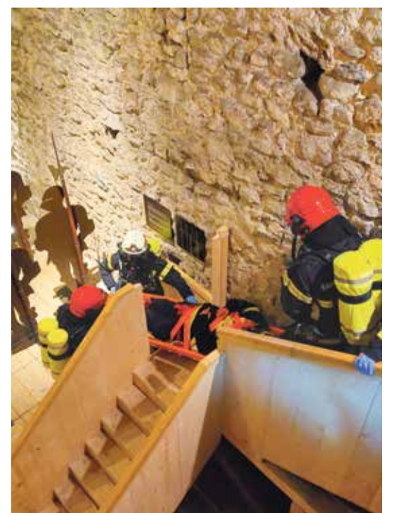
L'équipe a emprunté les escaliers rénovés du donjon pour l'évacuation.