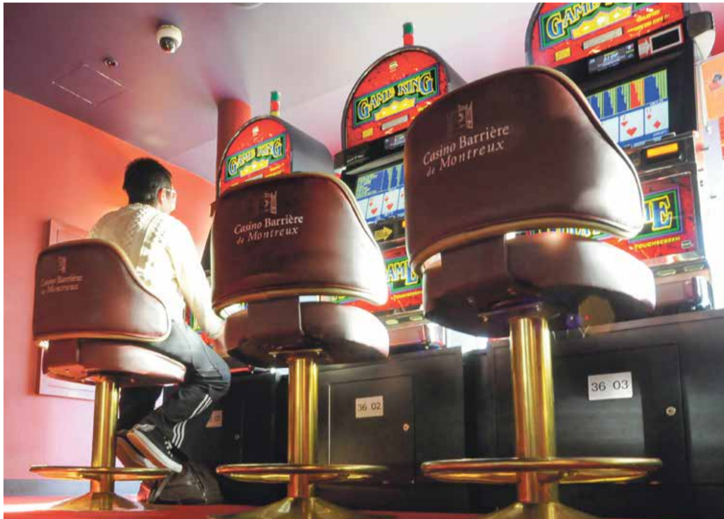
Selon le directeur de la LoRo, ce rapprochement est une suite naturelle de la nouvelle Loi sur les jeux d'argent.