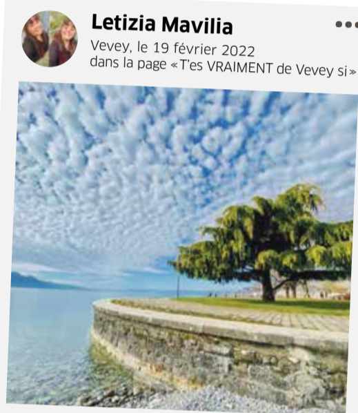
Magnifique petite balade avec un ciel exceptionnellement beau! Un petit air printanier.

Suivez-nous sur notre page Facebook: Riviera-Chablais