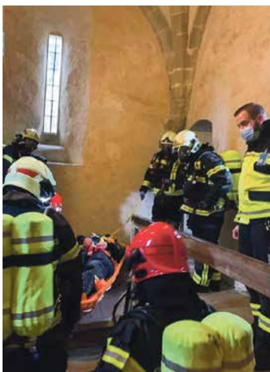
La colonne de secours réagit rapidement. Elle soupçonne une lésion à la moëlle épinière du blessé.