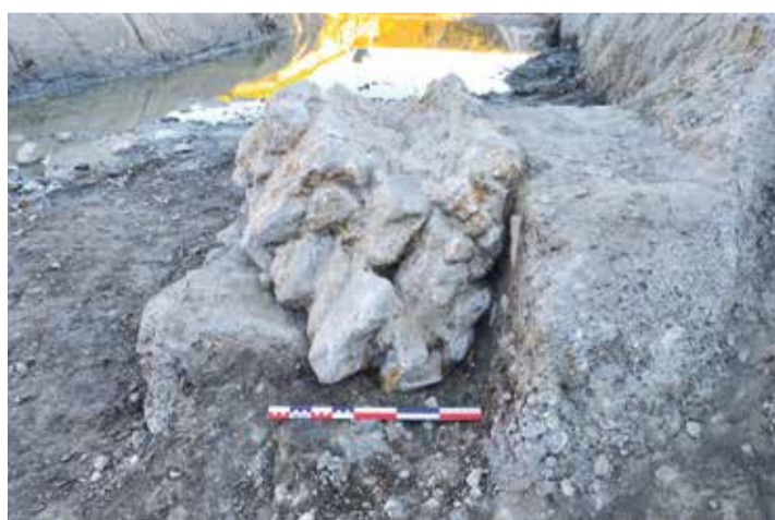
Les pans de murs renversés attestent de l'éboulement.

Cette révélation doit beaucoup au hasard. Les archéologues ont creusé à Noville, en amont de l'aménagement d'un canal de collecte des eaux usées. «C'était de l'archéologie préventive, détaille Morgan Millet. Nous savions que cette zone pouvait receler des vestiges. Nous avons donc fait des sondages, sous l'impulsion de l'archéologie cantonale. Et au vu des résultats probants, elle a décidé de réaliser une fouille approfondie.»