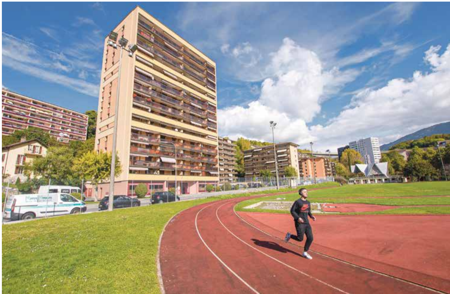
Le stade d'athlétisme de Copet III aurait dû disparaître pour faire place à un grand collège, mais le projet a été recalé.

«On parle d'une surface énorme, d'un stade qui est souvent vide en dehors des matches. On peut donc envisager d'y installer des activités pour motiver les gens à se rendre dans ce quartier et en faire un lieu de rencontres. Ce serait une réelle plus-value!» C'est dans cette logique que le conseiller communal a esquissé plusieurs pistes, notamment le fait de créer un restaurant ou une UAPE, qui seraient selon lui