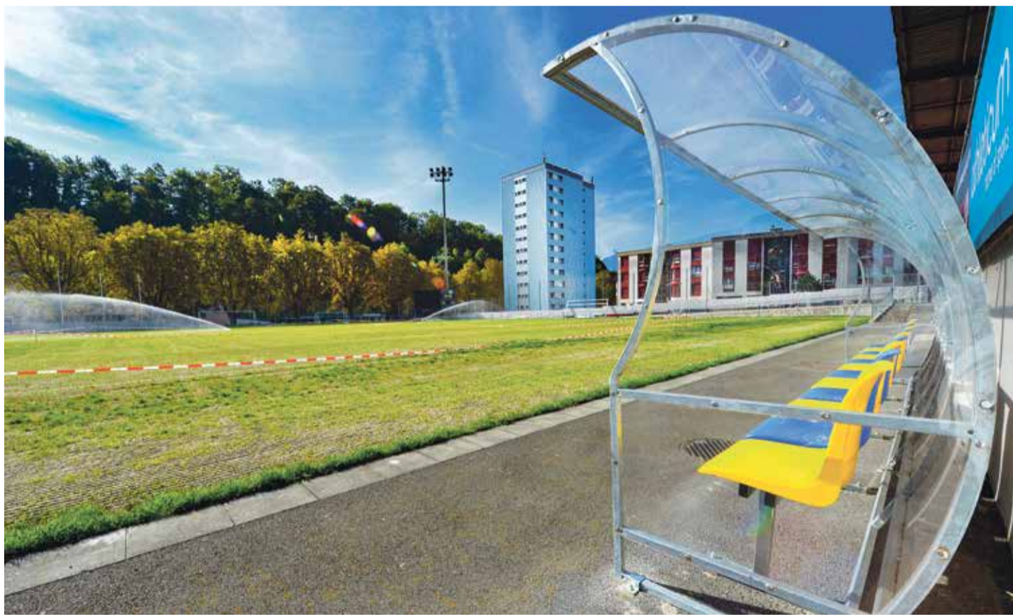
Outre ses structures vieillissantes, le terrain de foot a connu certains soucis, dont des problèmes de pelouse en 2017.

«une bonne façon d'utiliser l'infrastructure durant la journée».