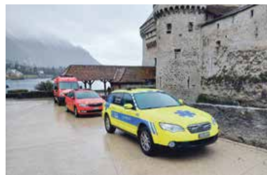
Ambulanciers et sapeurs ont oeuvré en synergie.