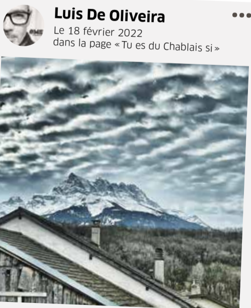
Les Dents du Midi à l'instant... 🌄