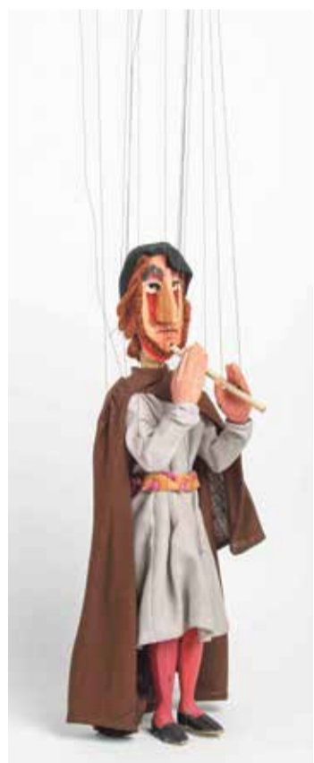
Différentes techniques sont utilisées au fil des années.