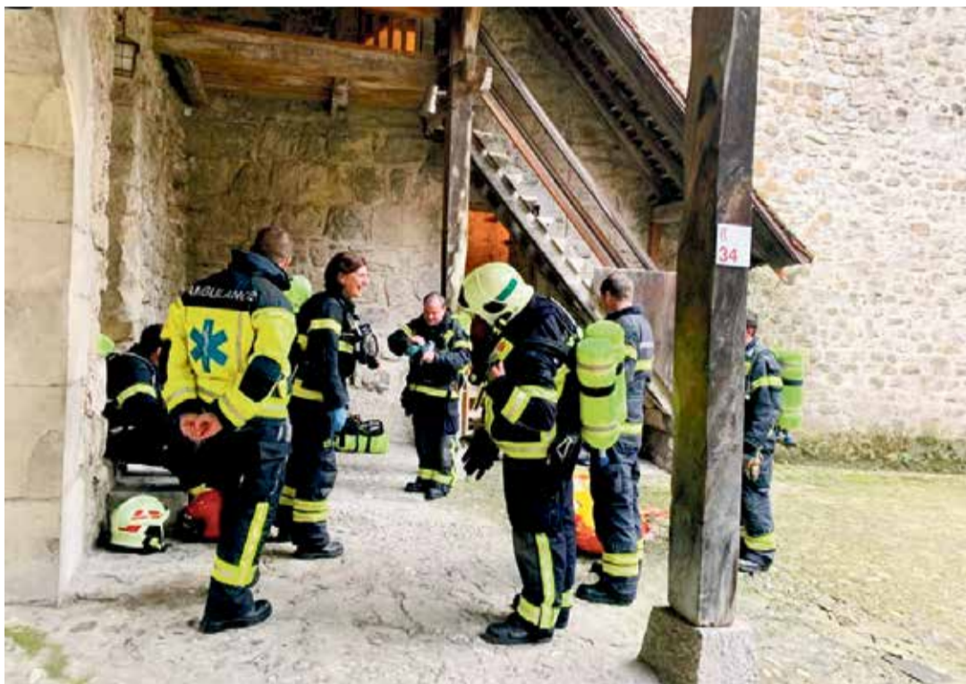
L'ambiance est au beau fixe en marge de l'intervention.