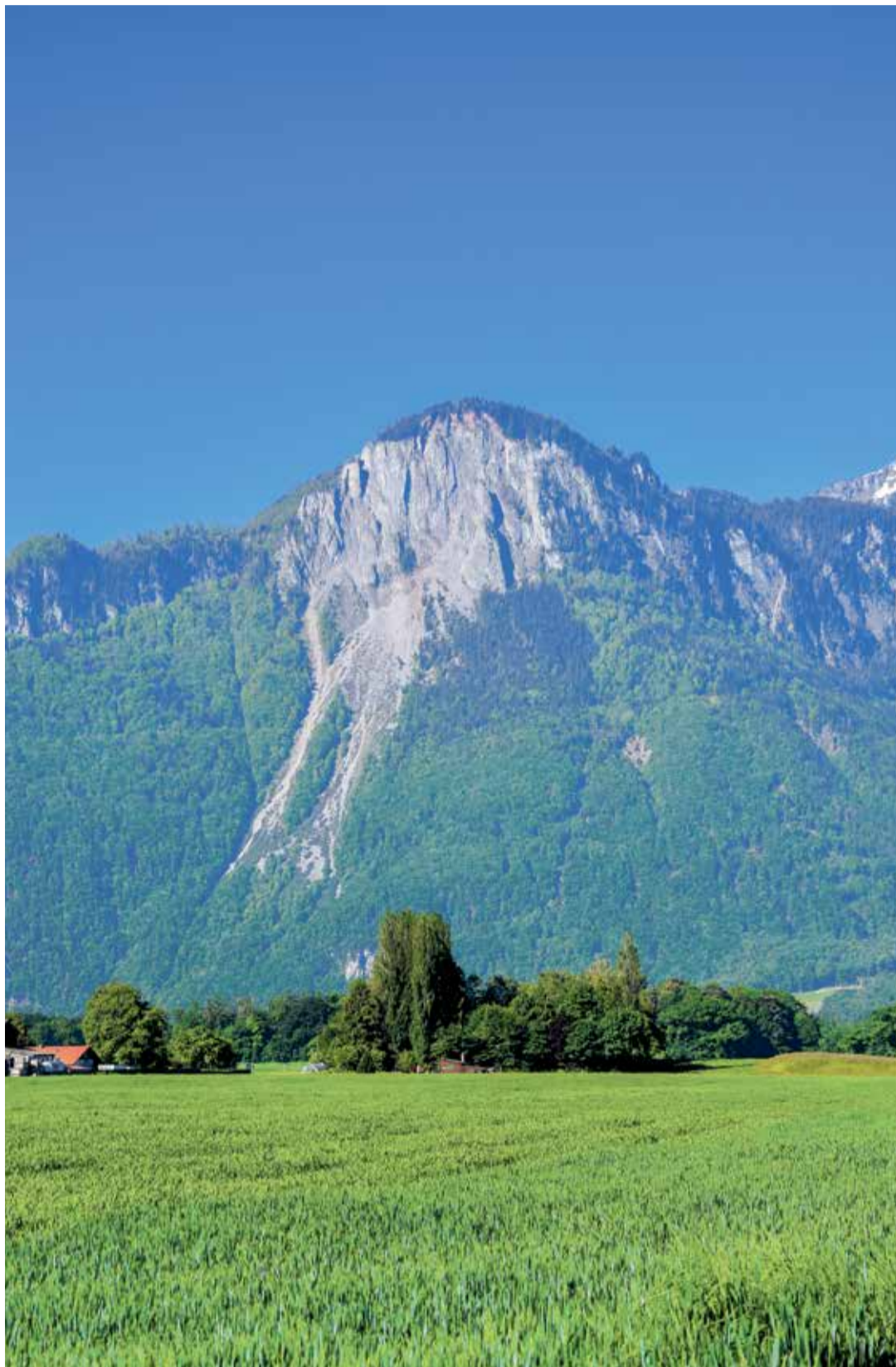
Il s'agit bien d'une partie du massif de la Suche qui s'est effondrée sur la vallée en 563.

Le caractère exceptionnel de cette découverte indique que