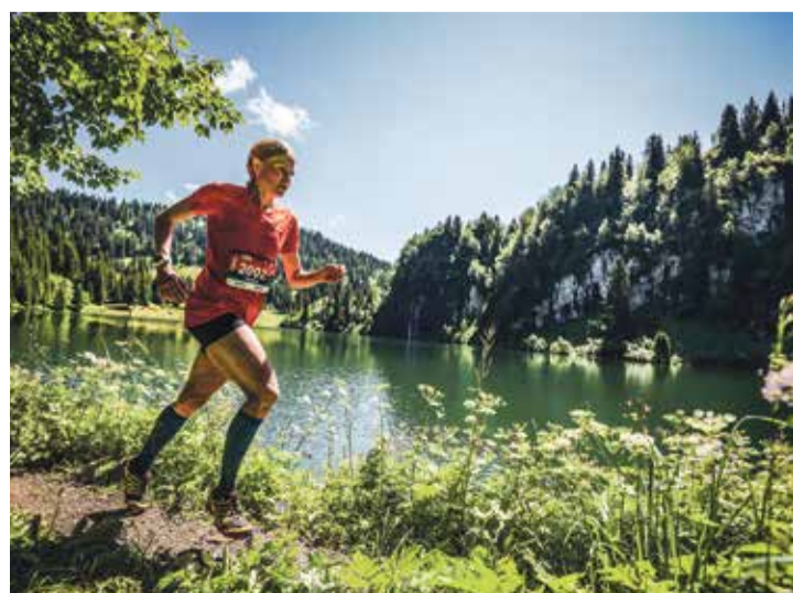
Sur les trois boucles, les coureurs pourront reprendre leur souffle lors du passage qui longe le lac des Chavonnes.