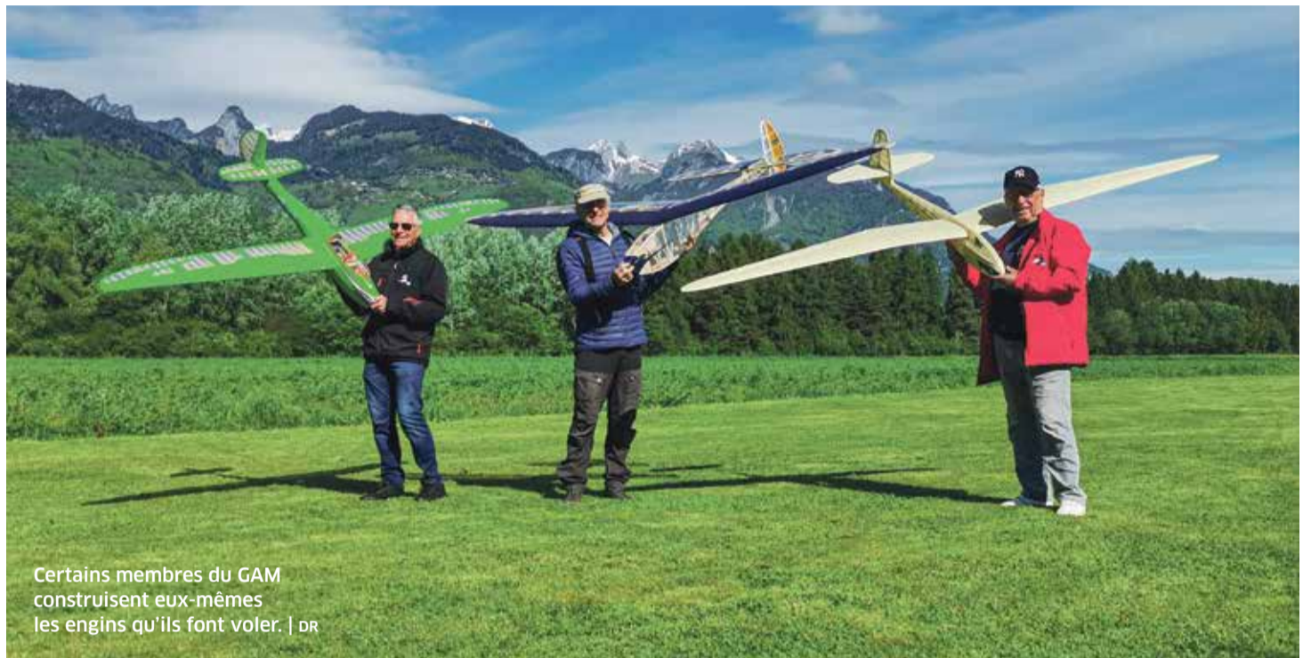
Certains membres du GAM construisent eux-mêmes les engins qu'ils font voler.