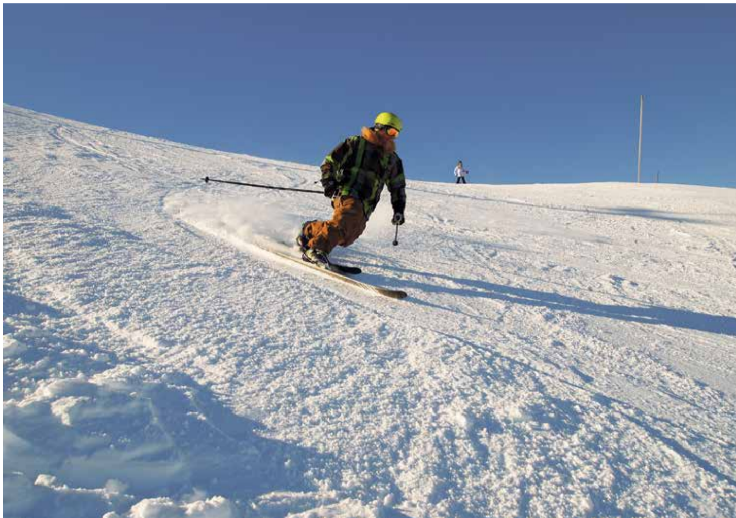
Le côté libre et atypique du télémark en fait une discipline sportive de plus en plus prisée.