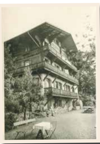
La Pension Bellevue en 1945.

Si le propriétaire et maître queux ravit les papilles gustatives de ses pensionnaires, les lieux, «joli but de vacances», offrent confort et modernité aux hôtes de passage. Dans un prospectus datant de 1935, on lit à propos de la pension: «C'est un grand et beau chalet, dont le sous-sol et le rez-de-chaussée sont en pierre. Il est composé de trois étages et contient de multiples galeries ainsi qu'un grand nombre de chambres très ensoleillées; grande salle à manger, salon intime, véranda vitrée, bain, chauffage central et séchoir pour vêtements de courses ou de sports. Lumière électrique dans chaque chambre. La pension est entourée de plusieurs jolies terrasses qui permettent aux hôtes de s'y installer par petits groupes et de jouir depuis celles-ci de la vue sur les montagnes qui s'étendent majestueuses devant leurs yeux.»