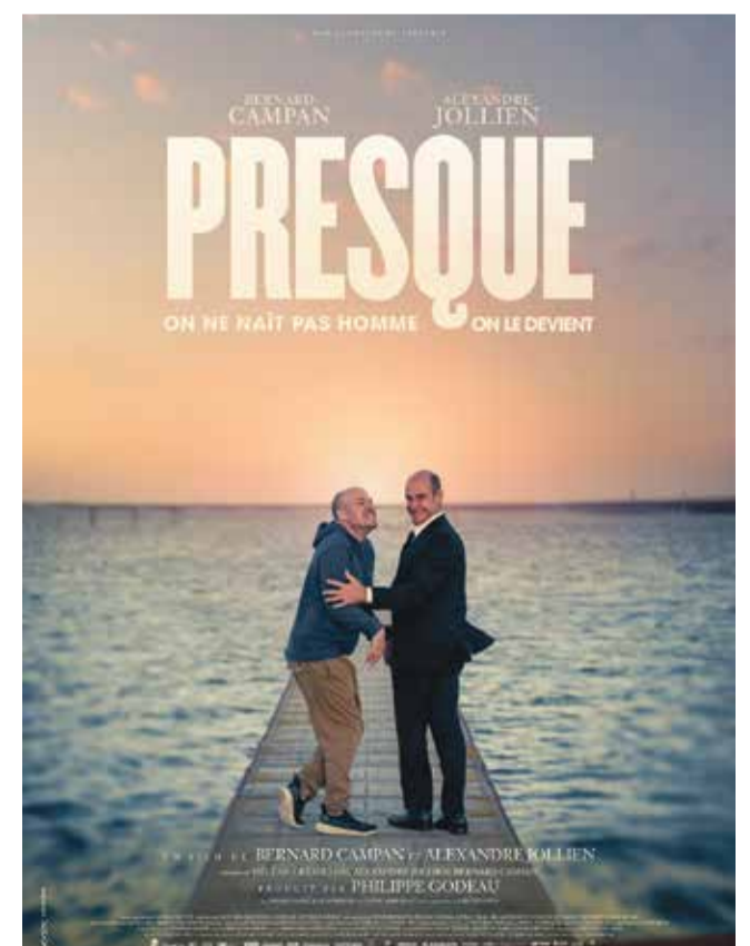
Le film avec Alexandre Jollien et Bernard Campan est à l'affiche en Suisse romande actuellement.

Il fut un temps où Alexandre Jollien habitait à La Tour-de-Peilz. Nous sommes beaucoup à l'avoir vu passer, alors, sur son étrange tricycle, qui apparaît d'ailleurs dans la première scène du film. En juillet 2012, ce précieux cheval de fer avait été volé, puis, si je me souviens bien, retrouvé. Oui, allez-y à pied, à vélo, ou en tricycle, comme vous voulez, mais allez au cinéma savourer les dernières prouesses de ce philosophe hors du commun, qui sait faire de son handicap un art de vivre, de sourire et de rire. Et foncez en librairie acquérir les livres de Jollien que vous n'avez encore pas lus, pour découvrir encore mieux cet homme qui tremble et traverse son existence pas simple en se penchant et en titubant sans se plaindre et en distribuant de la belle humeur autour de lui.