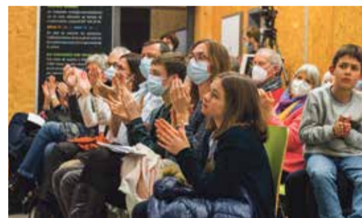
Le public est venu nombreux écouter l'hommage à Astor Piazzolla, né en 1921.