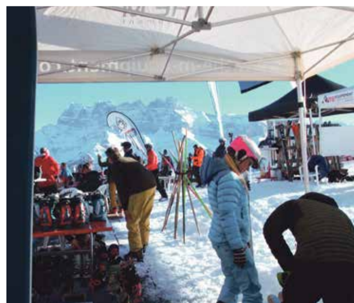
À Morgins, les 15 et 16 janvier derniers, matériel et conseils étaient mis à disposition des nombreuses personnes intéressées.