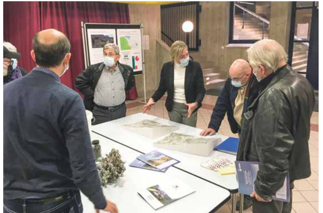
Dans le cadre de la campagne en vue du vote du 13 février, la Commune de Port-Valais a organisé le mardi 18 janvier une présentation publique du projet pour susciter le débat.