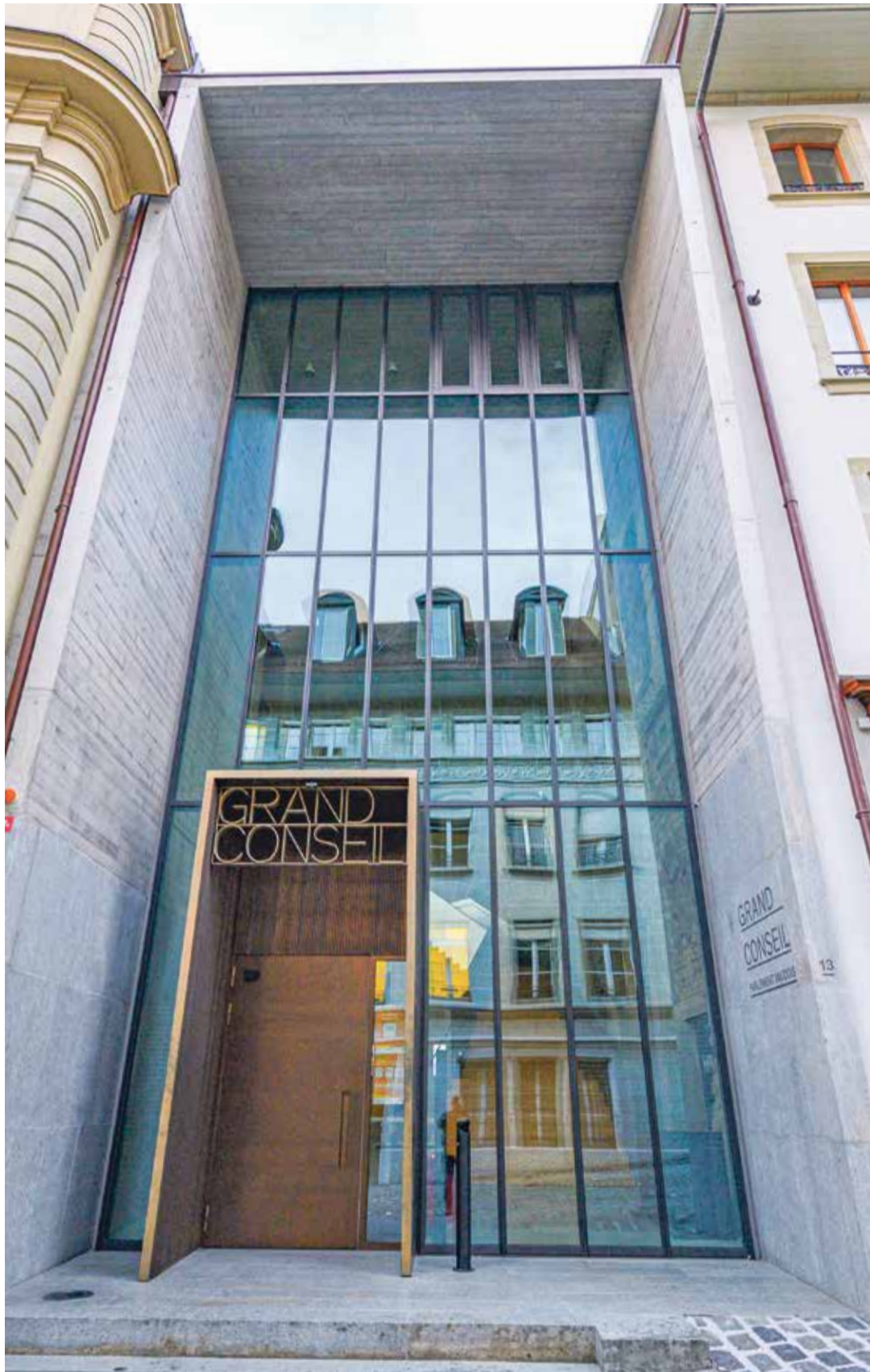
Les neuf députés sortants de la région veulent tous continuer de pousser la porte du Parlement, mais le Chablais a perdu un siège par rapport à la dernière législature.