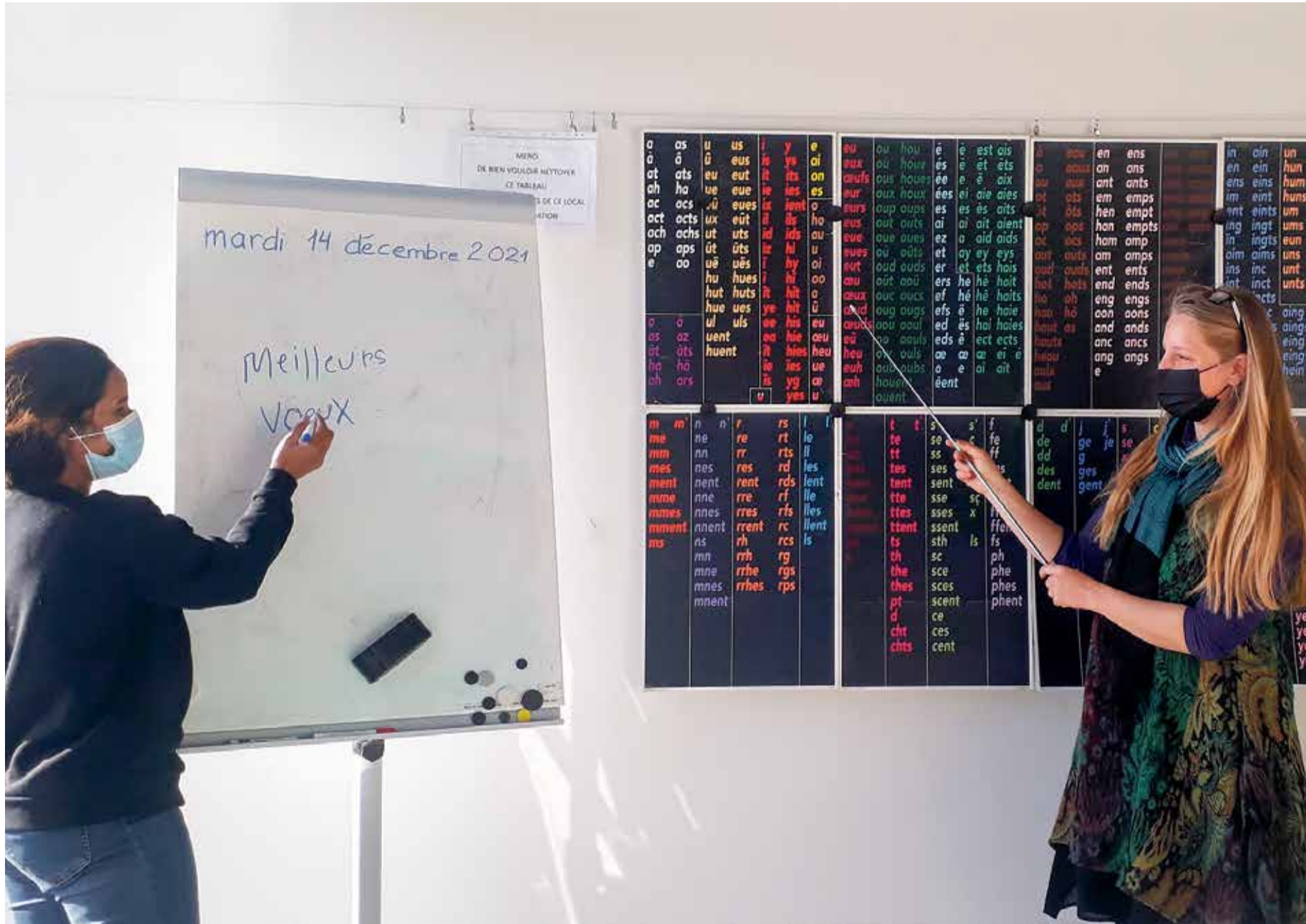
Les cours dispensés par Lire et Écrire s'étoffent et se développent en fonction des besoins.