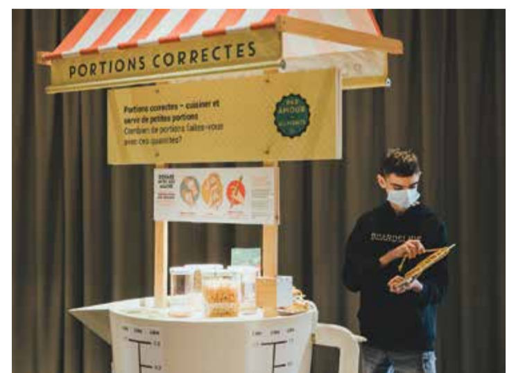
À la fin, un quizz de connaissances acquises est proposé aux visiteurs.