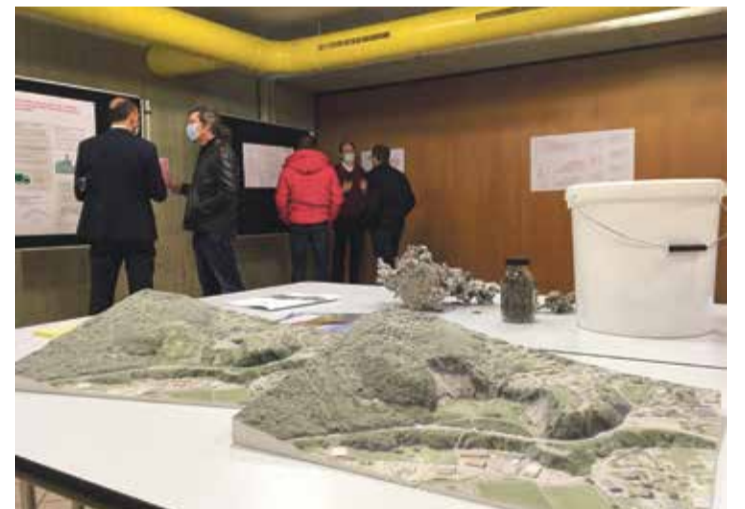
Le Châtelet, avant et après le remblayage prévu par la Satom.

calibrer le projet. Les mesures anti-nuisances? Des capots de machines insonorisés, des systèmes d'eau pour écraser les poussières, etc. Daniel Baillifard a répondu à tout, posément. Alors, convaincu? «Je trouve que l'information est un peu orientée. 66% de surface de plus, c'est beaucoup, et ça se retrouvera au niveau des nuisances.» Edouard Germanier se dit au contraire «rassuré au vu des techniques utilisées pour limiter l'impact». Verdict le 13 février.