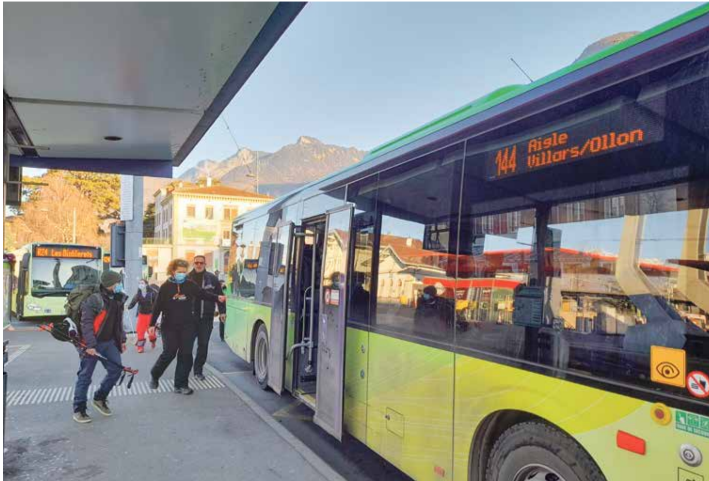
Grâce à la nouvelle desserte entre Aigle et le Roc d'Orsay, les Lausannois peuvent gagner les pistes en moins de 1h30.

L'entreprise s'attend à voir augmenter la part d'usagers privilégiant les transports en com-