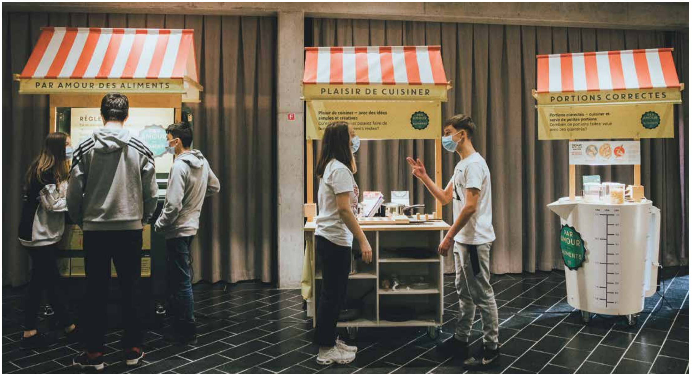
L'exposition, actuellement au foyer du Théâtre du Crochetan à Monthey, est majoritairement ouverte aux écoles valaisannes. Ici des élèves du Cycle d'orientation de Monthey.