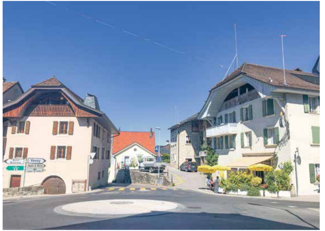
Datant de 1842, la bâtisse abritant le Café du Raisin (à dr.) pourrait être rasée.