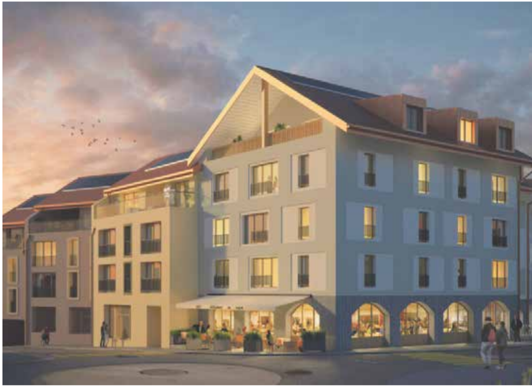
Le nouveau quartier devrait proposer une soixantaine de logements.