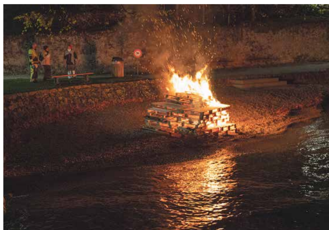
La célébration religieuse a eu lieu sous un déluge de pluie-neige et dans un froid polaire.