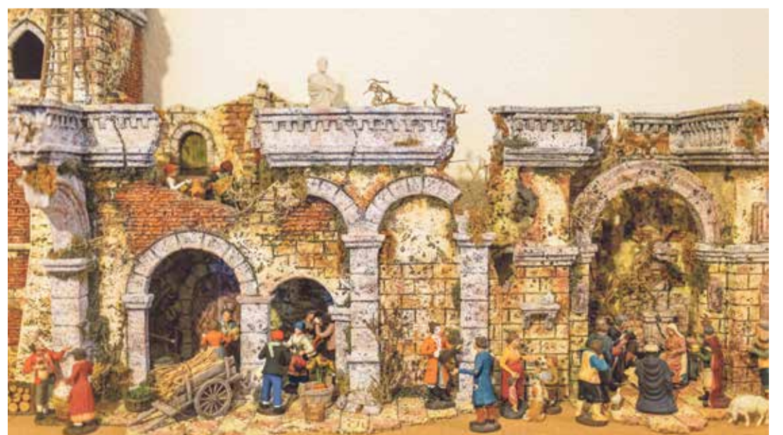
Après un minutieux travail de peinture et de décoration, les santons peuvent investir les lieux.