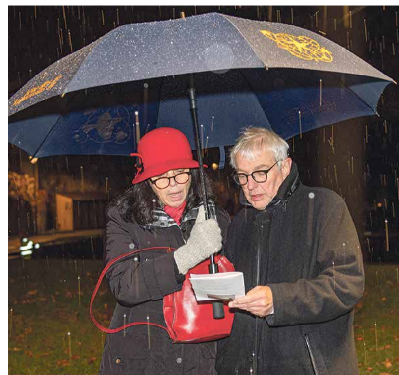
Chants, prières et recueillement avant d'allumer le feu.