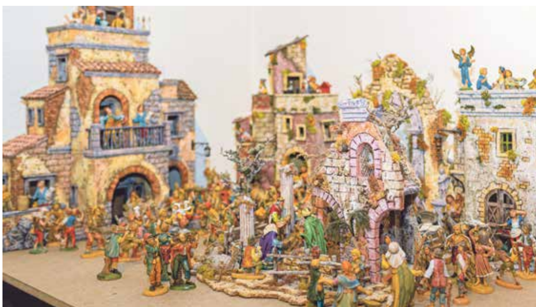
Les crèches napolitaines du Boéland mêlent ruines antiques et architecture traditionnelle italienne.