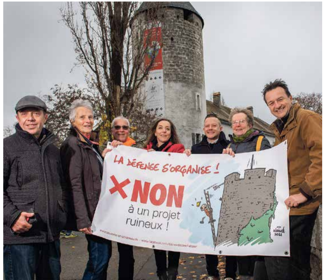
Le comité référendaire contre le projet savourea sa victoire.