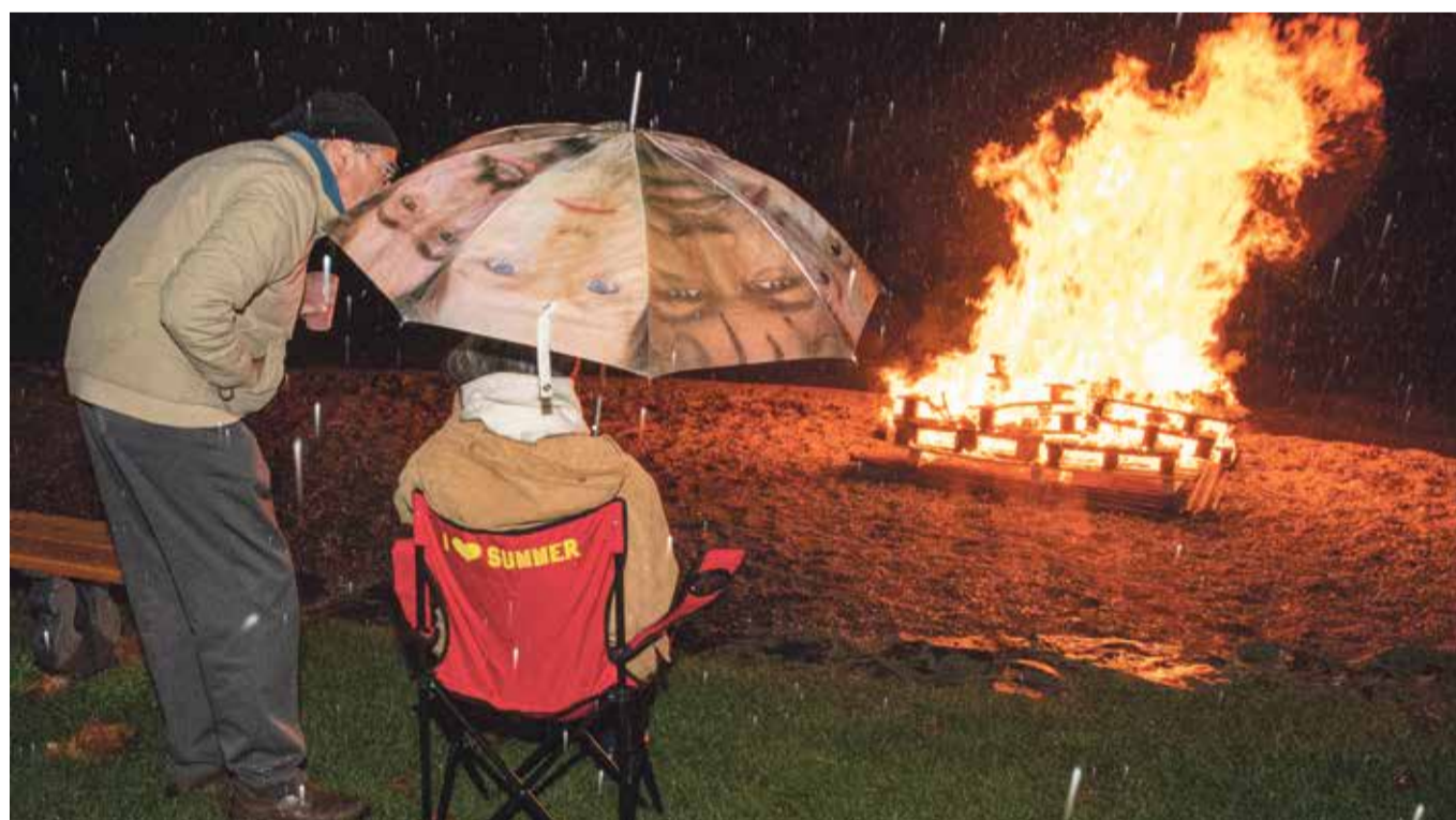
Après la fête, place à la contemplation un verre de vin chaud à la main.