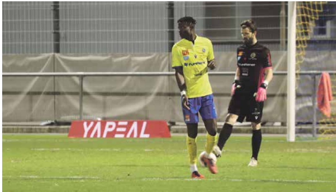
À l'issue du premier tour, Vevey-Sports vise encore les sommets.