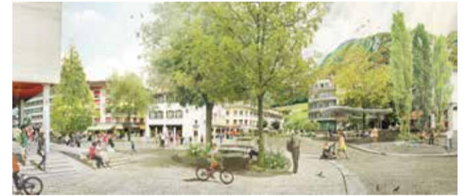
La future place du Marché d'Aigle veut donner de l'espace aux piétons.

La Commune avait invité en janvier 2019 les acteurs locaux à s'exprimer sur leurs attentes. Elle a ensuite chargé quatre équipes composées d'architectes paysagistes, ingénieurs en mobilité et ingénieurs en environnement d'esquisser leur vision de l'espace. Ceux-ci se devaient d'intégrer des thématiques telles que les aménagements paysagers, les flux de mobilité, la mise en valeur du patrimoine, l'accessibilité des usagers ou la facilité d'entretien. DGE