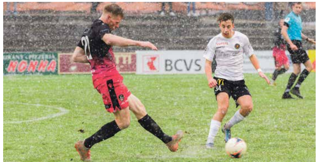
9 e à la mi-saison avec 17 points, le FC Monthey est à mi-chemin sur les 34 qu'il espère engranger d'ici à la fin du championnat.

des clubs vaudois derrière le Lausanne-Sport mais devant Yverdon et Stade Lausanne Ouchy, en Challenge League. Des anciens membres d'il y a 30 ans reviennent au club et des nouvelles confréries vont être créées. À Vevey, on veut bâtir le futur sur le passé. La faillite de 2005 semble donc n'être plus qu'un lointain souvenir.