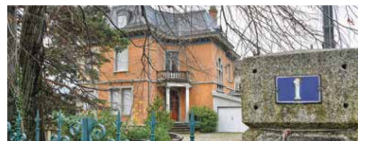
L'ancienne cure d'Aigle a été construite en 1898. Elle a été acquise en 1969 par le Canton, qui va désormais s'en débarrasser. | C. Dervev - Archives 24h

les investissements massifs à consentir ces prochaines années ont sonné le glas de cette première intention.