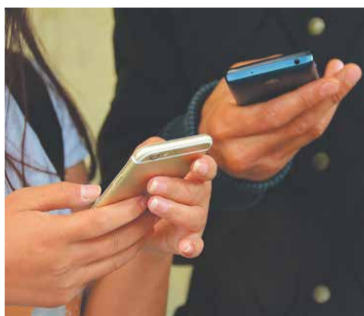
Près de 70% des élèves sondés ont déclaré avoir une préférence pour le sport et les faits divers.