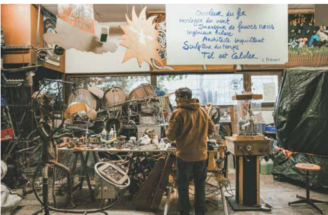
En tout, plus de 600 œuvres ont vu le jour. Autant dire que l'atelier du théâtre ne chôme jamais.

Tout le programme: www.evian-tourisme.com/sortie/le-fabuleux-village-evian-les-bains