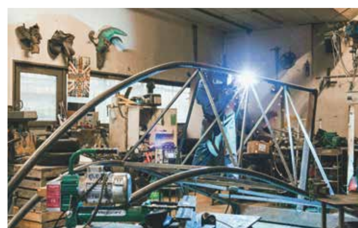
Une structure métallique portera un pianiste à 10 m de hauteur.