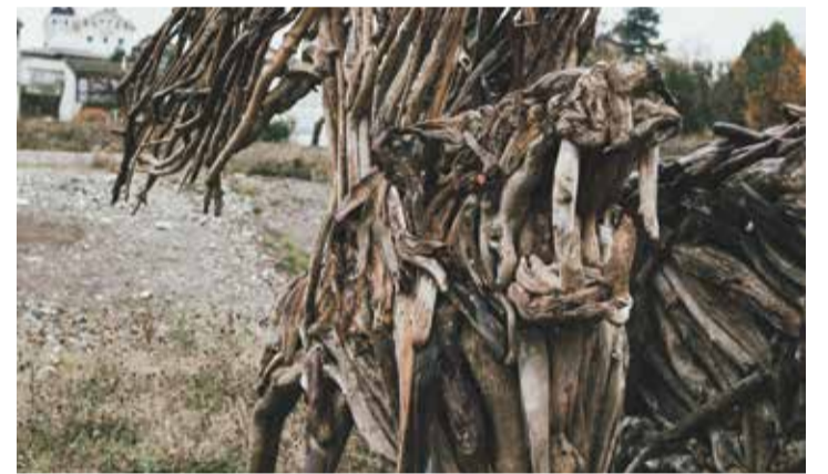
Les sculptures en bois flotté: un concept singulier et unique.