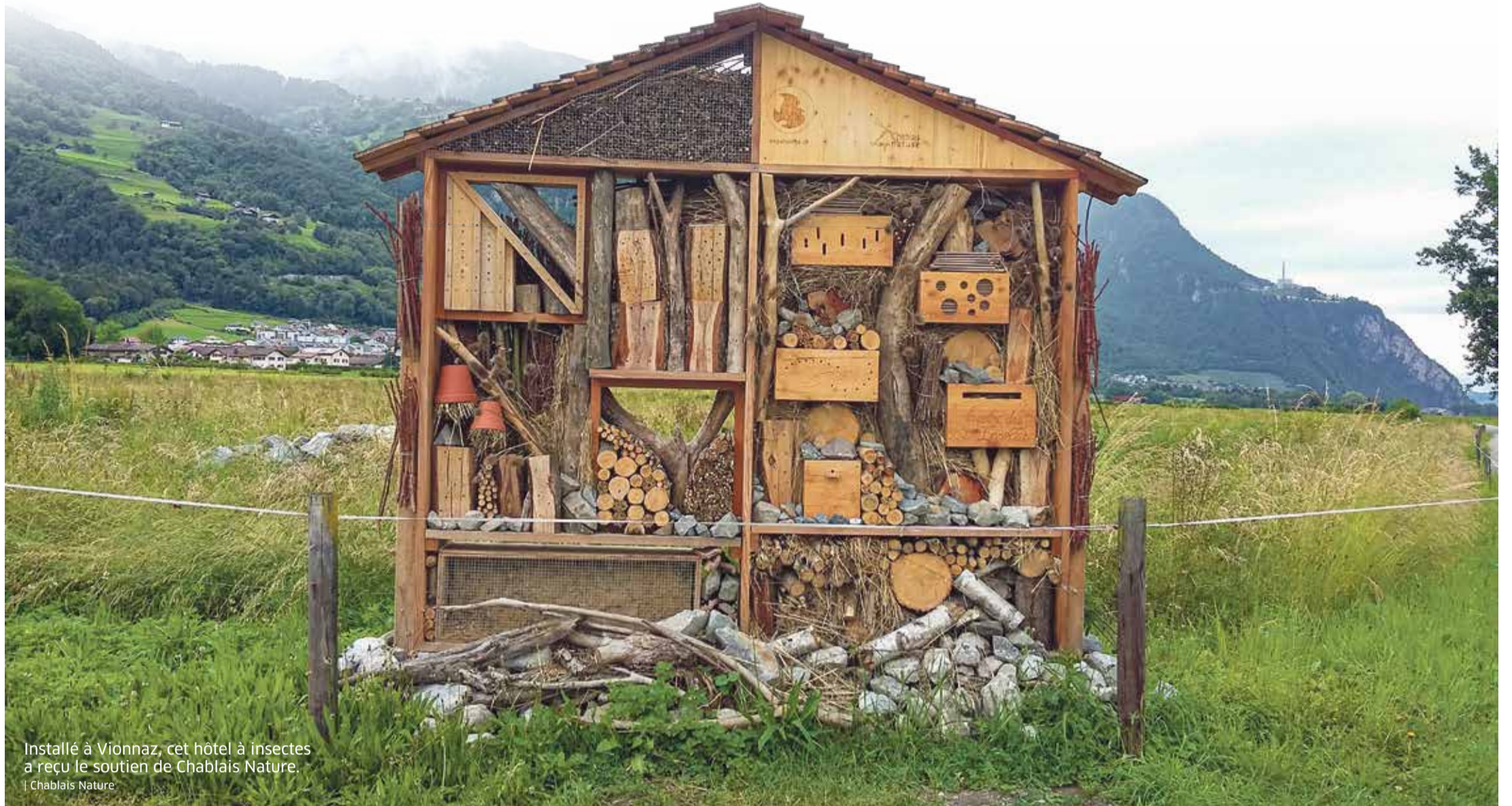
Installé à Vionnaz, cet hôtel à insectes a reçu le soutien de Chablais Nature.