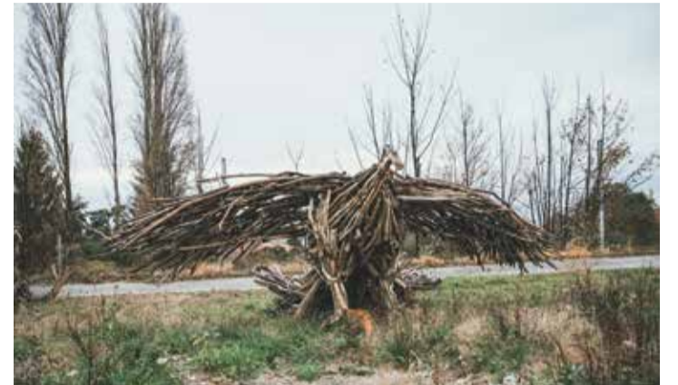
L'inspiration des artistes, amateurs ou professionnels, puise régulièrement dans le monde animal et des mythes.