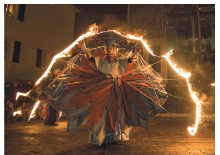
Les 10 et 11 décembre, des spectacles de feu illumineront le bourg agaunois pour la 4 e fois.

Infos et horaires: www.lumina-stmaurice.com