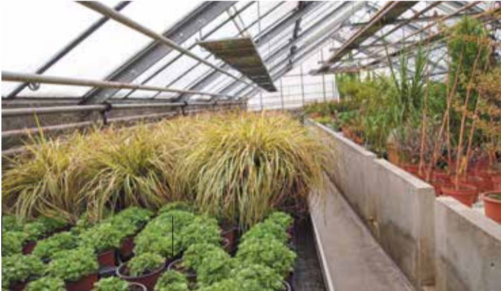
La culture horticole va être développée dès l'an prochain grâce à un projet interdisciplinaire.