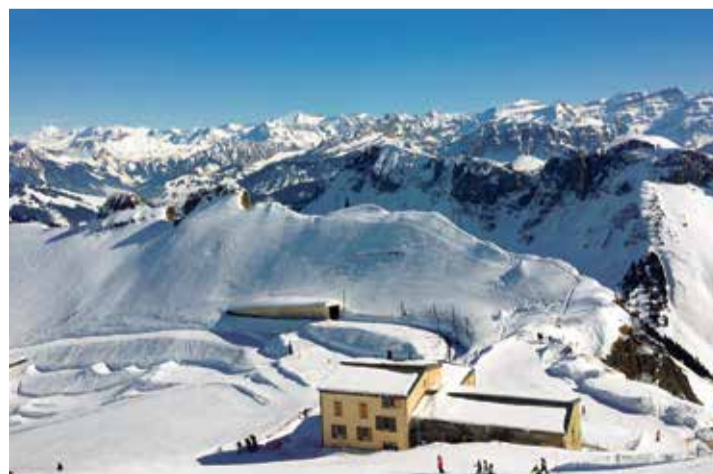
La station des hauts de Montreux doit lancer officiellement sa saison le samedi 11 décembre.

«Notre téléski à Haut-de-Caux est tombé en panne en pleine