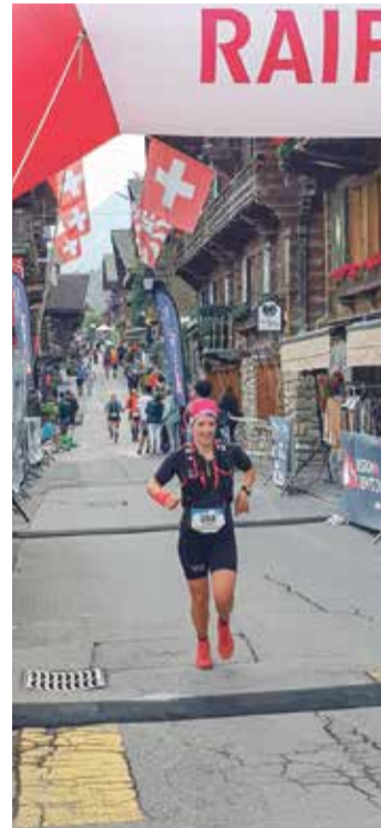
La Morginoise d'adoption est une fêve de course à pied.

Et lorsque l'on questionne la coureuse sur les méfaits de la consommation de viande, l'argument fuse: «Prenez une vache. Pour donner du lait, elle doit avoir un veau. Elle en produit plus que