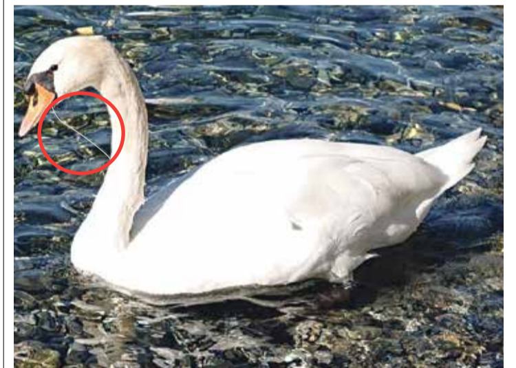
Aperçu jeudi dernier, le cygne avait avalé du fil du pêche