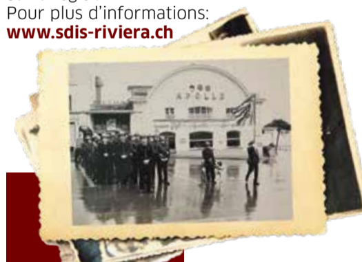
La Compagnie 6 Les Avants des sapeurs-pompiers de Montreux devant le cinéma Apollo.

Pour plus d'informations: www.sdis-riviera.ch