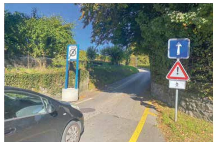
Là où la zone 30 prend fin, le gabarit du chemin rend périlleux les croisements entre voitures et piétons ou cyclistes.