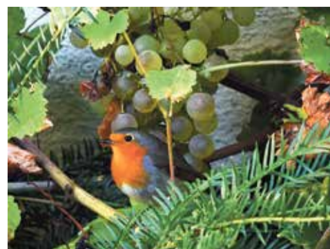
Un rouge-gorge comme un signe.

Je m'étais donc baladé et outre les images classiques de grappes et de lac, des trois soleils historiques, des vigneron à la tâche, j'avais été émerveillé par le passage des vols d'étourneaux qui débarquaient dans le ciel sans prévenir, comme des pluies de charbon, se retournaient soudain comme des assiettes noires, choisissaient le nord, puis le sud, chiaient sur mon épaule, puis de nouveau le nord, et l'est, et non là-bas c'est mieux le raisin sera meilleur, fonçons, volons, dansons, obscurcissions en nous serrant les uns contre les autres le soleil qui fait le malin. C'est fou, non, mille oiseaux ensemble, tous dans le même mouvement instantané, mille mais une seule ombre, qui font