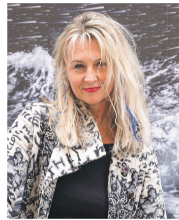
Photo portrait de l'artiste Pavlina

Des recherches qui reflètent cette prise de conscience de ce