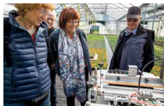
Les visiteurs observent le semoir automatisé.