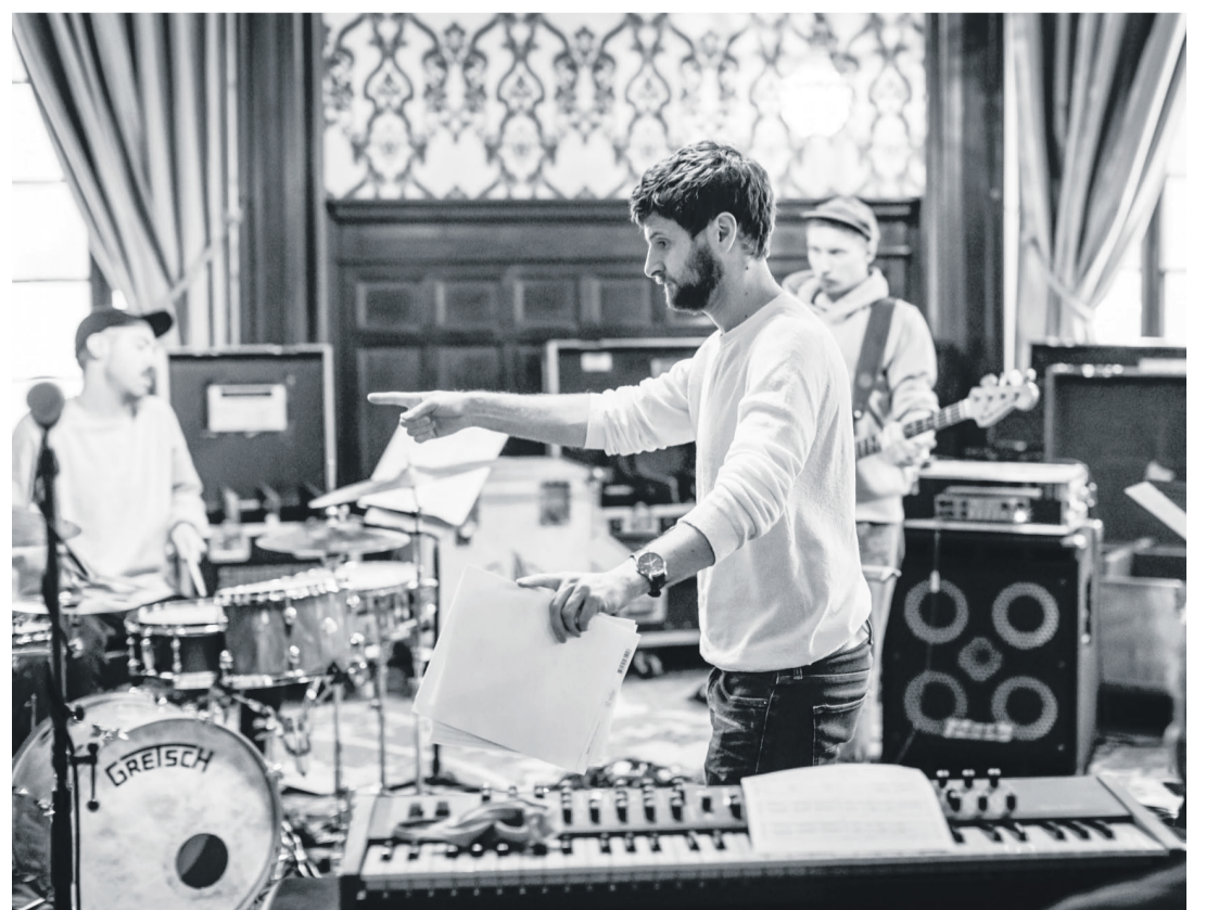
Les six participants à la Montreux Jazz Academy vont mettre en commun leurs talents pour proposer un concert inédit qui se tiendra le samedi 30 octobre, au Petit Palais, à Montreux.

Certificat Covid obligatoire. Tout le programme sur www.montreuxjazzfestival.com/fr/presse/autumn-of-music-2021/ Réservations possibles pour le concert final et pour les places assises des concerts des Swiss Rising Talent.