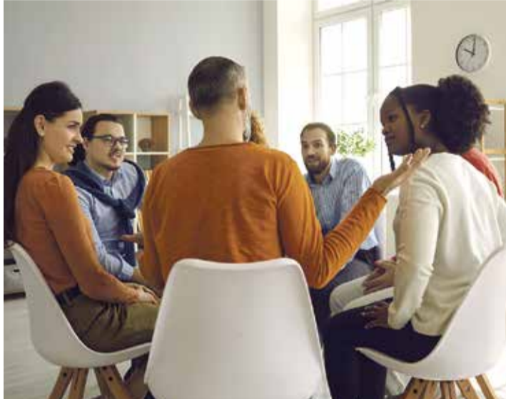
Les groupes de paroles permettent de partager son vécu et de trouver des solutions avec d'autres parents.