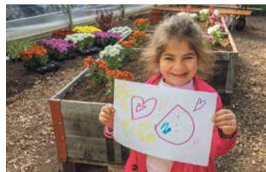
Jade Sutter a fait un dessin à l'atelier pour les enfants.