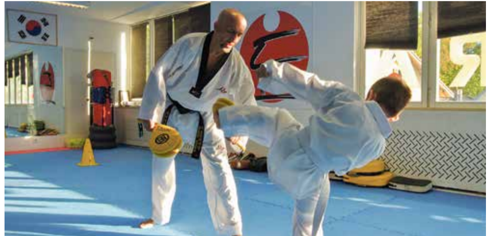
Sur les 170 membres actuels du Taekwondo Riviera une vingtaine de petits, âgés pour la plupart de 4 à 8 ans s'entraînent deux fois par semaine.

Abdenbi, 7e dan sur 9, a aussi présidé la Fédération suisse de 2008 à 2016 et donné des cours à travers toute l'Europe.