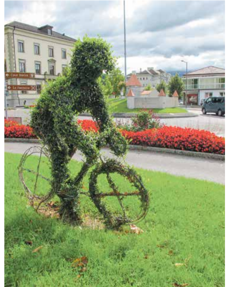
Aigle fait partie des quatre communes de la Riviera et du Chablais à viser l'obtention du label Villeverte.

Un rapport à la Municipalité de Montreux est attendu au printemps prochain, contenant les pistes d'amélioration possibles. La labellisation d'Aigle, valable 6 ans, pourrait intervenir à l'automne 2022.