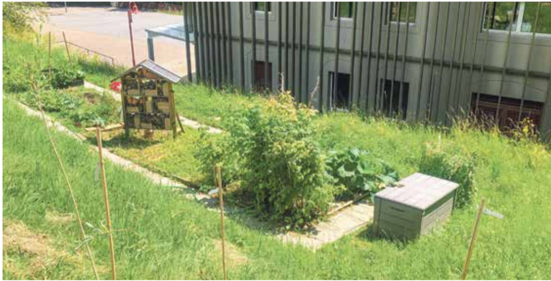
Le potager de l'école de Chernex a été le théâtre de vols et d'actes de vandalisme.

Ces agissements ont évidemment marqué la centaine d'élèves de 5 à 9 ans qui mettent avec plaisir la main à la terre dans ce jardin d'une trentaine de mètres carrés. «Ils sont très déçus et aimeraient savoir qui a fait ça», sou-