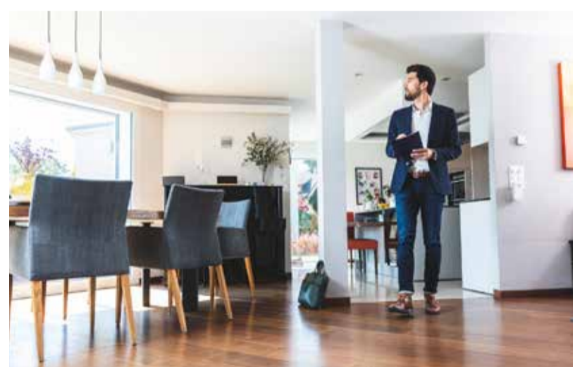
Évaluation sur place par un agent immobilier Neho.

Réponse : Tout d'abord, je pense que le fait de payer un forfait compétitif de seulement CHF 9'500.- au lieu de 3% en moyenne de la valeur de votre bien est l'un des avantages majeurs. Deuxièmement, notre base d'acheteurs. En tant que leader du marché, nous proposons de nombreux biens à la vente chaque mois. Ces biens génèrent de l'intérêt auprès d'un grand nombre d'acheteurs potentiels qui sont ainsi répertoriés dans une base de données en fonction du type de bien recherché et de la région. Lorsque nous proposons un bien à la vente, nous commençons par le proposer à notre base d'acheteurs. Cela nous permet de générer très rapidement de l'intérêt et ainsi