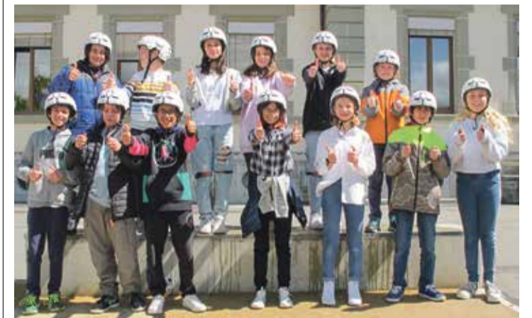
La classe 7P de la Grande-Eau presque au complet.