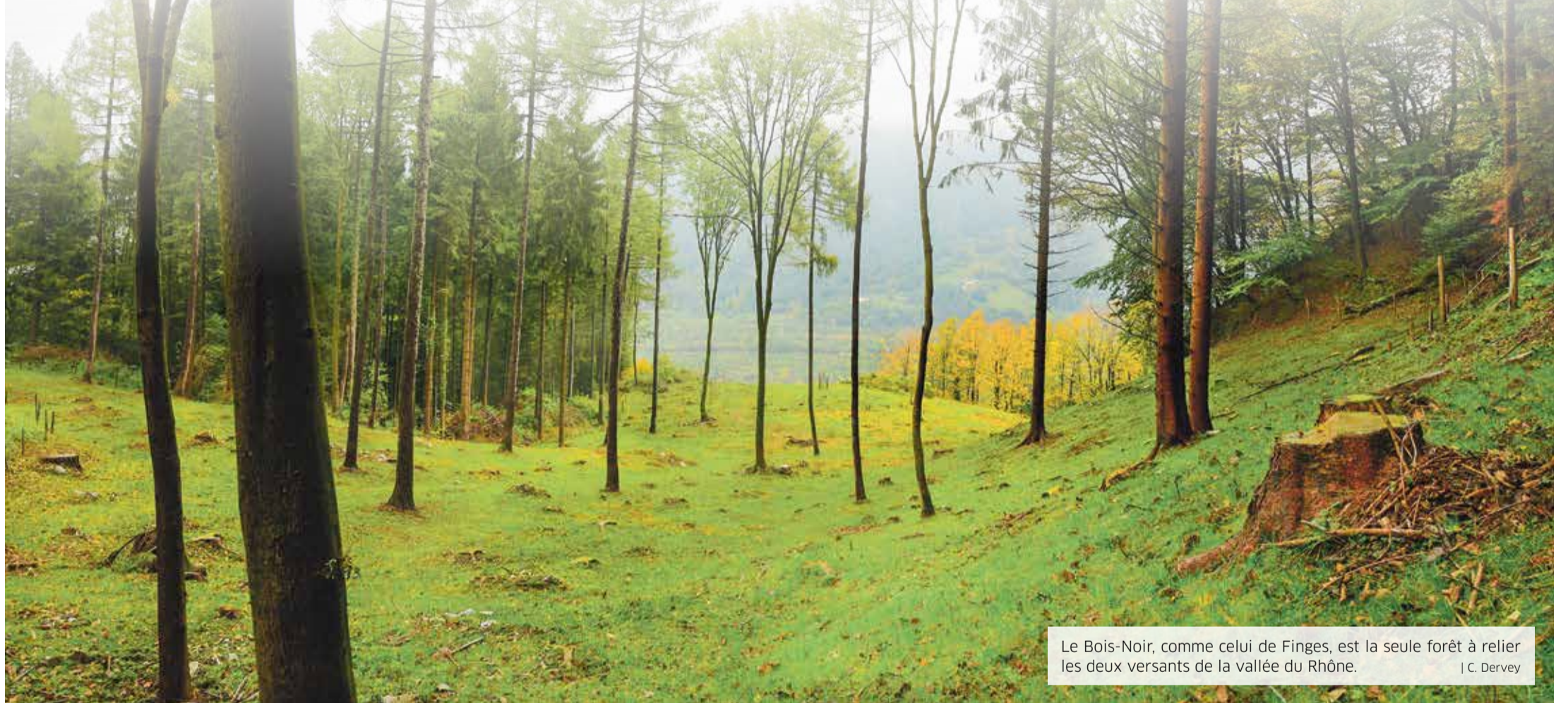
Le Bois-Noir, comme celui de Finges, est la seule forêt à relier les deux versants de la vallée du Rhône. | C. Dervey