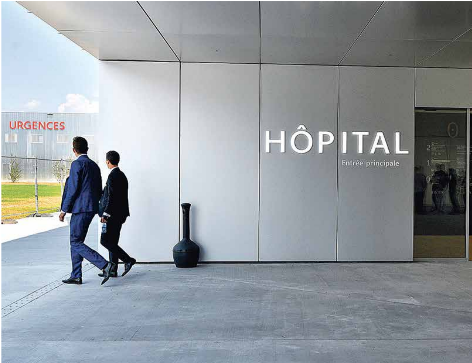
Avec le Covid, l'Hôpital Riviera-Chablais a été soumis à une très forte pression. Une enquête a fait le point auprès du personnel.